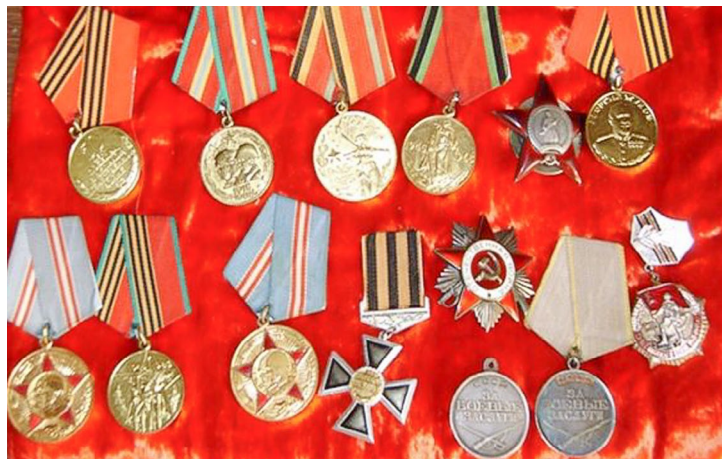
Ордена и медали за проявленные в боях доблесть и отвагу

Подготовил к публикации Сергей ЗЯБРИН