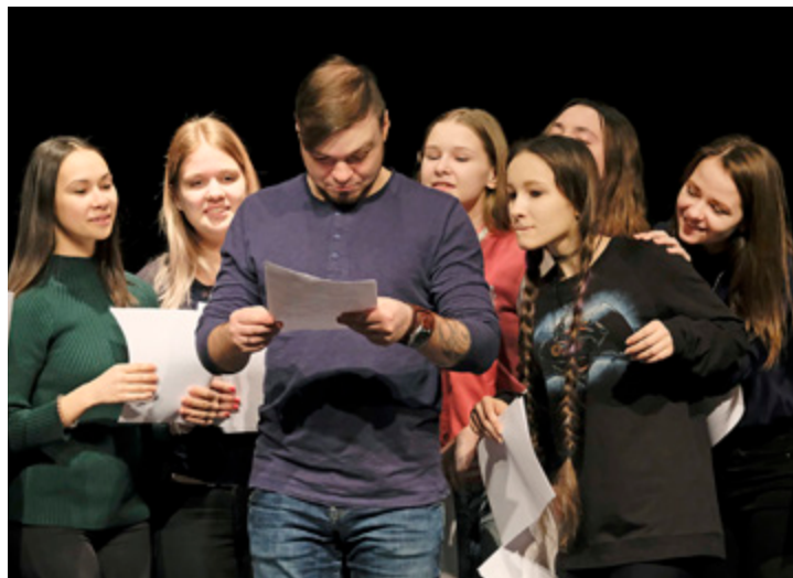
Совместный театральный урок школьников и артистов «Северной сцены»