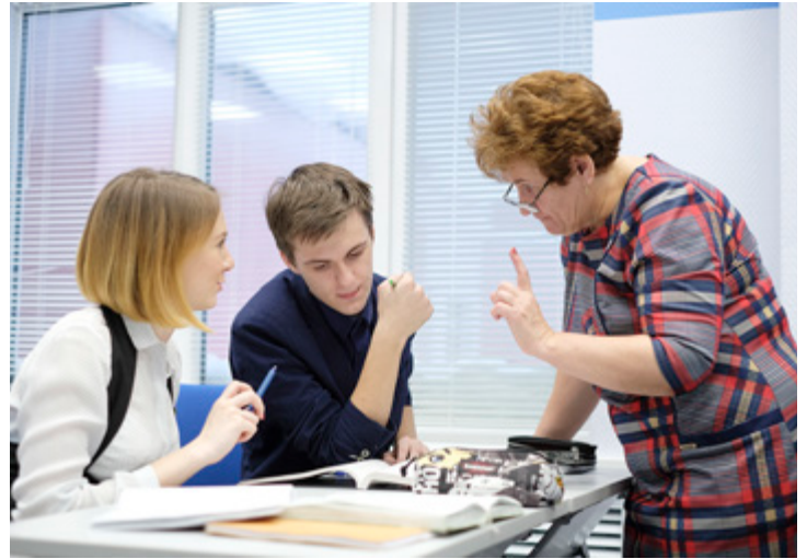
Учеба в «Газпром-классах» требует больших знаний и усилий...

В кабинете всего 12 человек – шестеро детей, столько же родителей. На 14 заданий и сочинение – лишь 40 минут. Важно знать: при сдаче ЕГЭ следует все правильно заполнить – разборчиво, печатными буквами. Опытные старшеклассники сначала решают задания в черновиках, и только после тщательной проверки переносят ответы на бланк. Этому ребята научили и родителей. Запись в чистовик – на последних минутах теста.