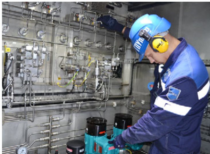
...а станция управления фонтанной арматурой от ФПК «Космос-Нефть-Газ» уже успешно прошла стадию опытно-промышленной эксплуатации