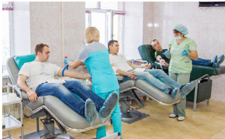
Молодые специалисты Общества «Газпром добыча Уренгой» в отделении переливания крови

– Желание принять участие в акции у меня возникло давно, но каждый раз дальше дело не шло. Вот и сейчас я боюсь, вдруг станет плохо. Однако, настроена решительно.