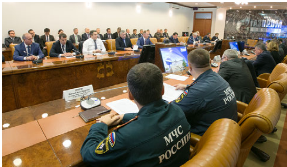
В работе круглого стола приняли участие представители газодобывающего предприятия и государственных контролирующих органов

Завершением встречи стало посещение Музея истории Общества.