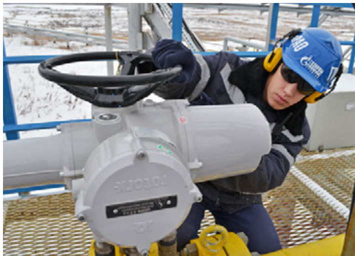
Регулятор давления производства компании «АК Корвет», находящийся сейчас в опытно-промышленной эксплуатации на газоконденсатном промысле № 22, показывает себя с лучшей стороны...

Большинство установок комплексной подготовки газа были введены в эксплуатацию в 80-е годы XX века по типовым проектам на базе основного технологического оборудования российского производства. Дожимные компрессорные станции в основном были