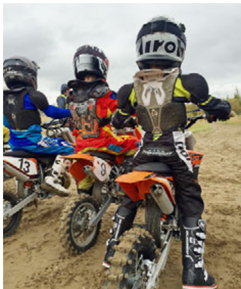
«Факел» на старте