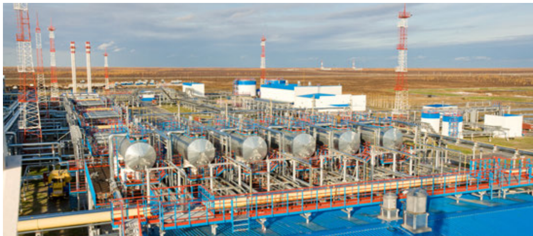
Газоконденсатный промысел № 22

Дополнительную информацию можно получить по телефону 94-12-11 . Резюме направлять на адрес электронной почты resume.utni@gd-urengoy.gazprom.ru .