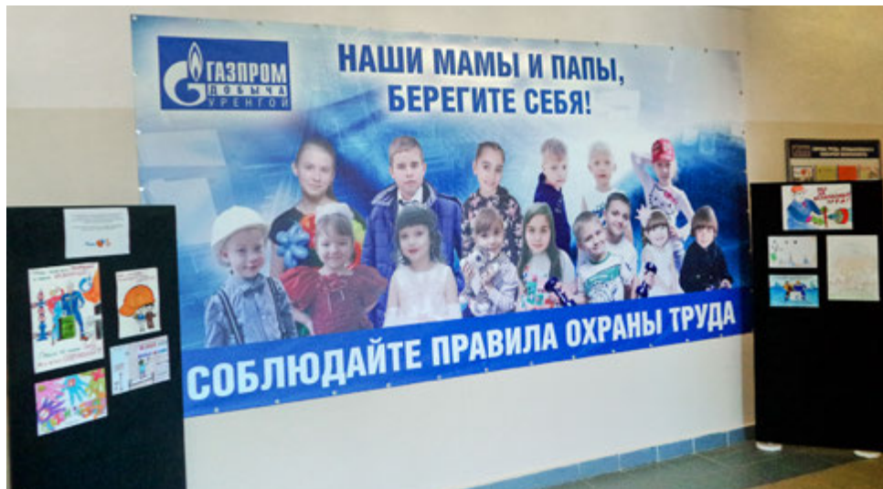
В Газопромысловом управлении по разработке ачимовских отложений подошли к неделе безопасности труда творчески