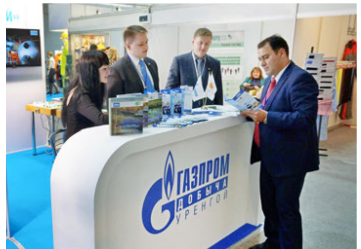
Стенд нашего предприятия вызвал интерес у многих посетителей форума

Наглядное официальное подтверждение того, что ООО «Газ-