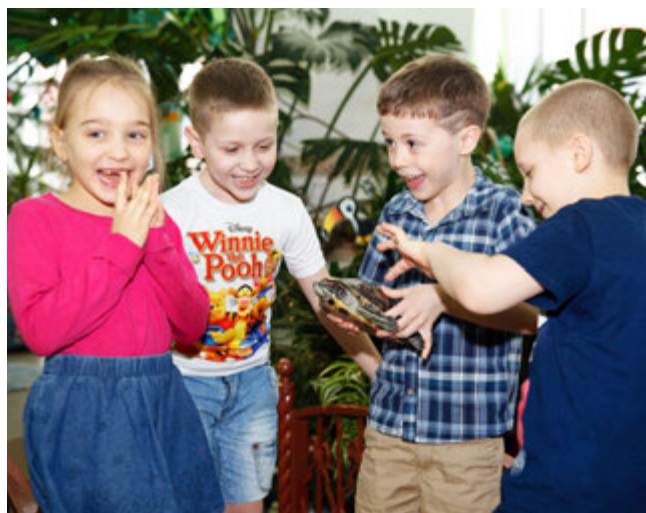
В зимнем саду «Колобка» детям всегда интересно

Детские сады Управления такие разные, но цель у них одна —