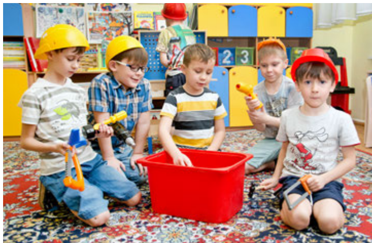
Сюжетно-ролевая игра «Строители»

вырастить умное, здоровое, счастливое поколение северян. И это благородное намерение воплощает в жизнь невероятно активный творческий коллектив. Каждый воспитатель и его помощник, повар, музыкальный руководитель, инструктор по физической культуре УДП может о себе сказать, что ходит на работу как на праздник, потому что это их истинное призвание. Зайдите в любой детский сад Управления. Здесь тепло, светло и красиво, царит позитивная энергетика, звучит детский смех и голову кружат потрясающие ароматы, доносящиеся с кухни. Так и хочется остаться в этом раю навсегда.