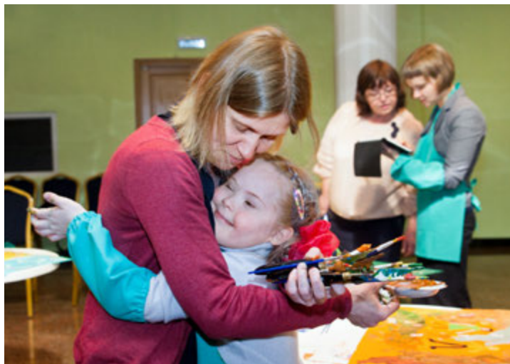
Любовь и ласка одинаково нужны всем

Этот социальный проект стал еще одним шагом на пути к созданию условий для полноценной жизни особенных детей. Благодаря социально-ориентированному предприятию — Обществу «Газпром добыча Уренгой», а также администрации города и компании Wintershall осенью 2018 года в Новом Уренгое планируется открытие первого инклюзивного детского сада.