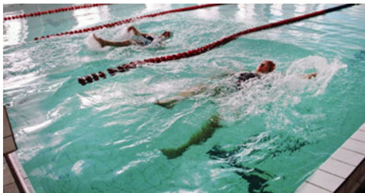
Вперед, к победе!