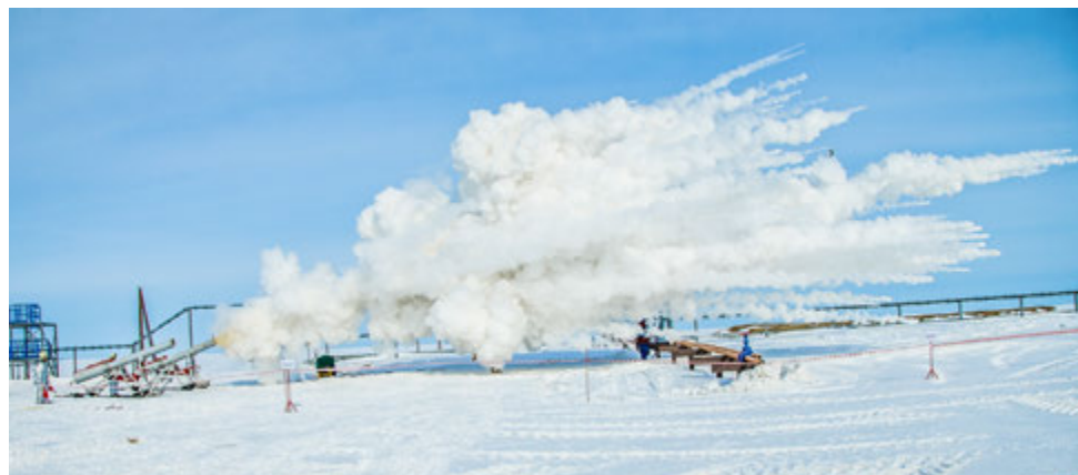
Учебно-тренировочные занятия на кусте газовых скважин Песцовой площади