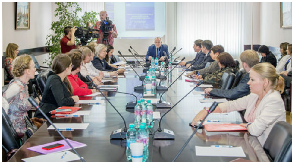
Оживленная дискуссия экологов

Часть экспозиции не связана с добычей углеводородов, но интересна своим ноу-хау. Так, новосибирские производители привезли эксклюзивное варенье из еловых шишек,