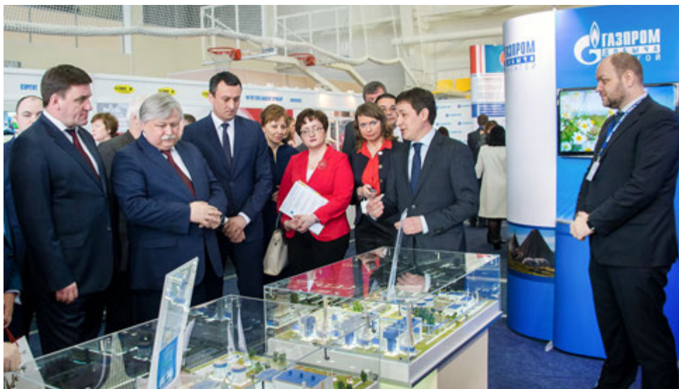
Стенд Общества «Газпром добыча Уренгой» на выставке весьма популярен

Двухдневная программа газового форума насыщена событиями. В выставочном зале делового центра «Ямал» развернулась специализированная экспозиция. Одно из центральных мест по традиции отведено красочному стенду Общества «Газпром добыча Уренгой». Взор привлекает макет, на котором можно рассмотреть все этапы технологии утилизации промышленных стоков. Кроме того, стенд дополнен двумя экранами, на которых транслируются в режиме нон-стоп