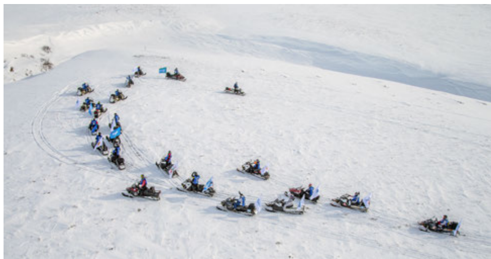
Пит-стоп с высоты птичьего полета.