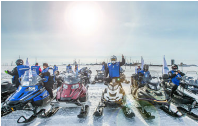
Тундра покоряется смелым и сильным духом. На технической остановке