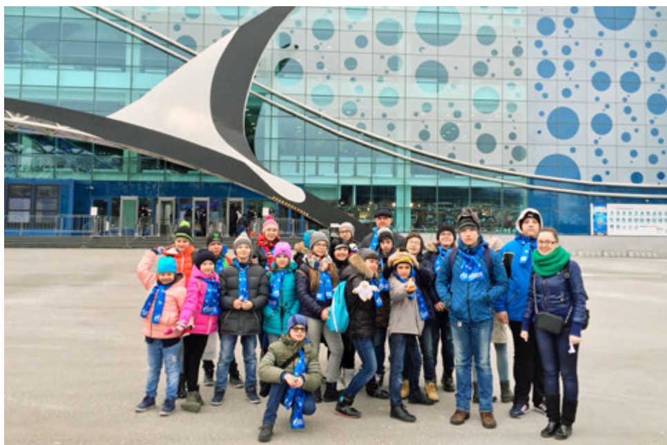
Москвариум впечатлил ребят больше всего!