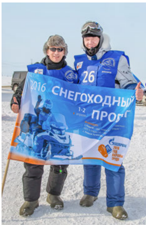
Снегоходный пробег объединяет

— Снегоходный пробег, посвященный Году охраны труда в ПАО «Газпром» — это публичный акт, призванный создать общественный резонанс. Мы хотим обратить внимание, что в нашей компании на самом высоком уровне поставлена работа по сохранению жизни людей и их здоровья. Пробег приносит удовольствие и серьезный заряд адреналина. Нигде, кроме как в северных «дочках», не проводятся такие мероприятия, — сказал член Правления ПАО «Газпром»,