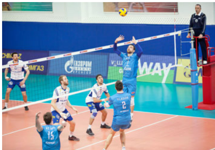
Пробить итальянскую оборону «Факелу» не удалось...

Служба по связям с общественностью и СМИ