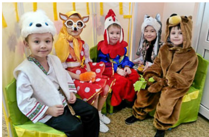
Мы веселые ребята, а на сцене мы — зверята

Каждый родитель знает, что его ребенок — особенный. И каждому хочется, чтобы он вырос общительным, уверенным в себе человеком, чтобы его природные способности и таланты раскрылись как можно полнее, и поэтому папы и мамы с удовольствием включаются в творче-