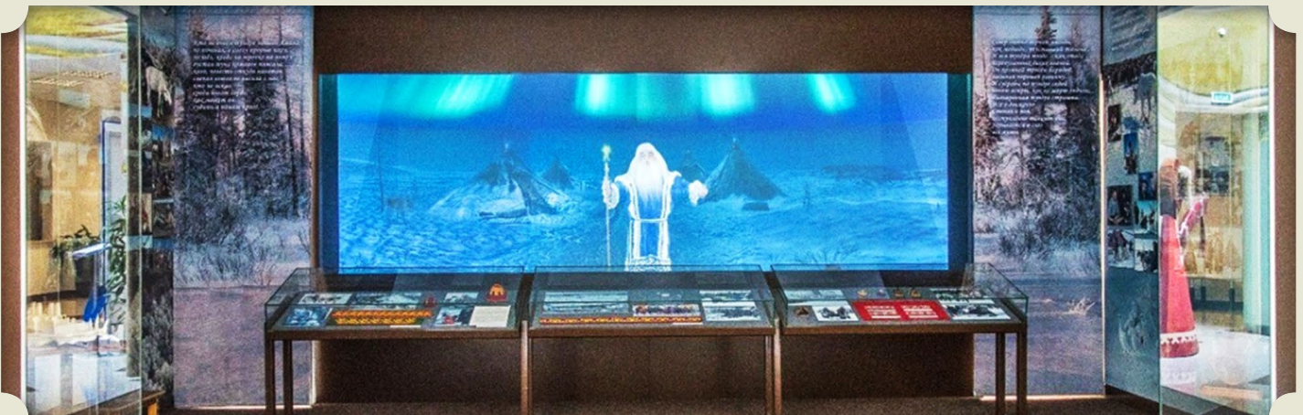
Зал, посвященный коренным народам Севера, в Музее истории «Газпром добыча Уренгой»