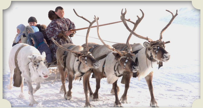
Катание на оленях для жителей города – экзотика

Первый Праздник народов Севера в Новом Уренгое состоялся 22 марта 2002 года. Горожане смогли окунуться в атмосферу самобытной культуры ненцев. На площадке перед Центром детского творчества (сейчас это «Академия талантов») в чумах можно было отведать национальные угощения. Особым спросом пользовались катания на оленях и ярмарка товаров ямальских производителей. В национальных соревнованиях – метании тынзына на хорей и прыжках через нарты – принимали участие не только тундровики, но и уренгойская детвора. Праздник стал ежегодным. Правда, в пандемию от массовых гуляний отказались, а в 2024-м сменили привычное место его проведения: с территории озера Молодежного День оленевода переместился на пляж реки Седз-Яхи.