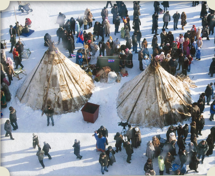
Апрель 2006 года