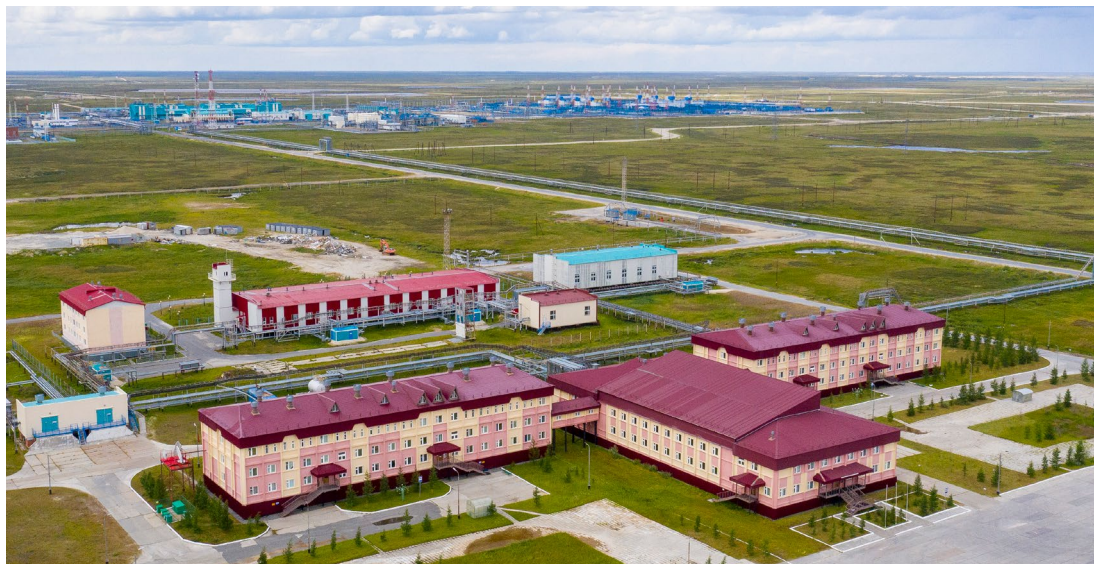
На бескрайних просторах заполярной тундры вместе с технологическим комплексом вырос и уютный поселок для работников Общества

– Наш поселок стал первым объектом из расположенных на газовых промыслах, переданным УЭВП на обслуживание. Тогда это было новым для филиала направлением деятельности, – рассказывает начальник вахтового поселка Алексей Игнатов. – В первое время для поддержания надежной работы всего комплекса хватало 14-ти человек. С его развитием росла и численность штата. Сегодня наш коллектив состоит из 60 специалистов, также трудящихся здесь вахтовым методом. Это заведующие общежитием и хозяйством, мастера, слесари-сантехники, электрики, слесари-ремонтники, вахтеры, уборщики служебных помещений, дворники. Конечно, удаленность поселка от города, его автономность накладывают