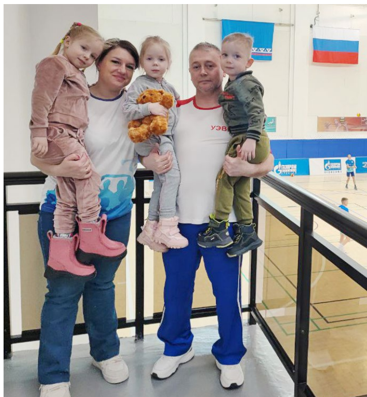
С папой и мамой – болеть за волейбольную команду филиала!