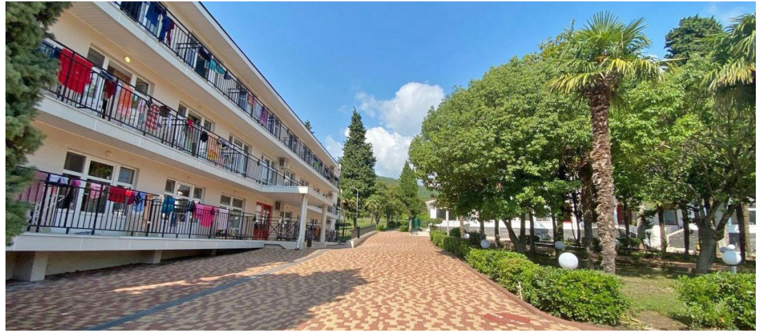
На территории детского оздоровительного лагеря «Остров Мадагаскар» уютно и комфортно

В этом году дети газодобытчиков во время летних каникул смогут отдохнуть и поправить свое здоровье в ДОЛ «Остров Мадагаскар». Лагерь расположен в поселке Совет-Квадже Лазаревского района города Сочи.