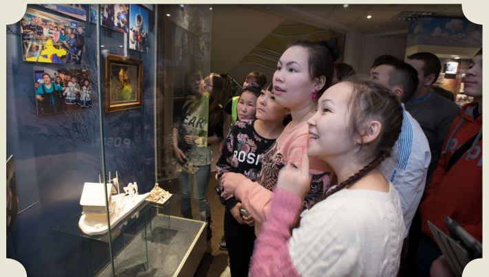
Воспитанники школы-интерната села Самбург на экскурсии

В Музее истории ООО «Газпром добыча Уренгой» быту коренных жителей Ямала посвящен отдельный экспозиционный зал, где размещены редкие фотографии, демонстрирующие кочевой образ жизни тундровиков, предметы домашнего обихода, а также экспонаты, рассказывающие посетителям о творчестве северян.