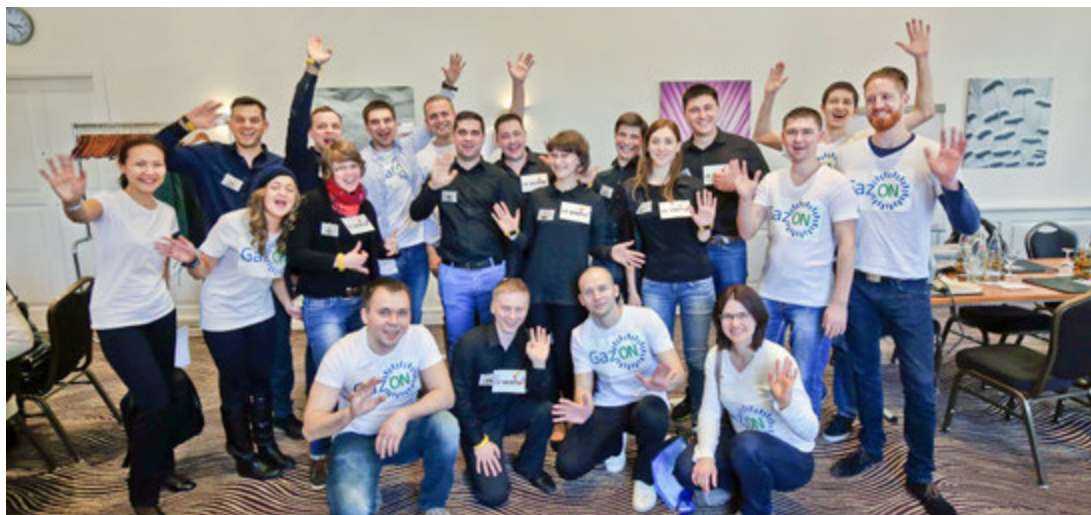
Первый день. Презентация команд и знакомство участников.

Жанна ЗАЙКОВА Подготовила к публикации Татьяна АСАБИНА