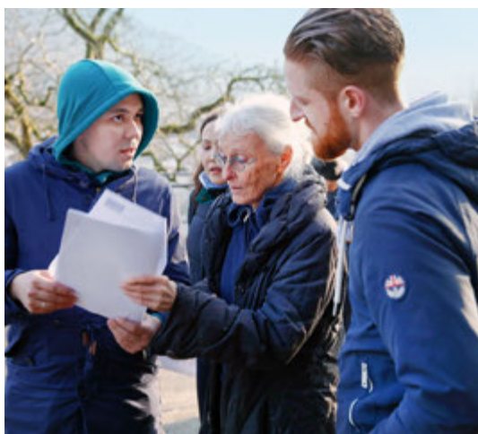
Неожиданная помощь на русском языке от местных жителей