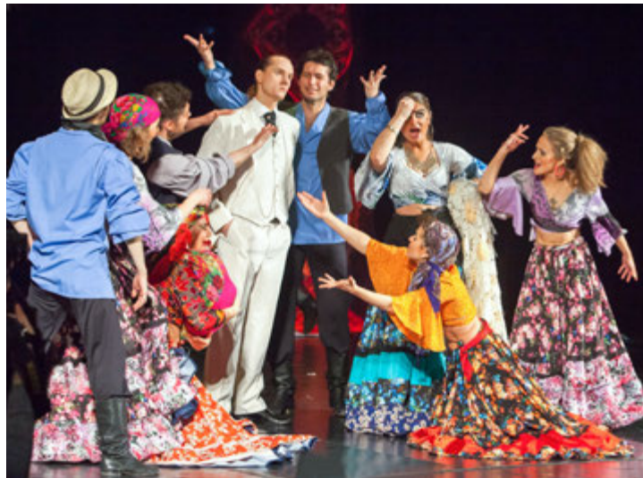
Пластический спектакль театра неслышащих актеров «Недослов»

Критики не только обсуждали спектакли, но и прочитали