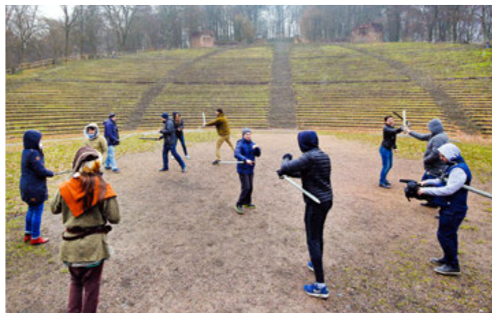
Квест «Средневековые испытания» прошел в известном историческом месте — амфитеатре, где когда-то располагался древний римский храм Меркурия