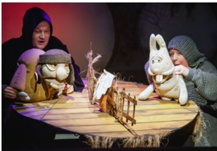
«Жил-был дед» — спектакль театра «Северная сцена»