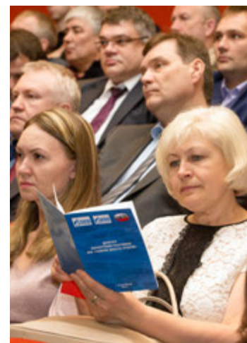
Каждый делегат обязан знать...

Проект «Экологический отряд ООО «Газпром добыча Уренгой», нацеленный на обеспечение занятости учащихся образовательных учреждений Нового Уренгоя, формирование экологической культуры у подрастающего поколения и популяризацию природоохранной деятельности нашего Обще-