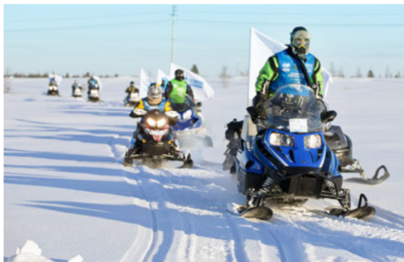
Сегодня тундра покоряется проще. Но морозы никто не отменял