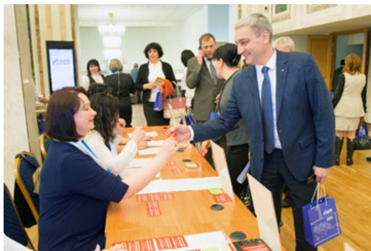
Регистрация делегатов конференции

Приоритетная задача предприятия — обеспечение высокой производительности труда при неизменной заботе о жизни и здоровье газодобытчиков. С целью выполнения обязательств, принятых Политикой ПАО «Газпром», на предприятии внедрена и успешно функционирует «Единая система управления охраной труда и промышленной безопасностью». В 2015 году в Обществе была проведена аудиторская проверка, подтвердившая соответствие