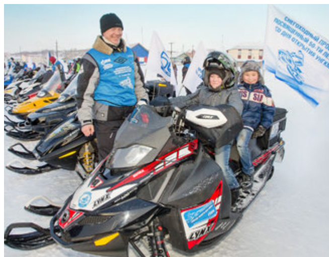
В Самбурге гостям были особенно рады