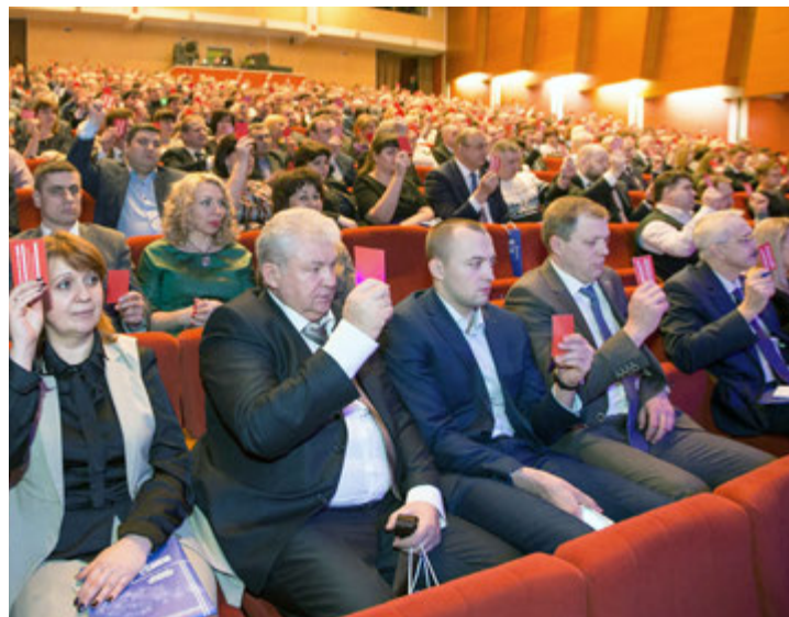
Голосование подтвердило: обязательства по Коллективному договору в 2015 году выполнены на сто процентов

Мы всегда готовы к конструктивному диалогу с вами!