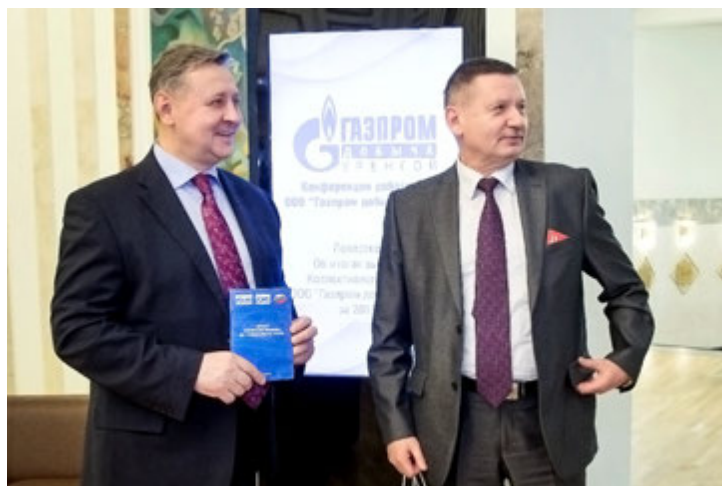
Конференция — это и общение коллег, и возможность задать различные вопросы руководству, и принятие решения об итогах выполнения Коллективного договора

Уверен, что в 2016 году очередные трудовые достижения коллектива пополнят страницы легендарной летописи ООО «Газпром добыча Уренгой» и послужат еще одним основанием для гордости за нашу работу на благо страны. Впереди нас ждут новые производственные задачи, и нет сомнений, что совместными усилиями мы успешно реализуем все намеченное!