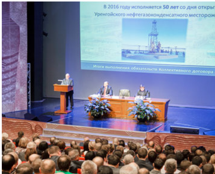
Доклад генерального директора Общества. Итоги и новые задачи

В 2016 году будут продолжены работы по реконструкции и техническому перевооружению в рамках лимитов и инвестиционной программы ПАО «Газпром». На УКПГ-22 планируется ввести в эксплуатацию три газопровода-шлейфа и необходимый комплекс оборудования трех кустовых площадок. Также в этом году мы