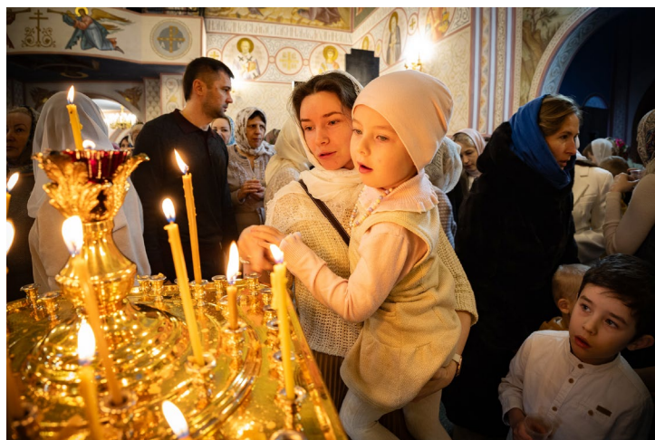
На службе – и стар, и млад