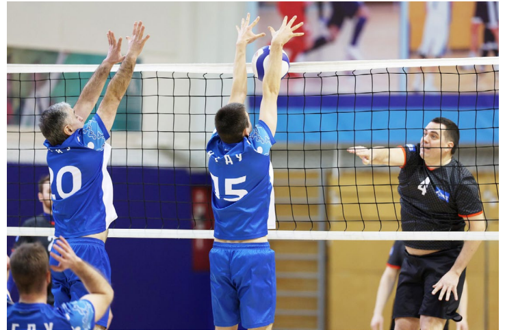
Двойной блок в действии

▪ В КСЦ «Газодобытчик» прошли соревнования по волейболу в зачет Спартакиады работников «Газпром добыча Уренгой». Оба своих матча выиграла сборная Управления технологи-