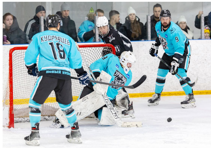
«Ураган» не только мощно атакует, но и грамотно обороняется

ческого транспорта и специальной техники. По две победы и по одному поражению – таков итог волейбольных выходных для спортсменов Управлений автоматизации и метрологического обеспечения и аварийно-восстановительных работ.