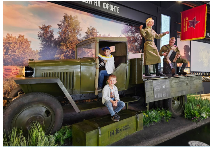
Полное погружение в атмосферу военного времени

Выставка включает более 4 000 военных тематических экспонатов 1941-1945 годов, 100 единиц оружия и 323 знамени. В галерее размещено 36 031 044 карточек участников войны.