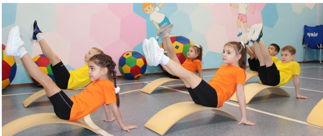
Каждое упражнение ребята выполняют очень старательно