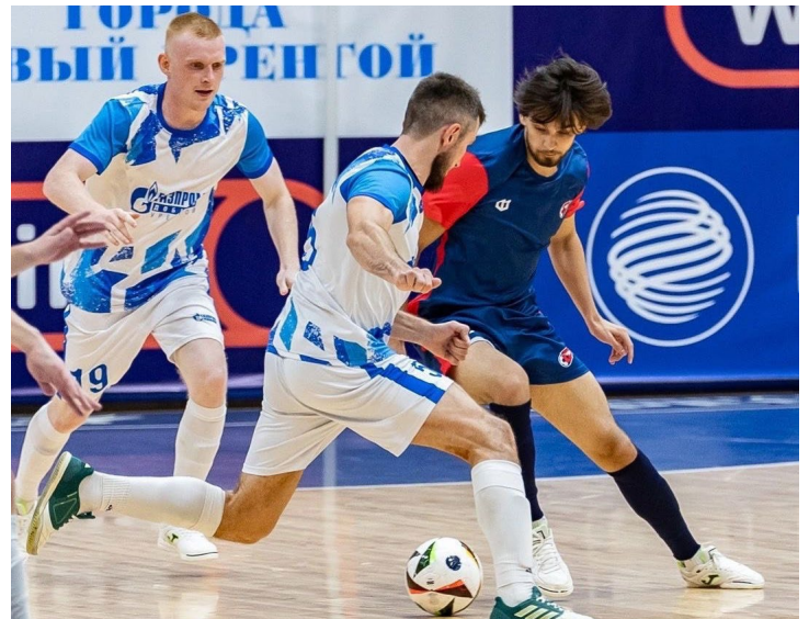
Филигранный дриблинг – основа футбола

ческого транспорта и специальной техники. По две победы и по одному поражению – таков итог волейбольных выходных для спортсменов Управлений автоматизации и метрологического обеспечения и аварийно-восстановительных работ.