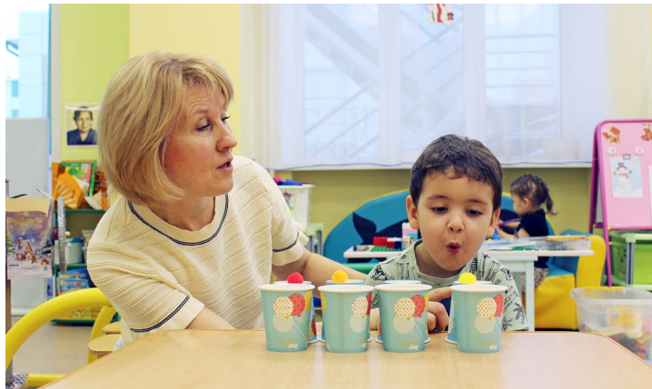
Воспитанники окружены вниманием наставников