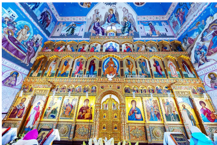
Фрески Богоявленского собора