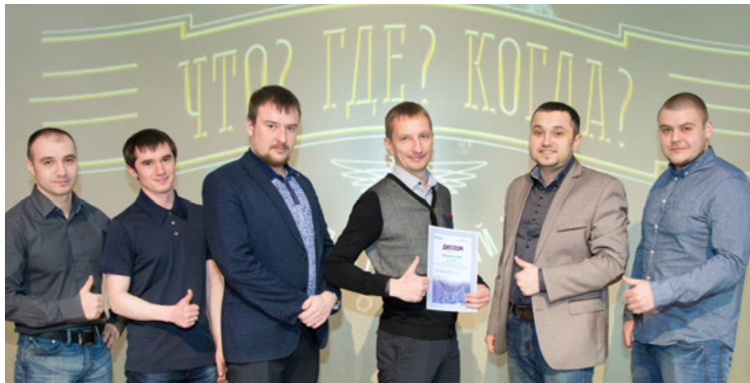
Победители игры — команда «Ценный сплав».

Форма игры — традиционная: четыре тура по десять вопросов, за правильный ответ на каждый — один балл. Чем больше баллов, тем выше шанс стать победителем данного состязания, а в перспективе — счастливым обла-