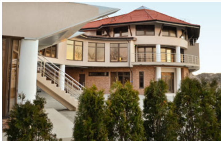
«Курортная деревня» ждет гостей.

Так что северяне, приехавшие на черноморское побережье, чтобы восстановить силы после долгой полярной зимы, наверняка не останутся разочарованными! Кроме новшеств их также ждут привычные развлечения: бильярд, боулинг, сауна, фитнес-центр, кинотеатр, библиотека, салон красоты, развлекательные программы и дискотеки, площадки для футбола, тенниса, баскетбола, волейбола и многое другое.