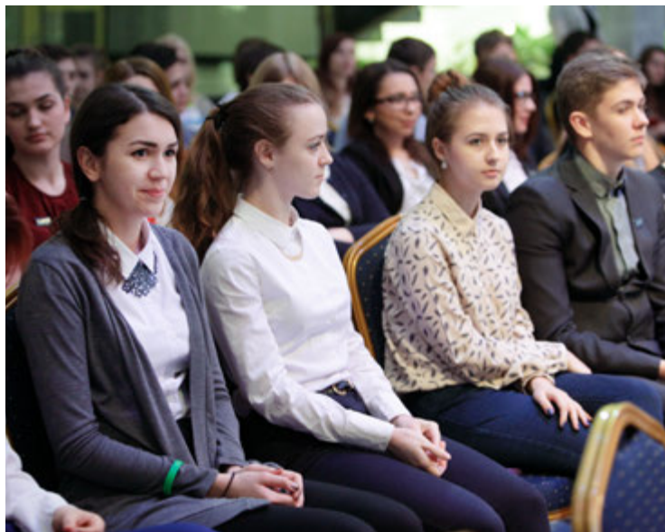
Необычный и полезный урок мужества