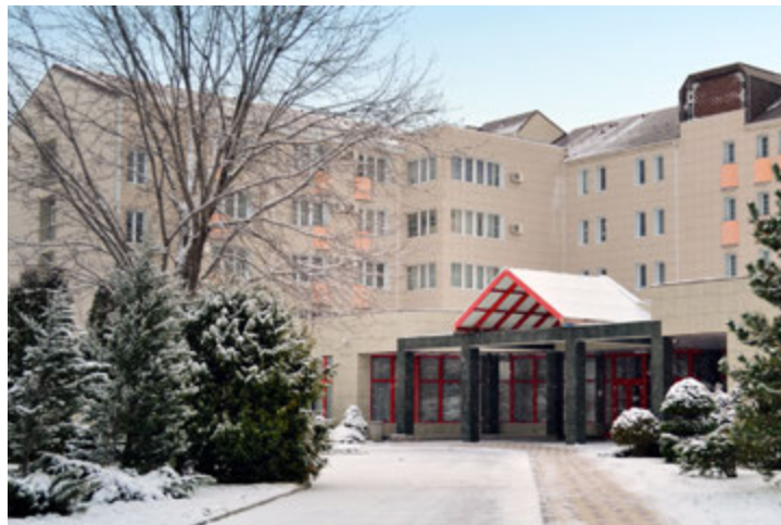
«Витязь» хорош и в зимнем убранстве