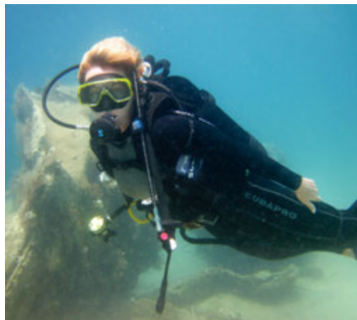
Рэп-дайвинг в Тунисе