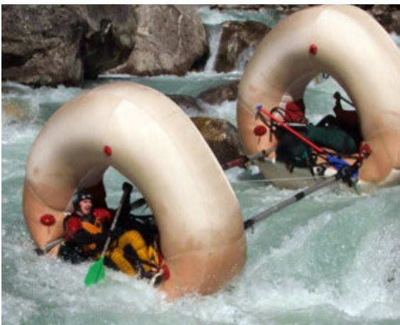
Сплав на бубликах по Дух-Коси

Ирина РЕМЕС