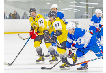
ТРЕНИРОВКИ, СТАРТЫ, ПОБЕДЫ Спортивный дайджест стр. 8