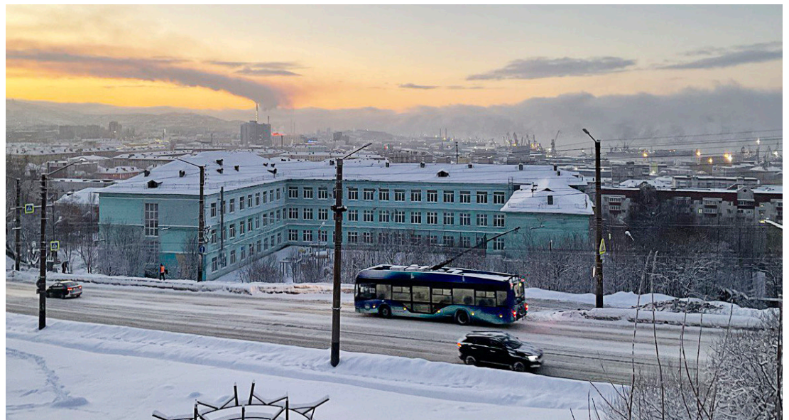
Самый северный в мире трамвай курсирует по улицам столицы Заполярья