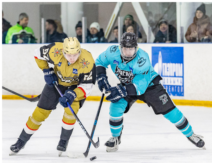
Одна шайба на двоих: «Буран» против «Урагана»

• Продолжаются матчи чемпионата по хоккею с шайбой среди команд Общества сезона 2024-2025 годов. На прошлой неделе «Полярная звезда» лишь по буллитам одолела «Импульс»