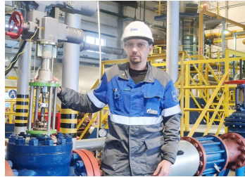
«ЧТОБЫ СПОКОЙНО И КОМФОРТНО РАБОТАТЬ» стр. 5