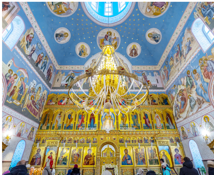
Самое заметное новшество – роспись внутренних стен