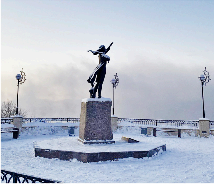
Памятник «Ждущая» встречает и провожает корабли, посещающие порт Мурманска

Именно на высоте особенно ощущается отличие местного климата от Ямала: большая влажность и пронизывающие морские ветра. Смешные для нашего региона минус двенадцать, в которые новоуренгойцы не всегда надевают шапки, заставили нас дрожать от холода и сокращать время пребывания на открытом воздухе. С Заполярьем шутки плохи!