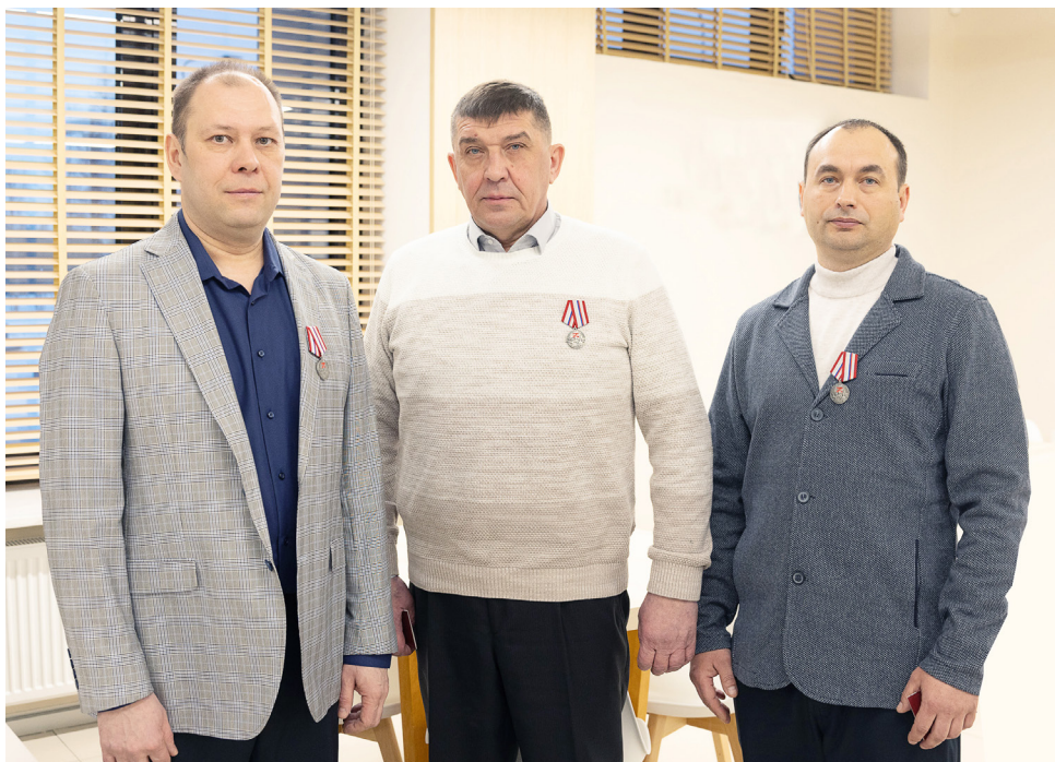
Победа во многом зависит от того, кто стоит за бойцами в тылу. Помощь каждого неравнодушного человека имеет значение.

действует сотрудникам, занимающимся волонтерством. Всех, кто работают в Обществе и параллельно помогают людям на безвозмездной основе, объединяет добровольческое движение «Месторождение ДОБРА». Корпоративные традиции также включают в