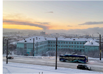
ПУТЕШЕСТВИЕ НА РУССКИЙ СЕВЕР стр. 6-7