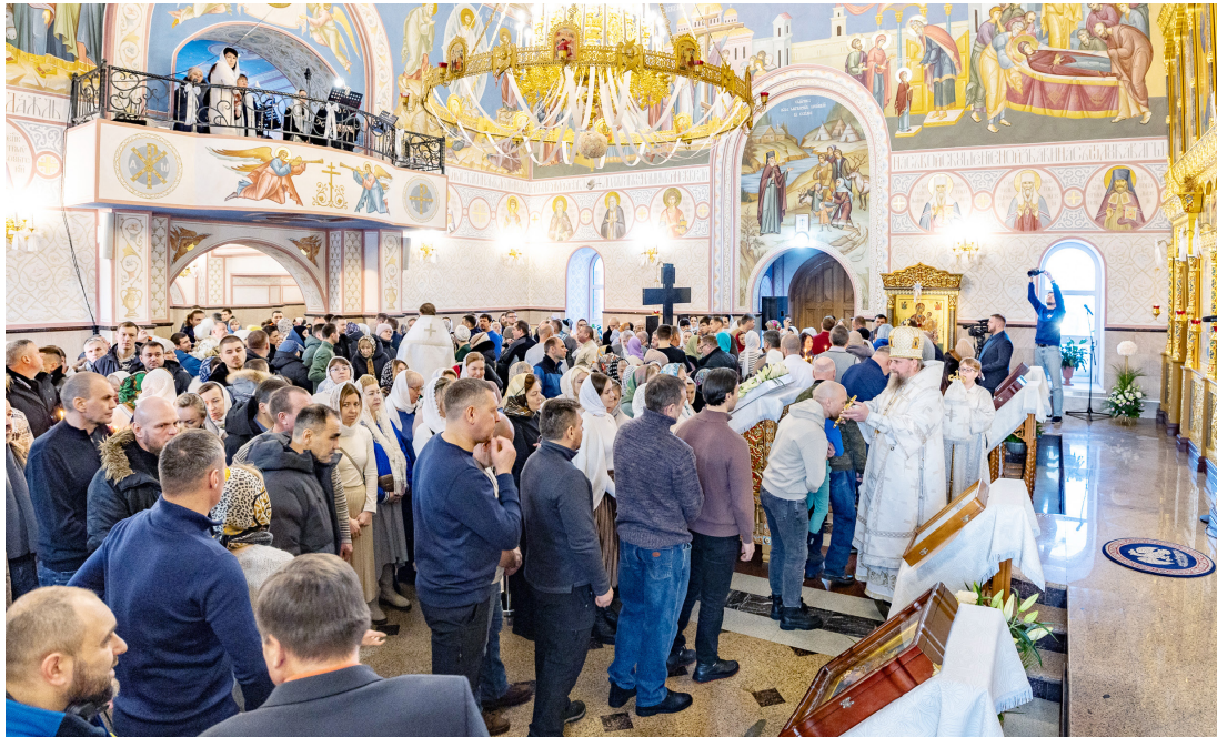
На праздничной службе было многолюдно