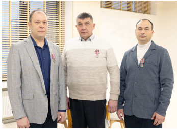
МЫ ВАМИ ГОРДИМСЯ! Признание стр. 3