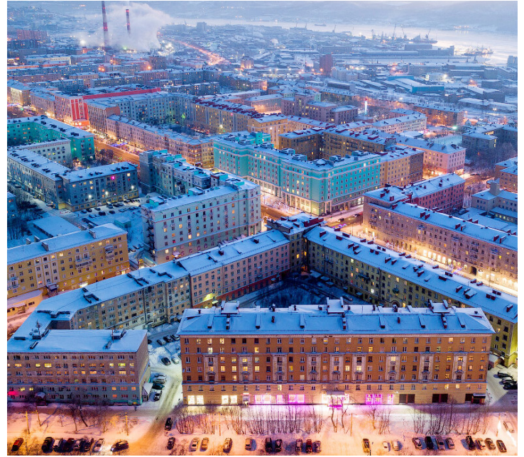
Яркая уличная иллюминация делает полярную ночь светлее

Целью нашей поездки являлось участие сборной «Газпром добыча Уренгой» в Интеллектуальном кубке Мурманской области. Двухдневная игра проходила в восемнадцатизэтажном отеле «Азимут», который также входит в число визитных карточек города как самое высокое в мире общественное здание за полярным кругом. Первый четырехэтажный корпус гостиницы, которая раньше называлась «Арктика», построили еще в 1933 году. Согласно плану «Барбаросса», Гитлер рассчитывал взять Мурманск за несколько дней и даже назначил на начало июля 1941 года банкет в «Арктике» по случаю покорения Со-