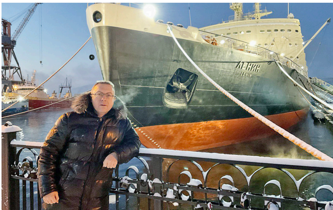
Атомный ледокол «Ленин» — музей на воде

Нам, новоуренгойцам, привычен короткий световой день продолжительностью около двух часов в конце декабря. Однако для мурманчан дефицит солнечных лучей актуален в еще большей степени, ведь в разгар полярной ночи небесное светило несколько дней вообще не выглядывает из-за горизонта. Поэтому в зимние месяцы большое значение приобретают уличная подсветка и иллюминация, и с этим в столице Арктики все в порядке. Разноцветные гирлянды вдоль проспектов, подсвеченные дома, сияющие инсталляции всевозможных форм и размеров, переливающиеся огнями детские городки... А вишенка на торте – 65-метровый градусник на трубе Мурманской ТЭЦ, созданный из нескольких десятков огромных светильников. Реальную температуру воздуха с его помощью можно увидеть за три километра.