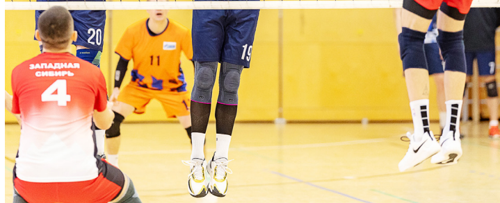
Извечное волейбольное противостояние атаки и блока

– 1:0. Следующие матчи оказались куда более результативными: «Ураган» и «Титан» забросили в ворота соперников по девять шайб. Транспортники победили нефтяников из «Бурана» – 9:4, команда УГПУ уверенно разоблась с «Гладиатором» с результатом 9:2.