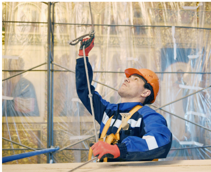
Ремонт в храме продолжался более двух лет