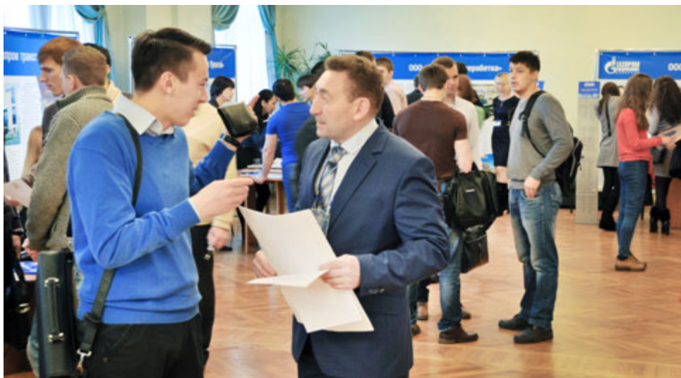
Ярмарка вакансий вызывает обоюдный интерес у работодателей и студентов