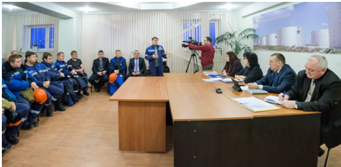
На встрече с трудовым коллективом в Управлении по транспортировке нефтепродуктов и ингибиторов

— Разъясните, пожалуйста, ситуацию с увеличением возраста выхода на пенсию.