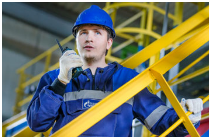
Главное на производстве — люди

— Молодым специалистам предоставляют ведомственное жи-