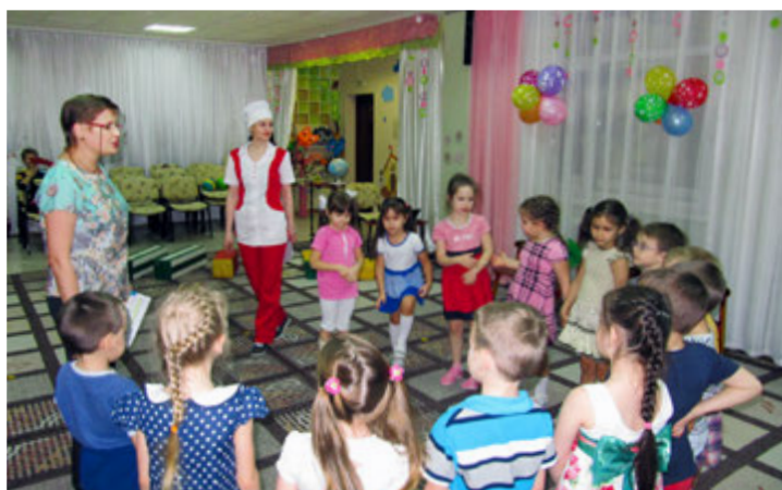
Путешествуем с доктором Неболитом

В рамках проекта для детей старшей группы детского сада «Снежинка» прошло развлекательное мероприятие «В поис-