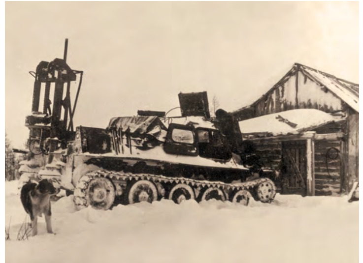
В фондах Музея истории Общества хранится немало архивных снимков, иллюстрирующих быт первопроходцев