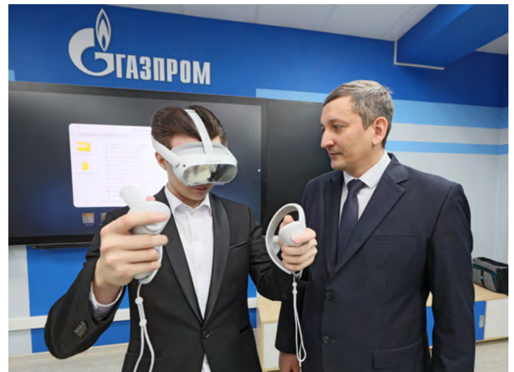
Образование идет в ногу со временем