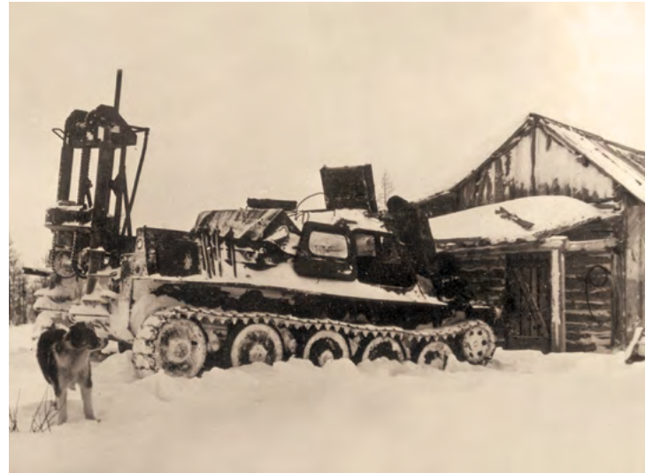
В фондах Музея истории Общества хранится немало архивных снимков, иллюстрирующих быт первопроходцев