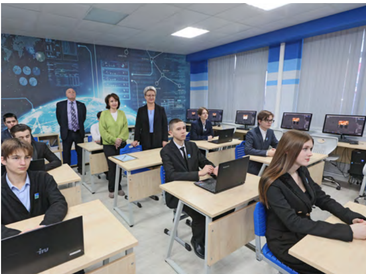
В таком классе хочется учиться!