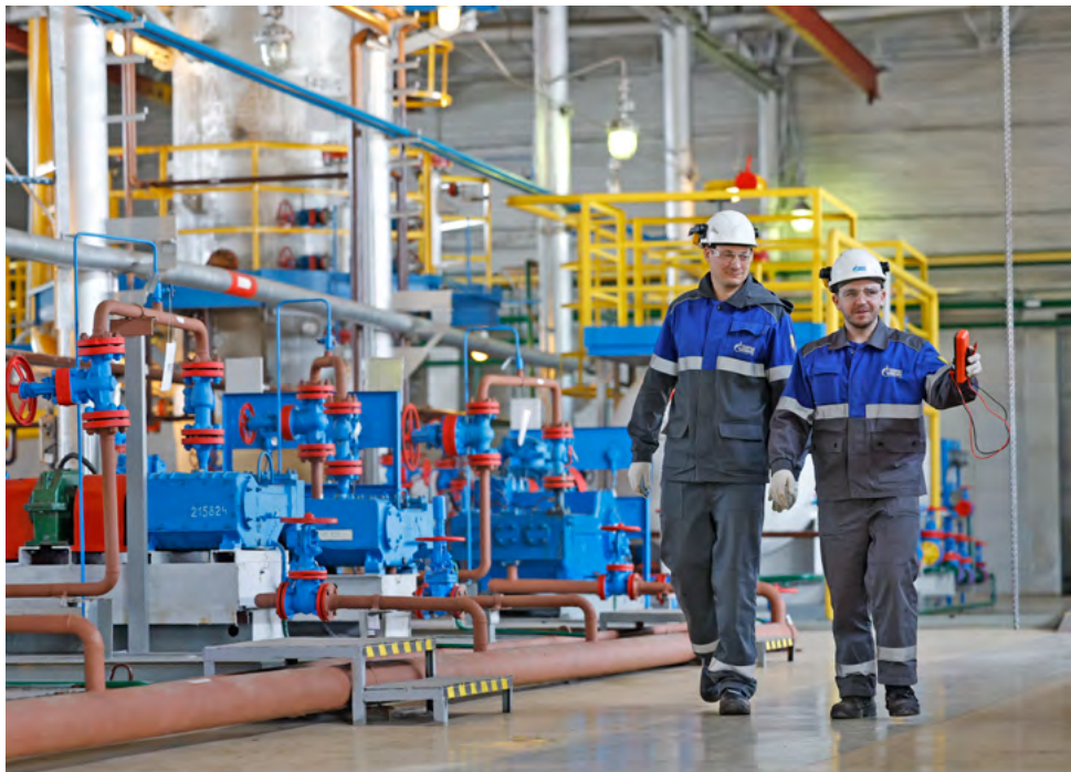
На газовом промысле № 1.

Итогом проверки стала положительная оценка результативности функционирования