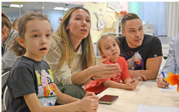
«Мы точно знаем ответ на этот вопрос»

Проект «Детство и писатели» в «Княженике» реализуется давно. Каждый месяц воспитатели размещают в группе портрет писателя и знакомят ребят с его творчеством и основными этапами жизни. Чтобы привлечь к литературе и родителей, в коридорах детского сада педагоги организовали специальные уголки «Бери, читай, возвращай». Задумка работает так: мамы и папы выбирают книгу, читают ее вечером дома в спокойной обстановке или перед сном совместно с ребенком и возвращают обратно на полку. Унести книжку-малышку удобного формата можно