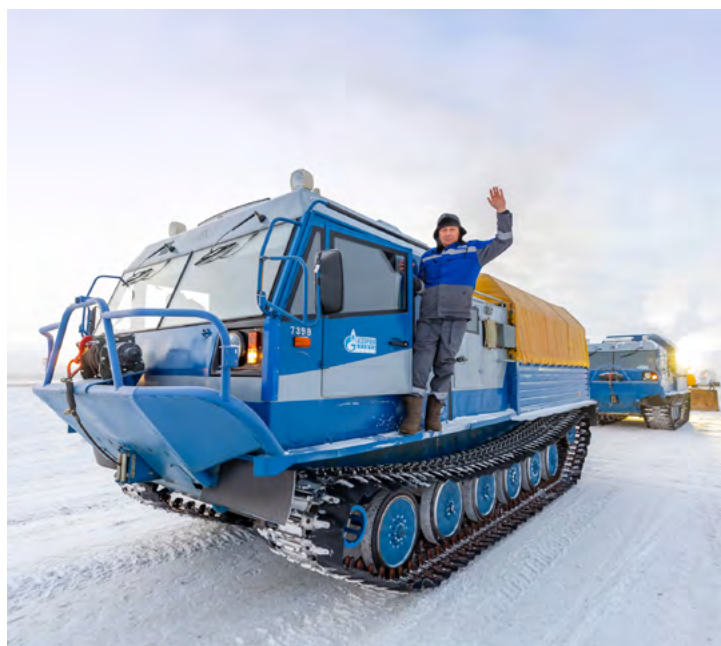
Повторить путь десанта на Уренгой

Проектировщики предусмотрели возведение котельной из четырех котлов ПКН-2С, организацию водоснабжения из пяти артезианских скважин, канализации и энергоснабжения на дизельном топливе. При этом котельную предполагалось снабжать газом из скважины № 3. Позаботились и о питании жителей поселка –