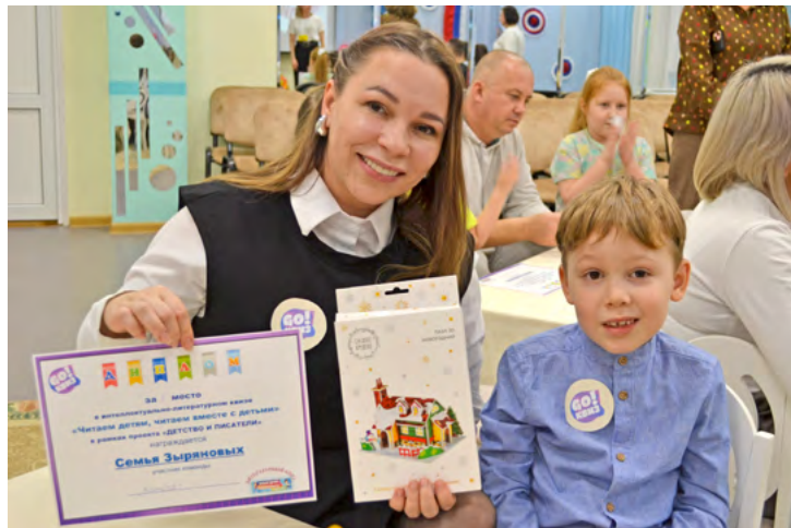
Награды участникам квиза

«Чтение – вот лучшее учение!» – сказал великий Александр Пушкин. Но как привить любовь к чтению современному человеку, привыкшему к электронным гаджетам и социальным сетям? Уговорами и беседами это не всегда удается. В детском саду «Княженика» нашли эффективный способ – для семей воспитанников провели литературный квиз.