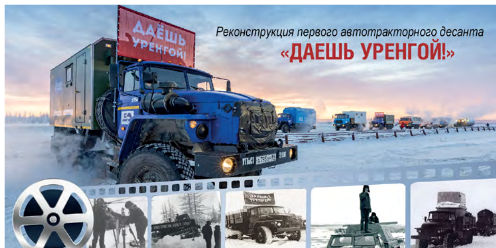
Реконструкция первого автотракторного десанта «ДАЕШЬ УРЕНГОЙ!»

В Санкт-Петербурге состоялось награждение лидеров XV конкурса служб по связям с общественностью и СМИ дочерних обществ и организаций ПАО «Газпром». Проект «Даешь Уренгой!» Общества «Газпром добыча Уренгой» отмечен дипломом первой степени в номинации «Лучший музейный проект 2023». Во время торжественной церемонии победителей поздравил Председатель Правления ПАО «Газпром» Алексей МИЛЛЕР.