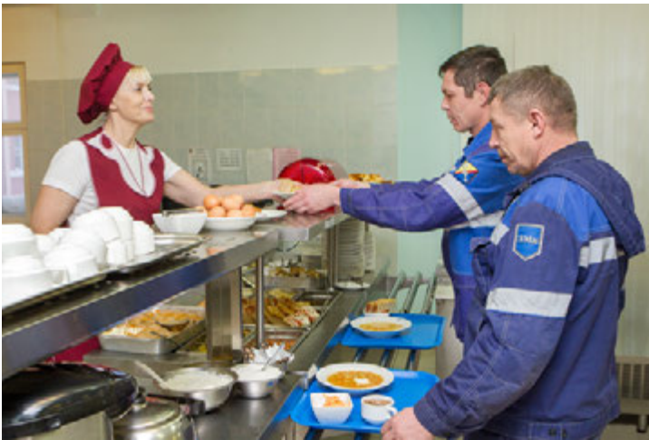
В столовой «Уренгойгазторга» № 18 кормят вкусно и сытно. Проверено!