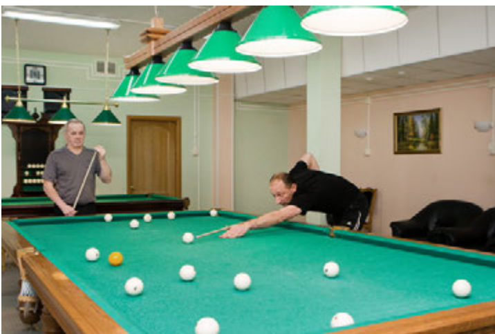
... в бильярдной...