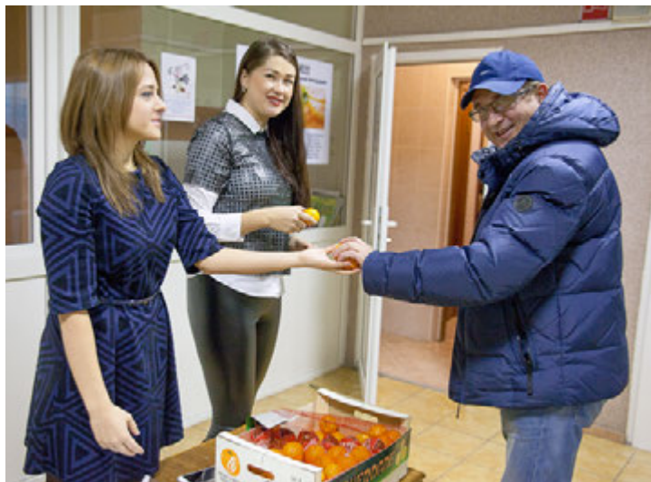
На прошлой неделе в службе по связям с общественностью и СМИ Общества меняли сигареты на полезные мандарины

Информационно-аналитическое управление администрации города