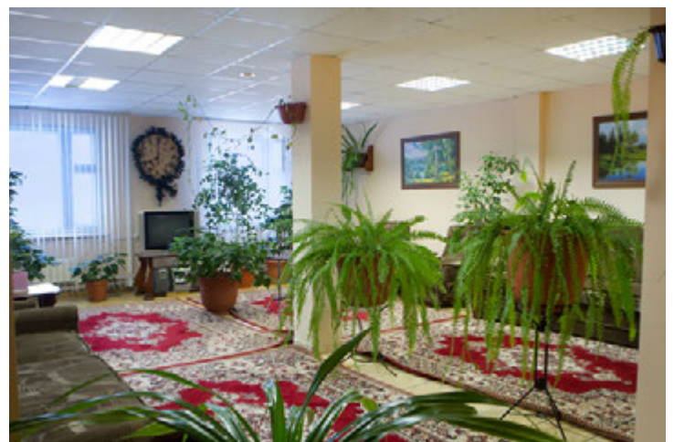
... или даже в уютном холле с книгой в руках