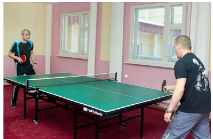
Свободное время можно провести за теннисным столом...