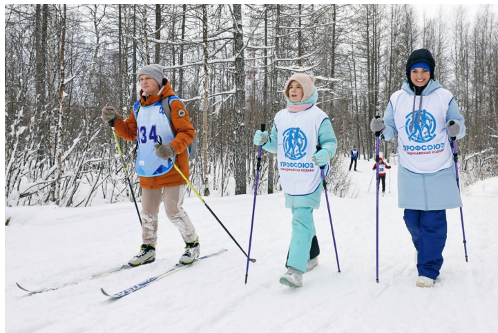
Мы за любой вид зимней активности, главное – в удовольствие