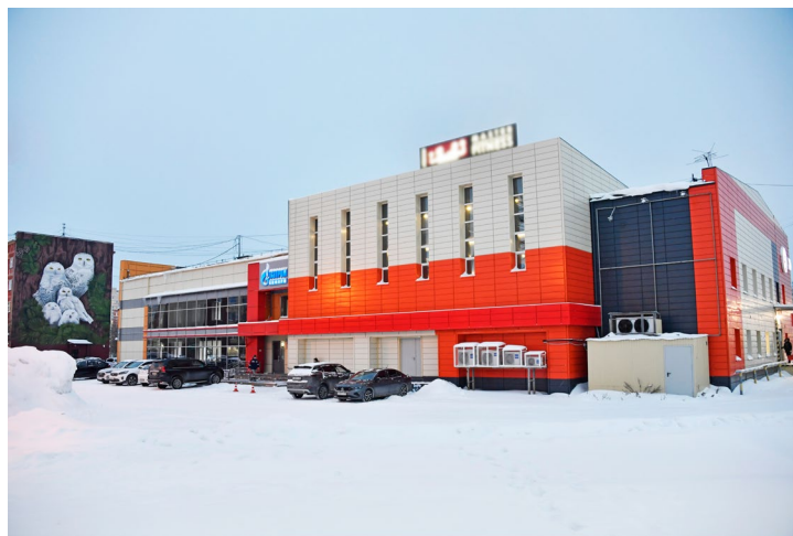
...и 40 лет спустя