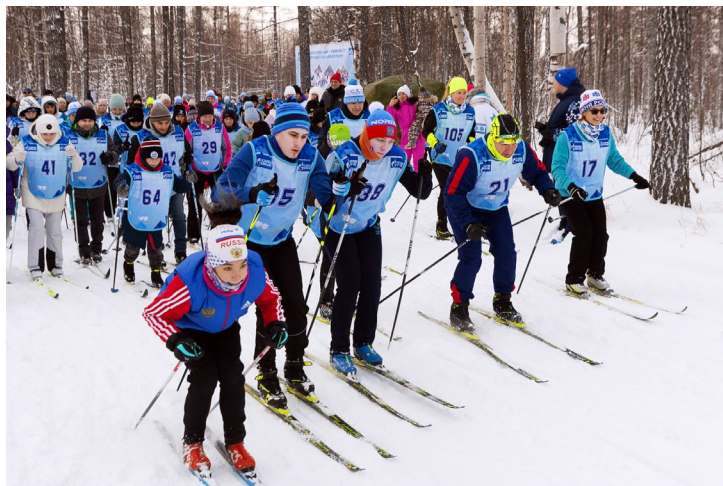
Вперед, лыжники, большие и маленькие!