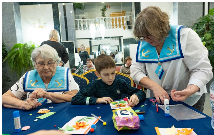
Надо, чтобы гостям было интересно...