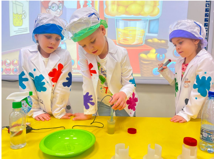
Опыты – главное в познании мира

Главная задача лаборатории – познакомить маленького испытателя с добрым, почти одушевленным прибором – цифровым датчиком, сделанным в виде божьей коровки, который умеет реагировать на окружающий мир, на изменения температуры, звуки, электричество. Поэтому с ним так интересно экспериментировать и проводить самые разные опыты! Цифровая лаборатория «Наураша в стране Наурандии» приоткрывает для детей дверь в увлекательный мир наук – физики, химии, биологии. А еще создает целостную картину мира и расширяет