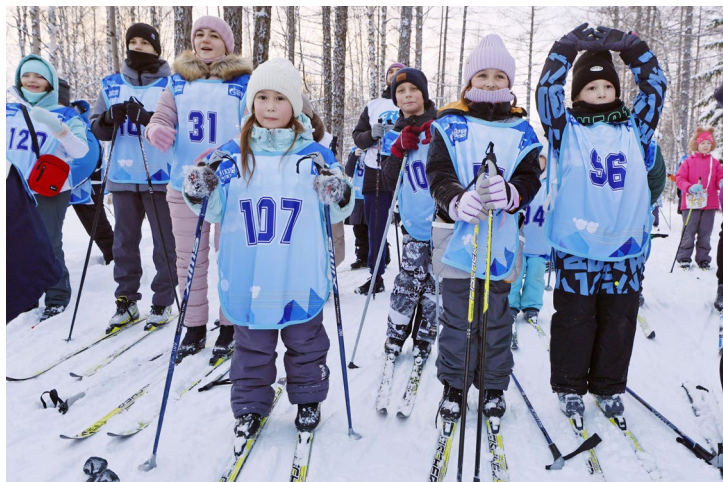
Обязательный элемент программы – разминка