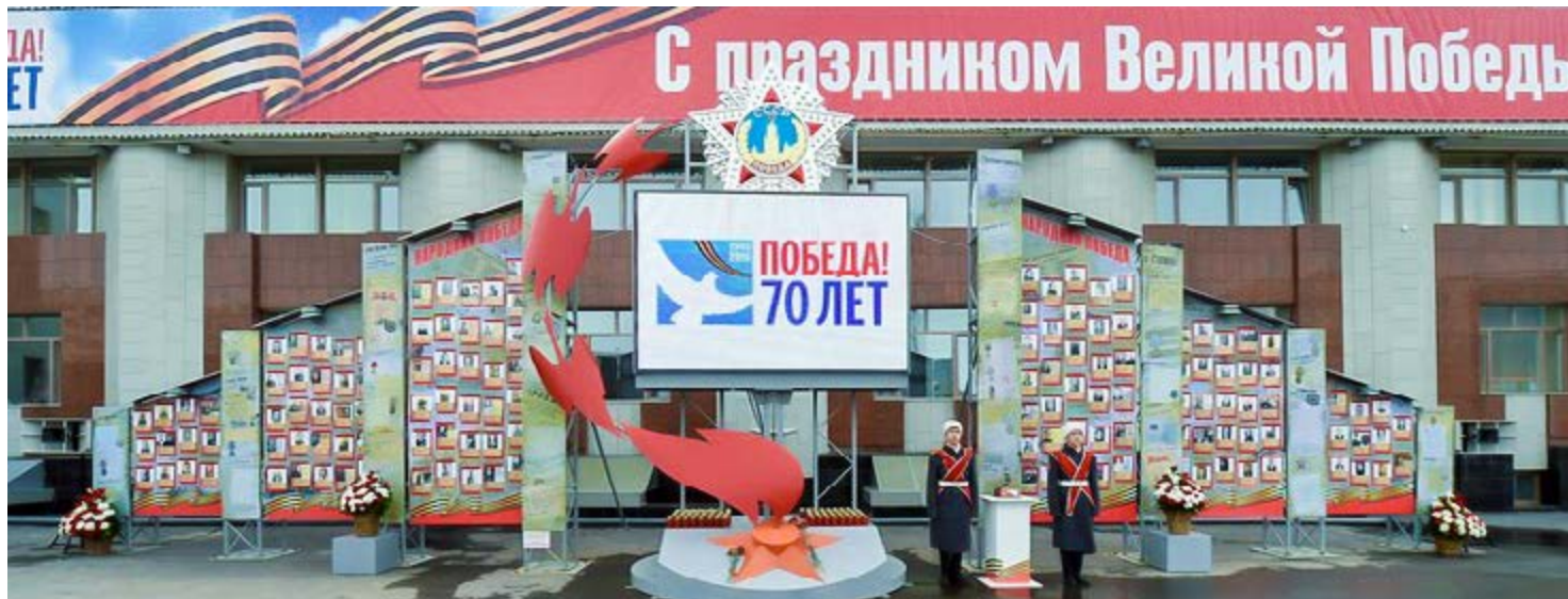
На стенде «Народная Победа» — фотографии родственников новоуренгойцев, участвовавших в боевых сражениях