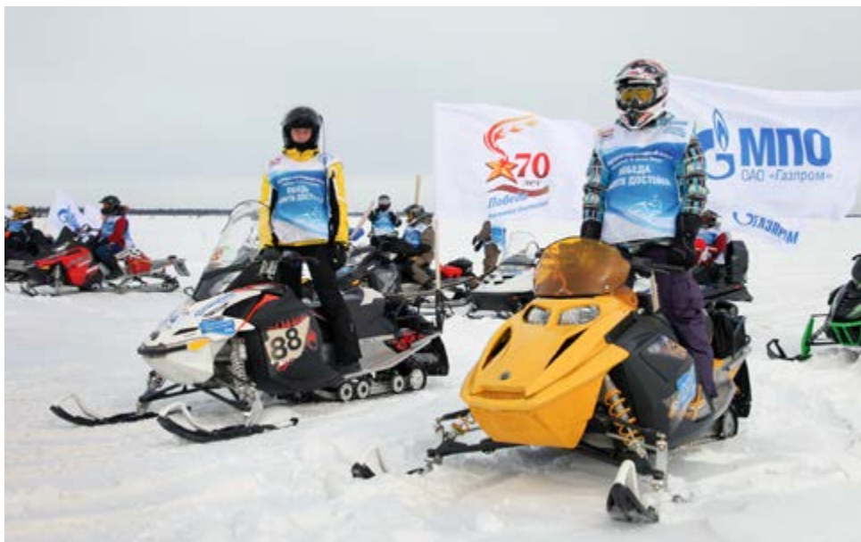
Патриотический снегоходный пробег — дань памяти подвигу сороковых годов

— Множество акций в рамках юбилейной годовщины Победы — наша дань памяти миллионам погибших в сражениях за нашу Родину. Такой патриотический проект объединил тысячи людей. Это имеет большую ценность для связи поколений и сохранения исторической правды о Великой Отечественной войне. Как человек, принявший непосредственное участие в мотопробегах, хочу отметить, что путь был не легкий. Меня ни на секунду не оставляло ощущение тех невероятных трудностей, которые выпали на долю защитников Отечества в те далекие годы. От имени руководства Общества и всего нашего коллектива мы передали капсулу с ново-