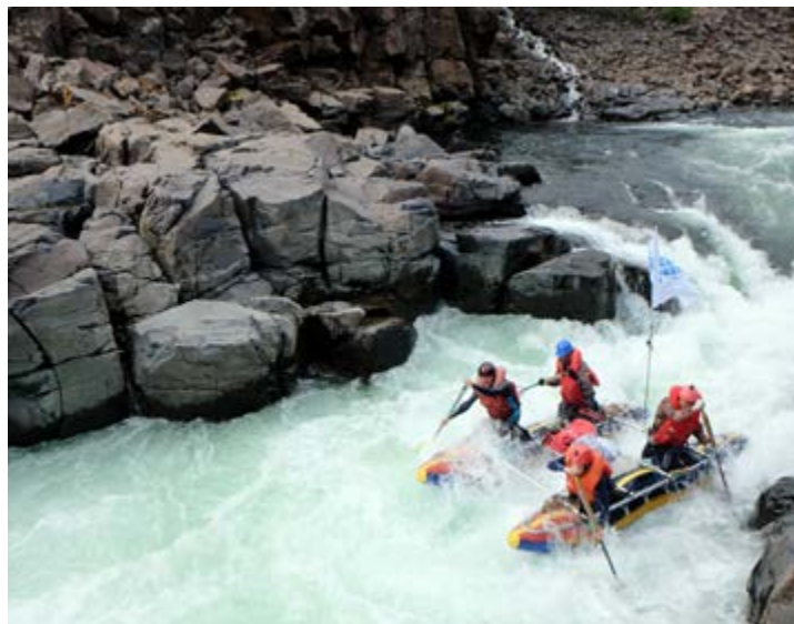
Прохождение порога на реке Дулисмар