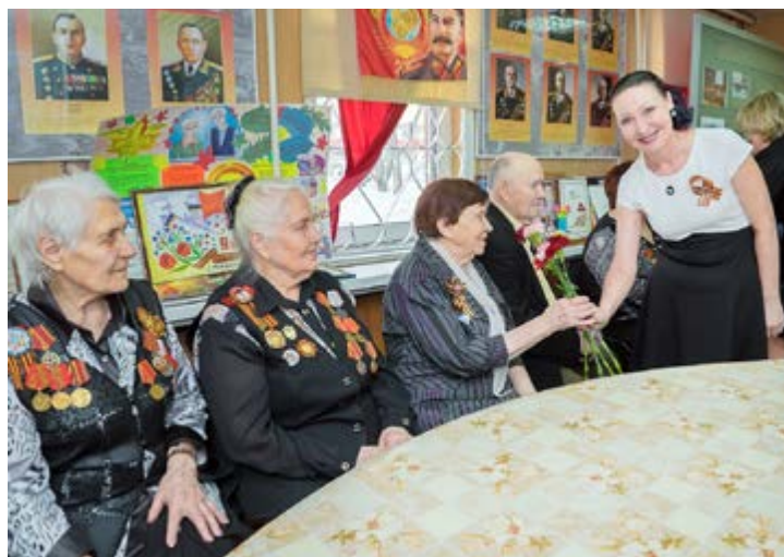
Общество «Газпром добыча Уренгой» поздравляет ветеранов с праздником