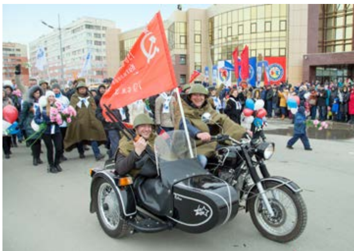
Газодобытчики на параде в честь 70-летия Великой Победы

Центральным событием этого года стал, конечно, сам праздник — 9 мая. Накануне 70-летия Победы специалисты КСЦ «Газодобытчик» Общества организовали на главной площади танцевальную вечеринку в духе судьбоносного майского дня 1945 года. В победном вальсе кружились молодежь, профессиональные танцоры и ветераны. А за улыбчивыми парами «наблю-