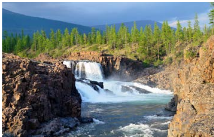
Достойная альтернатива городским каменным джунглям