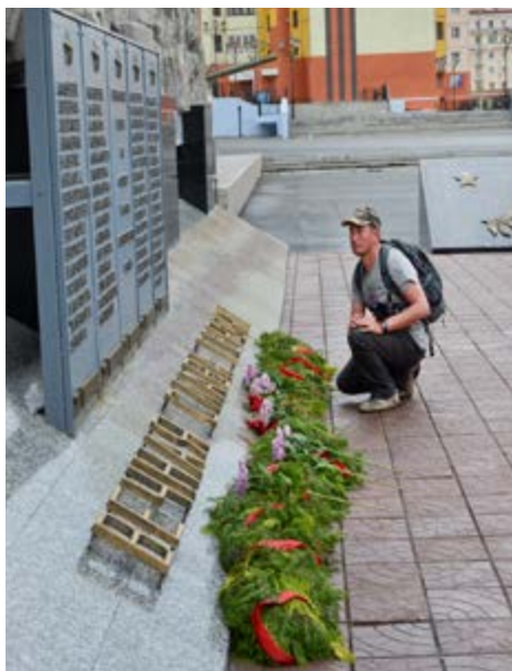
Норильск. Возложение цветов

— Просто повезло, что оказался в нужном месте и успел правильно среагировать. А вот мне запомнилась встреча с медведем, с которым мы совершенно неожиданно пересеклись в устье реки Наледной. Проплывали недалеко от берега, услышали шум в кустах и вскоре обнаружили косолапого, который ел ягоды. Хорошо, что зверь был увлечен этим процессом, потому что если бы он заинтересовался