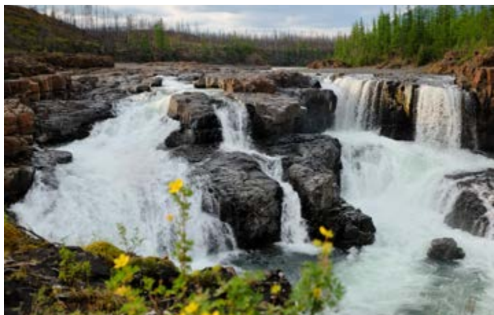
Водопад на слиянии рек Дулисмар и Яктали

Александр БЕЛОУСОВ