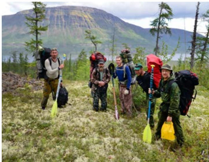
Возле реки Наледной. Пеший переход

А вот восхитительных пейзажей во время похода было предостаточно. Причем местность не похожа на ту, что мы видели