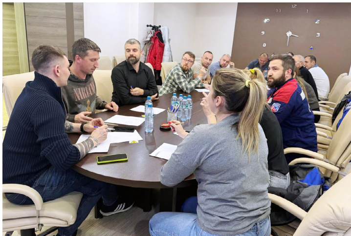
Участники первого этапа «Своей игры» – персонал базы горюче-смазочных материалов. Новый формат закрепления знаний пришелся по душе всему коллективу филиала

Исполнение локальных нормативных документов и целевой инструктаж перед проведением работ повышенной опасности – обязательное условие. Это ре-