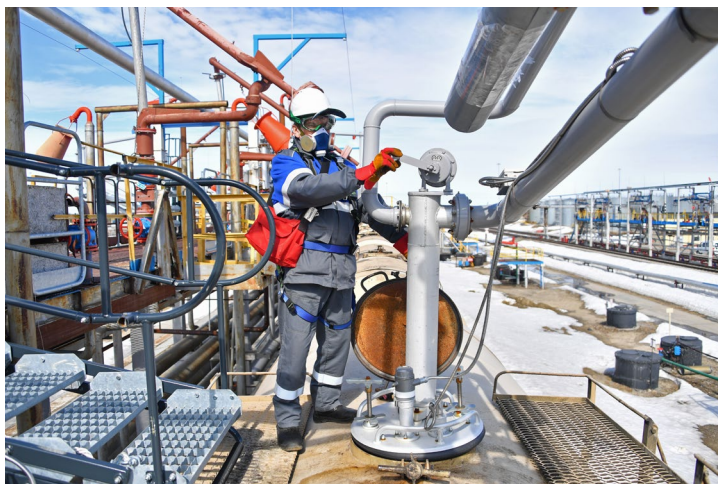
Соблюдение требований производственной безопасности обязательно при проведении всех работ, в том числе сливо-наливных операций

изошел излом резьбового штока, повлекший разлив нефтепродукта. Бензин попал на спецодежду и в глаза находящегося в месте происшествия работника. Назначенные медиками капли помогли убрать жжение в глазах, и сливщик-разливщик продолжил работу. После происшествия в филиале разработали и выполнили мероприятия по недопущению подобных случаев.