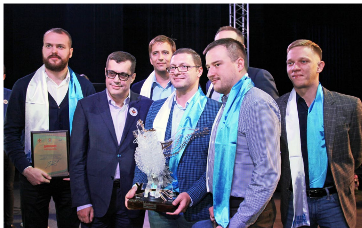
2018 год. «Борцы с умом» получают Кубок главы Ноябрьска «Битва интеллектов» из рук магистра игры «Что? Где? Когда?» Максима Поташева

Профсоюзная организация помогла нам в приобретении кнопочного оборудования, и мы пошли