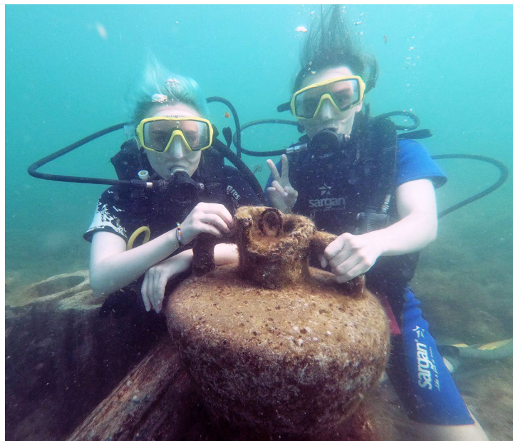
Анна и Михаил изучают глубины Черного моря

Александр БЕЛОУСОВ