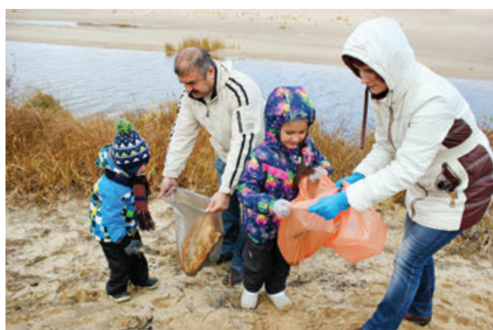
Спасли реку от мусора.

Мало кто знает, что для разложения стеклянной бутылки нужен один миллион лет, для полиэтиленового пакета — от 500 до 1000 лет, окурка сигареты — от года до пяти; огрызок яблока гниет до двух месяцев. Озадаченные этой проблемой, воспитатели группы «Брусничка» дет-