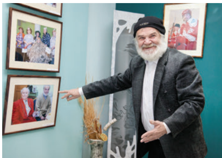
Герои выставки с радостью находят себя на фотографиях

Сергей ЗЯБРИН