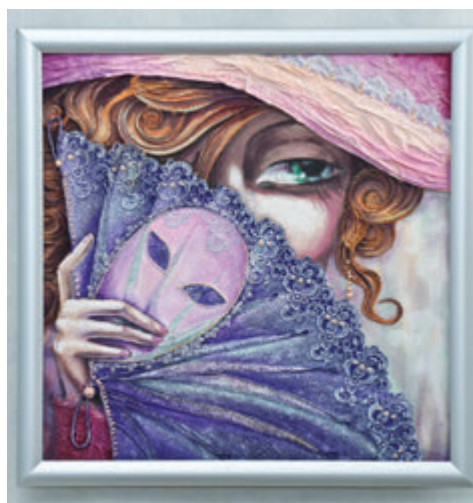
Misterio («тайна», «загадка»)