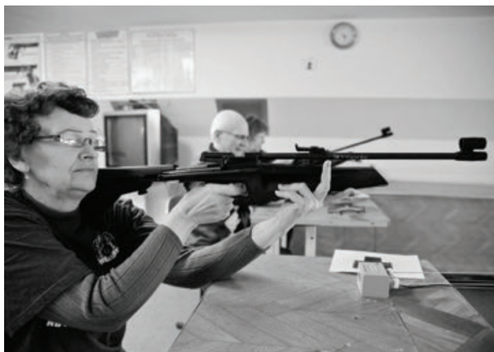
«Скрипачка» — одна из любимых работ фотохудожника

«Любопытство», «Жизнь удалась», «Печальная радость»... — трогательные и серьезные, смешные и веселые фотоработы не оставляют зрителей равнодушными. Живое обсуждение и буря эмоций — лучшие награды для автора. Есть в показанной коллекции и особенные, любимые Элиной портреты. Одна из таких — «Скрипачка». О музыке речи здесь не идет — в руках у женщины в кадре — винтовка, в