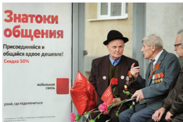
«Случайная встреча». Автору удалось запечатлеть умение пожилых людей находить общий язык