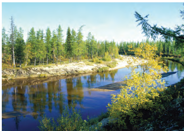
Северное лето.

Учредитель — ООО «Газпром добыча Уренгой». Издатель — ООО «Газпром добыча Уренгой». 629307, ЯНАО, г. Новый Уренгой, ул. Железнодорожная, 8. И.о. ответственного редактора Е.Г. Моисеева. Газета «Газ Уренгой» зарегистрирована в Уральском региональном управлении регистрации и контроля за соблюдением законодательства РФ о средствах массовой информации. Свидетельство № ПИ № ФС 7209293.