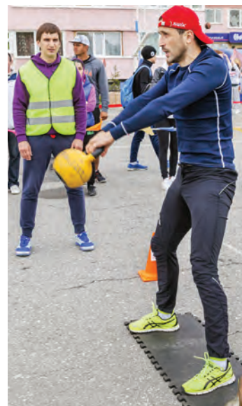
«...подкидывают гири, как детские мячи...»

— Современный вид фитнеса привлекает все больше энергичных, заботящихся о своем здоровье людей разного возраста, среди которых немало и представителей нашего Совета. Постоянно меняющиеся функциональные упражнения высокой интенсивности не позволяют скучать во время тренировки и дают положительный результат — организм становится сильнее и закаленнее. А это именно то, что нужно в наших