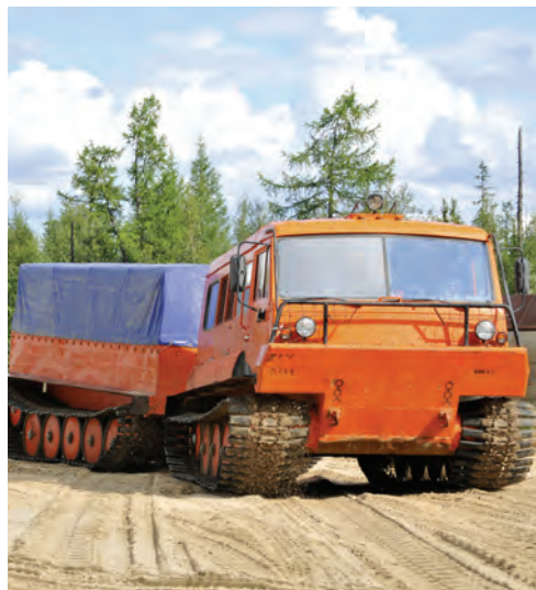
Мощная техника — надежный помощник линейщиков во время летних работ