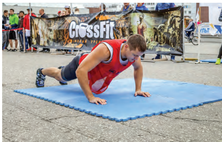
Отжиматься тоже нужно правильно!

вость, силу, гибкость, скорость и координацию, но и большое число болельщиков. Десять команд по три человека под руководством опытного тренера городского фитнес-клуба должны