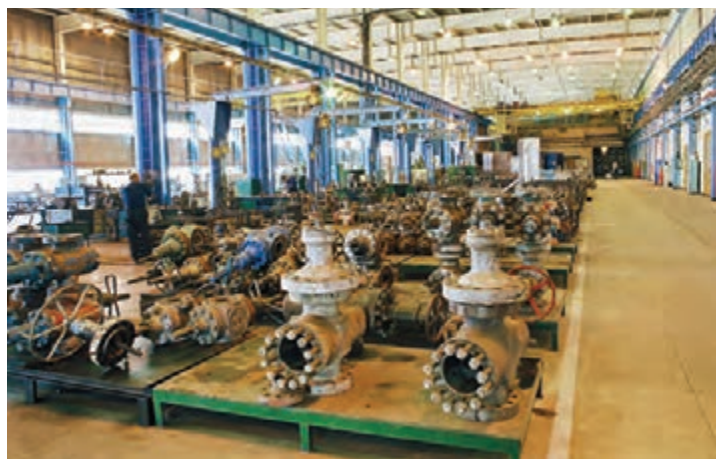
Ремонт запорно-регулирующей и фонтанной арматуры в цехе по ремонту и наладке технологического оборудования