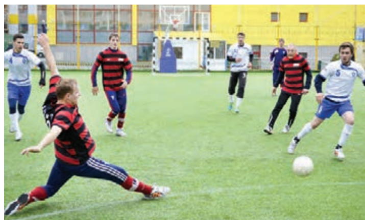
Во-о-от так мы любим футбол!

Александр БЕЛОУСОВ