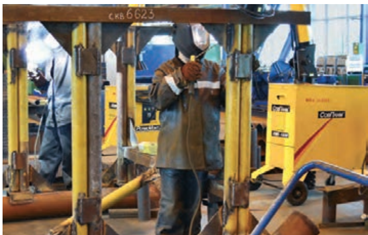
В сварочном цехе идет капитальный ремонт площадки обслуживания фонтанной арматуры