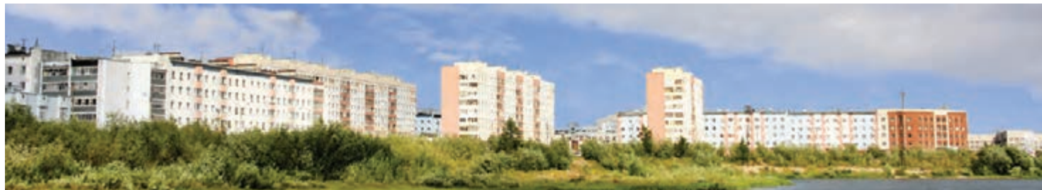
Город сильных людей, город энтузиастов и оптимистов, город умельцев и профессионалов... Наш Новый Уренгой!

— Начальный руководящий опыт мне удалось получить еще в Центральной городской больнице на должности заведующего операционным блоком. Решение о смене рода деятельности далось непросто. Но осознав, что в новом качестве смогу продолжать помогать людям, только в более глобальных масштабах, принял, как я считаю, правильное решение и продолжил свою медицинскую трудовую деятельность в ООО «Газпром добыча Уренгой». Сначала в должности заместителя главного врача