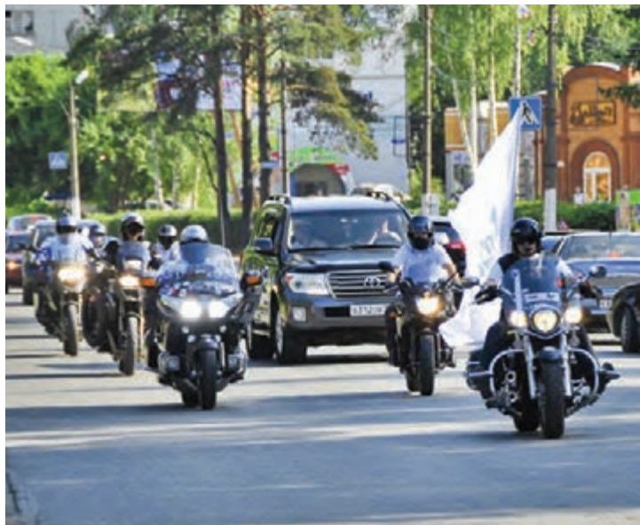
Дорогами России с Победой в сердцах...