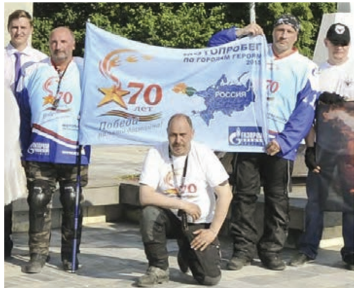
Памятное фото у мемориала в городе Чайковском

По городам и весям России продолжается мотопробег «Навстречу Великой Победе. По местам великих сражений», организованный при поддержке руководства Общества «Газпром добыча Уренгой» и Первичной профсоюзной организации.