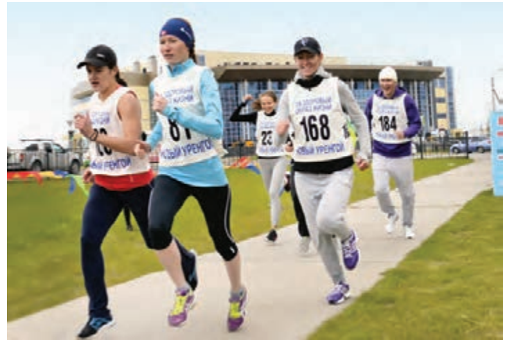
Бегом за здоровьем!

При этом у Общества есть свой «конек» — Кубок «Газпрома» по мини-футболу среди ветеранов. В нынешнем году это соревнование проводилось в 18 раз, и все победы в нем одержала сборная нашего предприятия. Не удивительно, что она является костяком сборной Группы «Газпром», принимающей участие в Международном турнире среди футбольных клубов парламентов и правительств стран СНГ. В 2015 году 13 по счету турнир состоялся в Сочи, и очередную