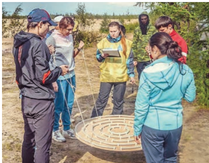
Так формируется команда