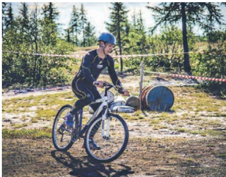
Велогонки — один из этапов соревнования