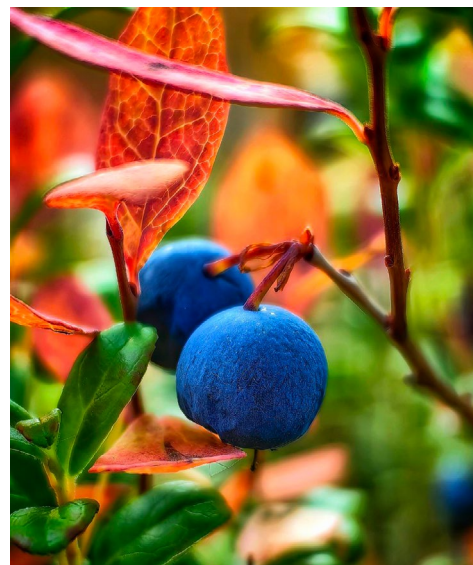
Вкусные дары ямальской тундры

Учредитель – ООО «Газпром добыча Уренгой». Издатель – ООО «Газпром добыча Уренгой». 629307, ЯНАО, г. Новый Уренгой, ул. Железнодорожная, 8. Главный редактор Т.Р. Асабина. Газета «Газ Уренгой» зарегистрирована в Управлении Федеральной службы по надзору в сфере массовых коммуникаций, связи и охраны культурного наследия по Тюменской области и ЯНАО. Свидетельство ПИ № ФС72-0929Р от 28.04.2008 г. Адрес редакции: 629300, г. Новый Уренгой, пр. Ленинградский, 3А, служба по связям с общественностью и СМИ ООО «Газпром добыча Уренгой». E-mail: gazeta@gd-urengoy.gazprom.ru. Газ. связь: 99-67-38, 99-67-39, 99-67-57. Газета подписана в печать фактически в 10.00. По графику – в 10.00. Заказ № 36. Тираж 500 экз. Усл. печ. листов 1,2. Гарнитура «Times New». Распространяется бесплатно (12+). Дизайн, верстка, печать: ССО и СМИ ООО «Газпром добыча Уренгой». Электронная версия газеты на сайте www.urengoy-dobycha.gazprom.ru