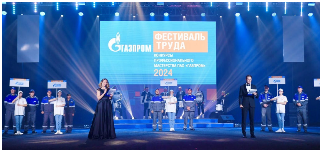
Церемония открытия Фестиваля труда в городе Томске