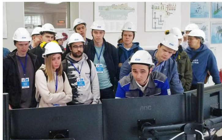
Экскурсия на производственный объект Общества «Газпром трансгаз Уфа»