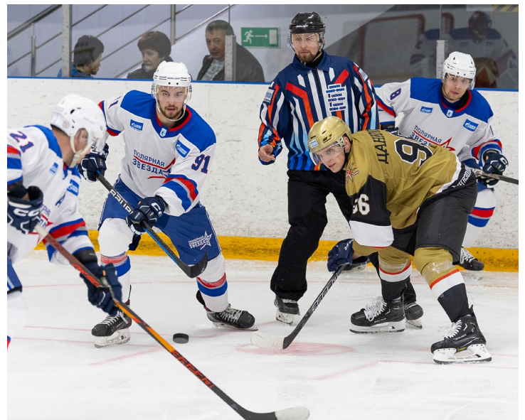
Первая игра чемпионата