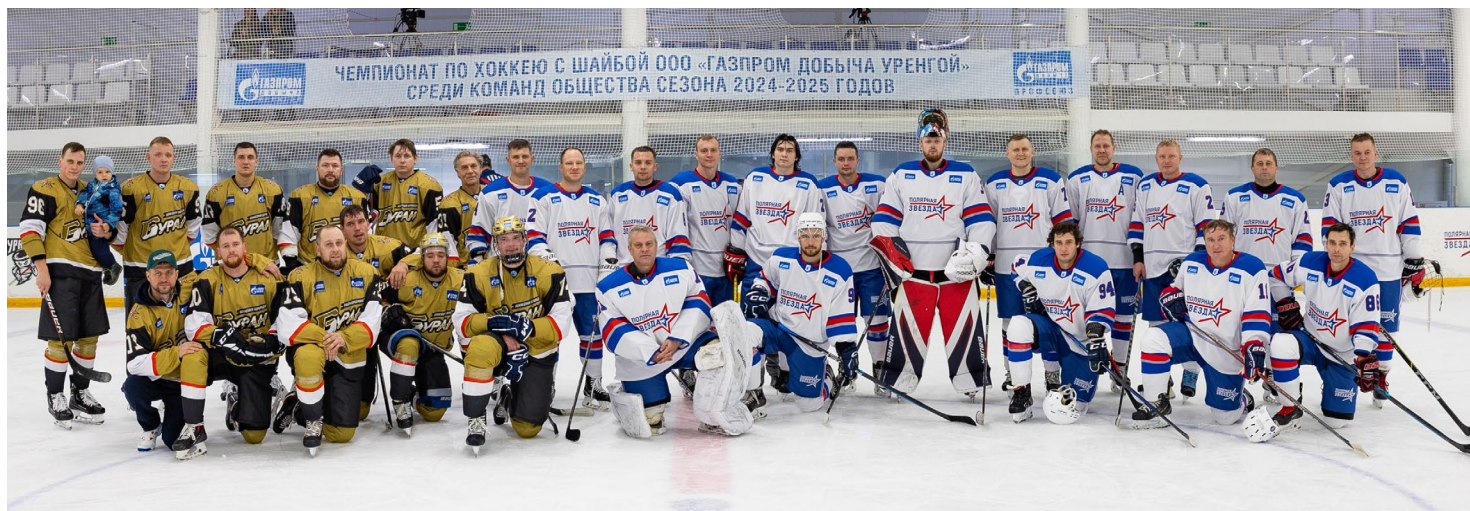
Команды «Бурянь» и «Полярная звезда» открыли турнир

Это игра для настоящих мужчин – выносливых, сильных, отважных. Впрочем, давно прошли времена уличных баталий, когда для игр с шайбой нужны были снег и мороз. Современный хоккей