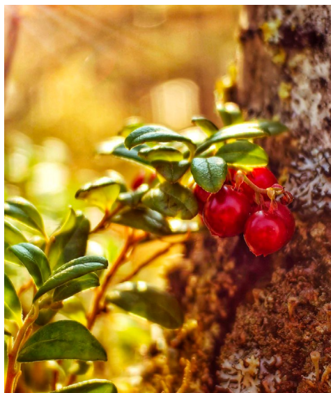
Забирай меня скорей, угостишь потом друзей!