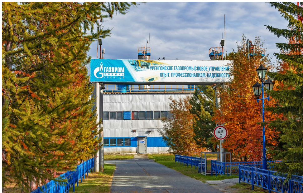
Газовый промысел № 4 в осеннем убранстве