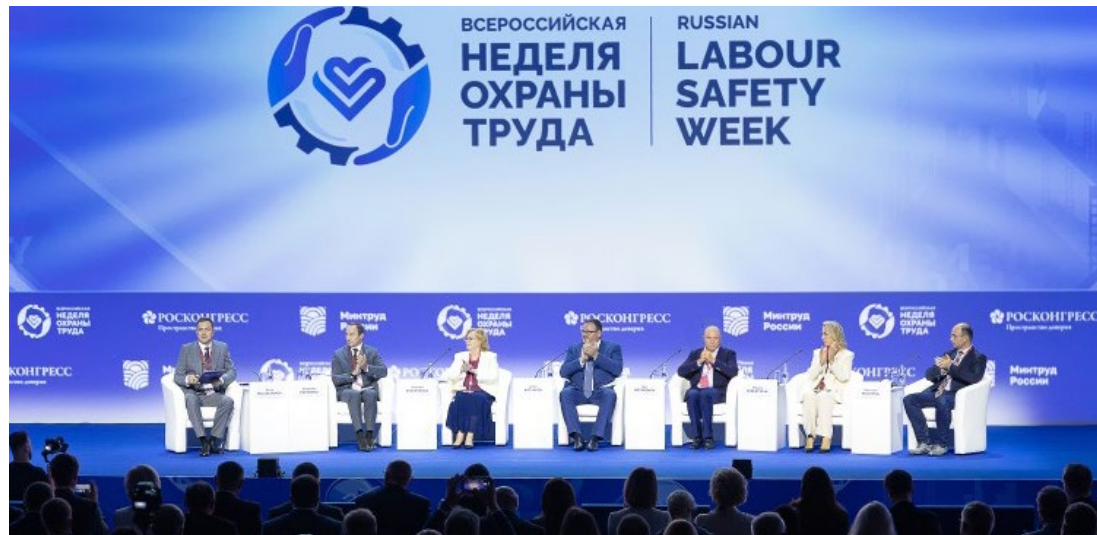
Вопросам безопасности на производстве уделяется большое внимание на самом высоком уровне