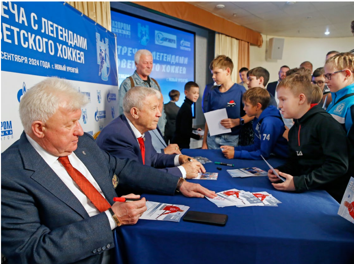
Автограф на память

– это внесезонный вид спорта, ведь есть корты с качественным искусственным льдом. Именно таков СК «Факел», где комфортно и тем, кто играет, и тем, кто болеет.