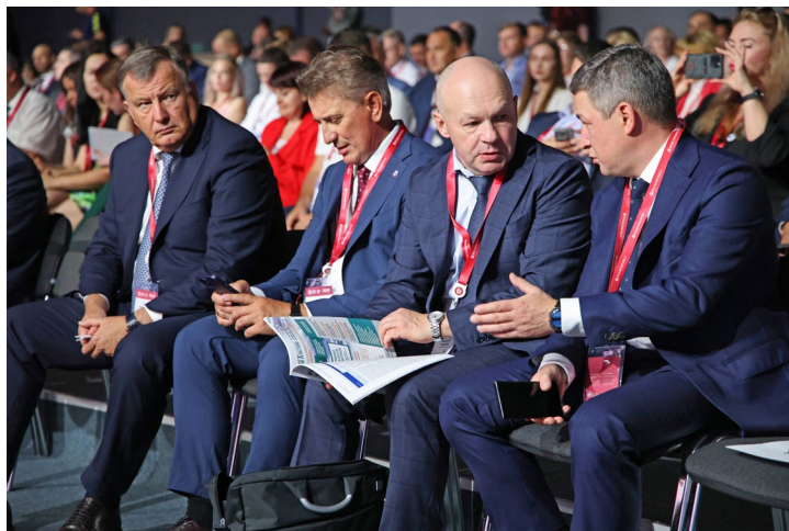
Площадка форума дает возможность руководителям предприятий газового концерна обсудить текущие вопросы

На стратегической пленарной сессии «Культура безопасного труда» с видеобращением выступил Председатель Правительства