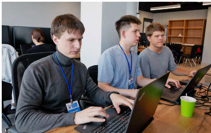
Процесс создания цифрового двойника требует креативных решений

Ирина РЕМЕС