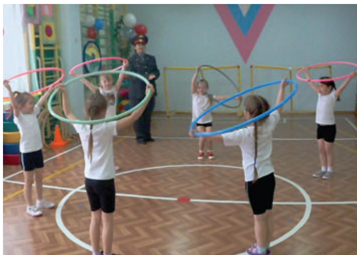
Спортивный праздник.

Нет такого ребенка, который бы не любил праздники. Они приносят веселье и радость, помогают узнать больше об окружающем мире, развить интерес к творчеству и умение жить в коллективе.