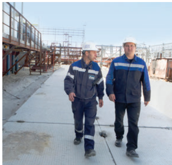
Обходы и контроль процесса строительства проводятся газовиками ежедневно