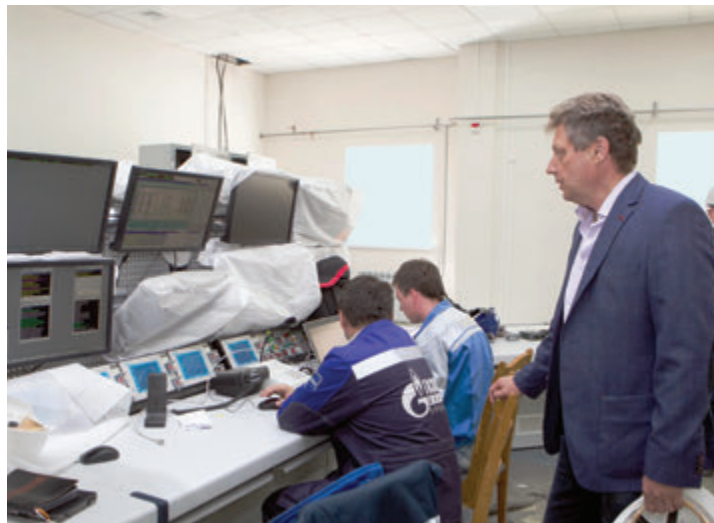
«Сердце» дожимной компрессорной станции — операторная. Здесь также вовсю «кипит» работа

Сейчас повышенное внимание уделяется пусковой станции, которая станет самой мощной ДКС Общества. Однако у специалистов Уренгойского газопромыслового управления впереди еще много работы — как в недалеком будущем, так и в более отдаленной перспективе. В частности,