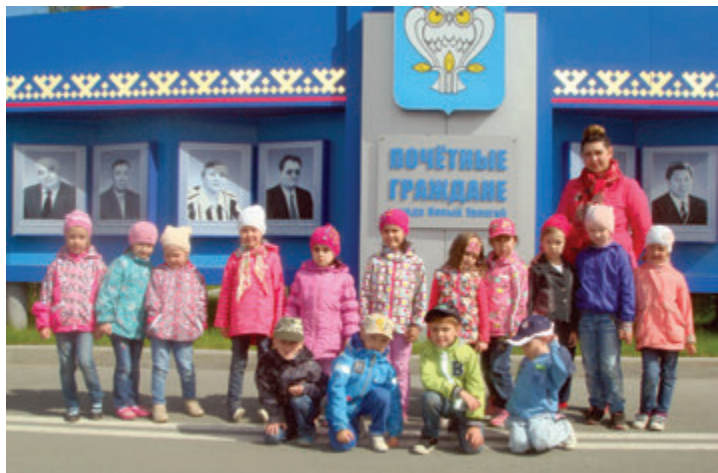
С экскурсией по городу

Любовь к Отечеству начинается с любви к малой Родине, поэтому так важно прививать это чувство к своему городу с детства.