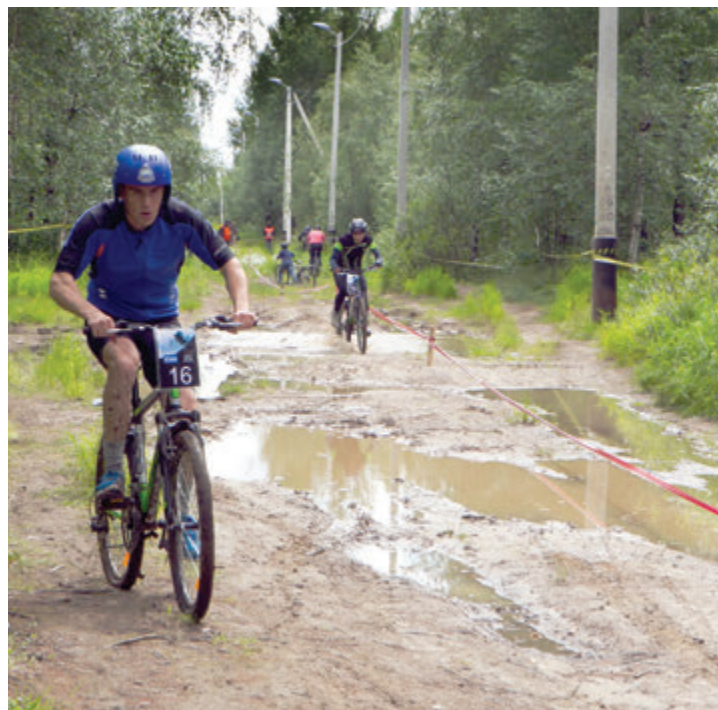
Трасса получилась непростой, но оттого и интересной

— Привычнее, конечно, передвигаться на велосипеде по городским дорогам. Я впервые принимаю участие в соревнованиях по бездорожью, опыта велопр-