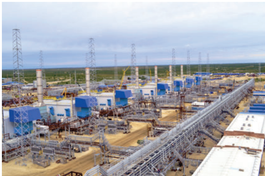
Так выглядела стройплощадка ДКС-1АВ летом прошлого года. Сейчас здесь уже готовы к приему газа

Сергей ЗЯБРИН Фото автора и Элины ГОЛОВИНОЙ