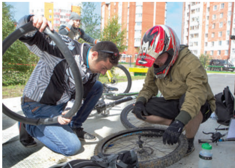
Тщательная подготовка велосипеда к заезду — обязательное условие пробега