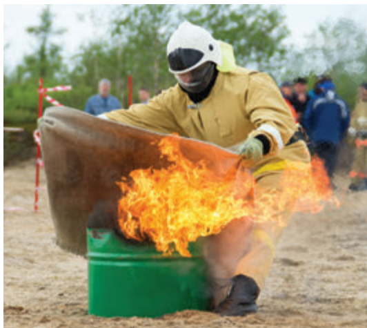
Тушение открытого огня

Для победы во второй части соревнований надо было пройти за максимально короткое время специально подготовленную полосу препятствий. Пожарная эстафета, состоящая из четырех этапов по сто метров, началась с экипировки — конкурсантам предстояло быстро и правильно надеть пожарное снаряжение и затушить горящую бочку