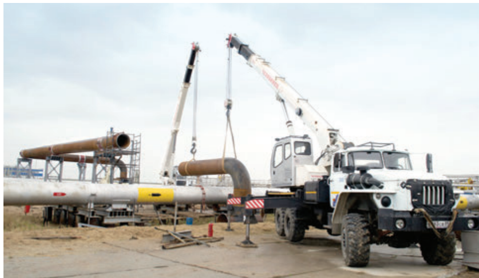
Врез трубопровода для подачи валанжинского сырья в цех очистки газа ДКС

Коллектив ГКП-11, крупнейшего поставщика жидких углеводородов Уренгойского