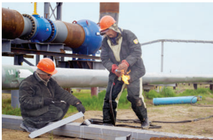
Подрядчики монтируют площадку обслуживания кранового узла