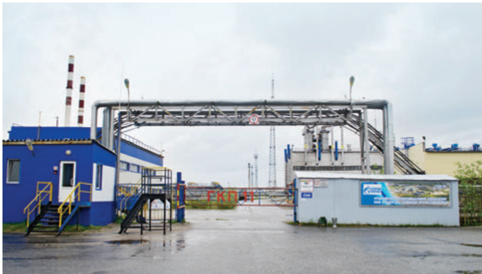
Газоконденсатный промысел № 11

Вместе с газовиками в эти дни на ГКП-11 трудятся представители механо-ремонтного цеха Управления аварийно-восстановительных работ, а также подрядчики из компании «Газэнергострой». Сейчас, во время планового останова, на объекте ведется масштабная реконструкция. Валанжинская установка комплексной подготовки газа ГКП-11 — самая молодая в Уренгойском газопромысловом управлении. Она была запущена в 2003 году, в настоящее время вышла на неизбежный пе-