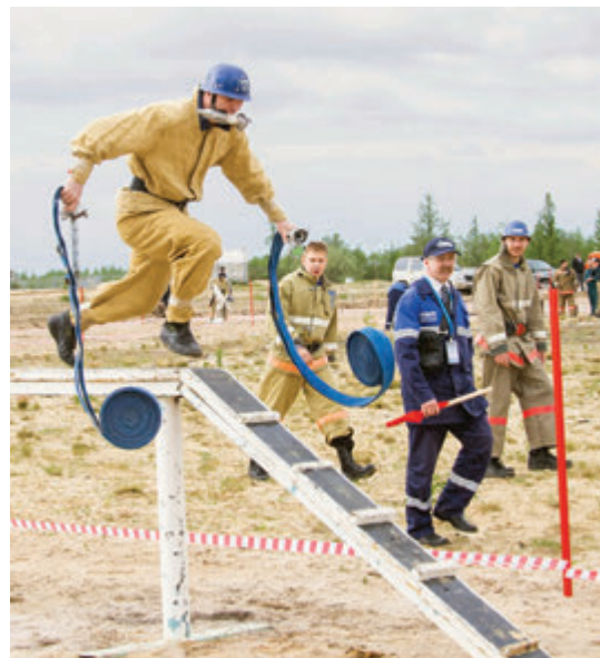
Преодоление бум-бревна с двумя пожарными рукавами