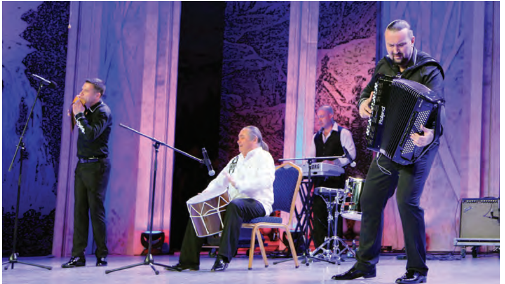
На сцене — виртуозы «НУарт-ПРОЕКТА»

Ансамбль «НУарт-ПРОЕКТ», исполнивший на сцене «Факела» зажигательную инструментальную пьесу «Арцах» существует всего год. Однако, многие из участников коллектива ранее выступали в составе «Джазпрома», группы, взявшей в 2011 году Гран-при