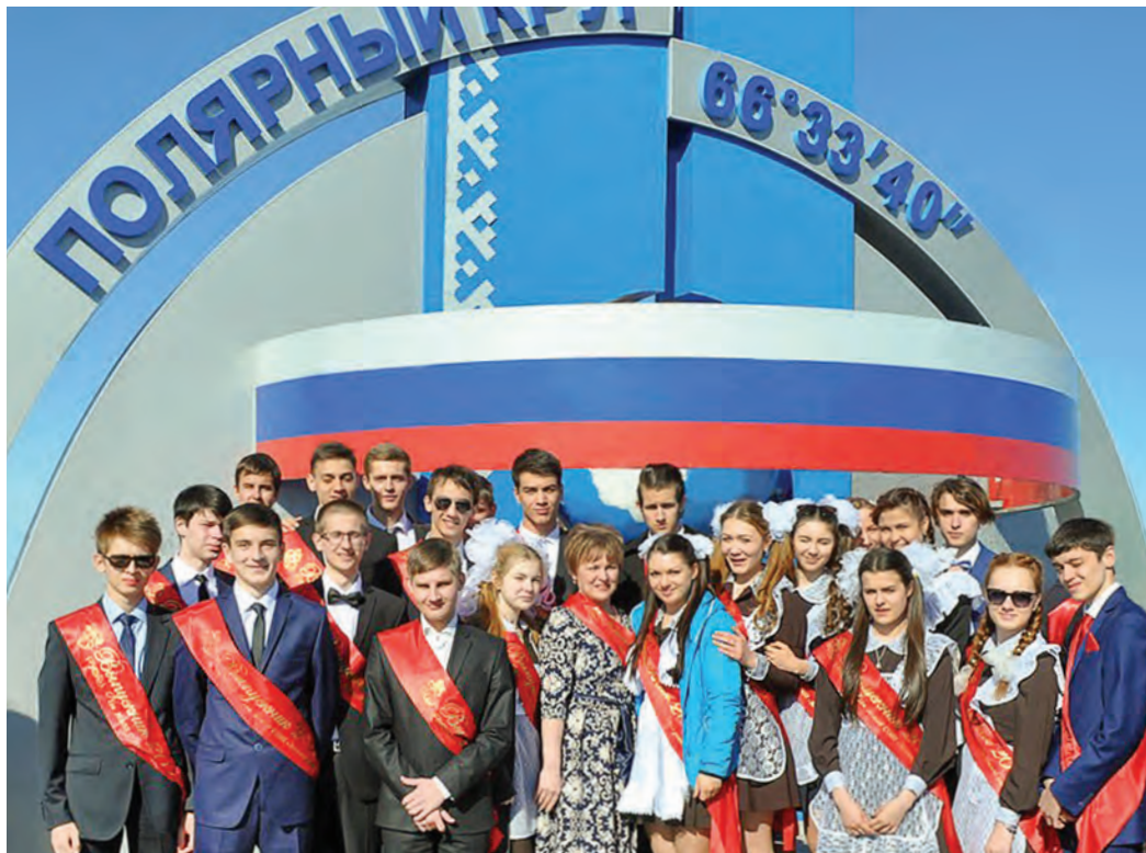
Ученики 11 А класса школы «Земля родная» — среди первых выпускников в истории проекта «Газпром-классы»

В прошедшую субботу, 23 мая, последний звонок прозвенел для миллионов выпускников со всей страны. Среди учеников, вступающих во взрослую жизнь и прощавшихся со школой в этот день, были и представители «Газпром-классов» Общества «Газпром добыча Уренгой».