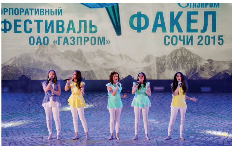
«Небо Лондона» в исполнении девушек группы «Алфавит»