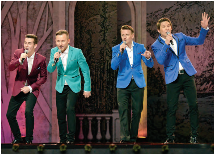
Встречайте: группа «Полус»