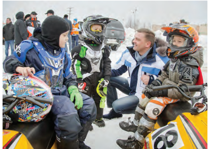
В Новом Уренгое управлять снегоходом учатся с малых лет. Главное — поддержать желание заниматься спортом

Это оплата и качество жилищно-коммунальных услуг, очистка микрорайонов города от снега, жалобы на работу диспетчерских служб управляющих компаний, некачественное и неоперативное выполнение заявок по содержанию и ремонту общего имущества. Учитывая количество обращений и споров, возникающих в данном вопросе, было принято совместное решение депутатов и администрации города о создании рабочей группы по рассмотрению обращений и жалоб.