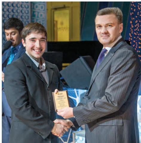
Напутствие молодому специалисту от руководителя газодобывающего предприятия

Безусловно, оставляет желать лучшего работа самих управляющих компаний. Принятый в прошлом году на федеральном уровне закон о лицензировании деятельности управляющих компаний в сфере ЖКХ по-