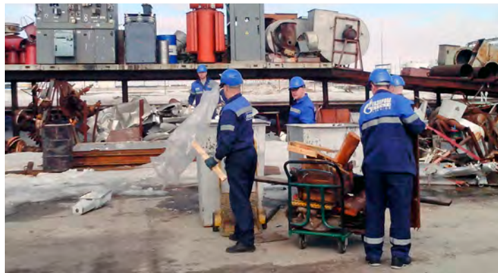
На территории Управления по транспортировке нефтепродуктов и ингибиторов

Пятьсот работников из пятнадцати филиалов Общества организованно провели уборку производственных территорий. Вооружившись граблями, лопатами и прочим инвентарем, сотрудники газодобывающего предприятия очистили более