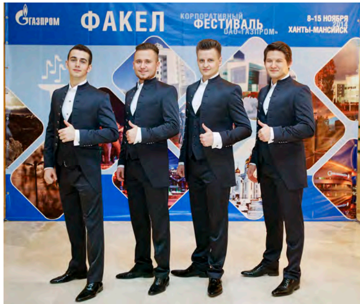
2014 год. На зональном туре корпоративного фестиваля «Факел» в Ханты-Мансийске.

Парни встречаются на репетициях каждый день. Ведь на сцене должно все выглядеть идеально и легко. Выступление группы — это всегда фейерверк эмоций, щедро отправленных публике в целом и персонально каждому