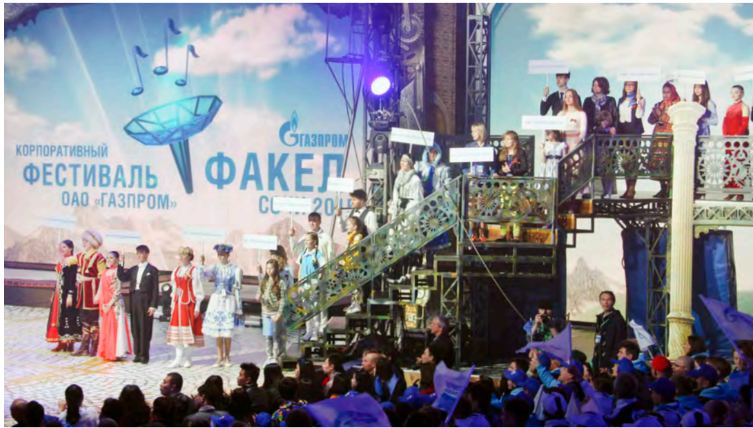
На церемонии открытия корпоративного фестиваля «Факел»

В Сочи завершился заключительный тур VI корпоративного фестиваля «Факел» ОАО «Газпром». На конкурсе самодельных творческих коллективов и исполнителей приехали более 1500 участников и гостей из 37 дочерних обществ газового концерна, а также делегации из Франции, Германии, Словении, Китая, Белоруссии, Армении, Киргизии.