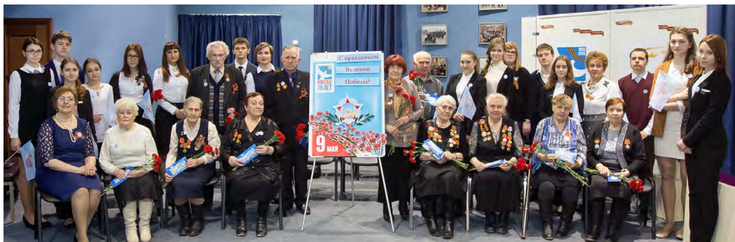
За вашу стойкость, мужество и честь поклон вам низкий, ветераны!