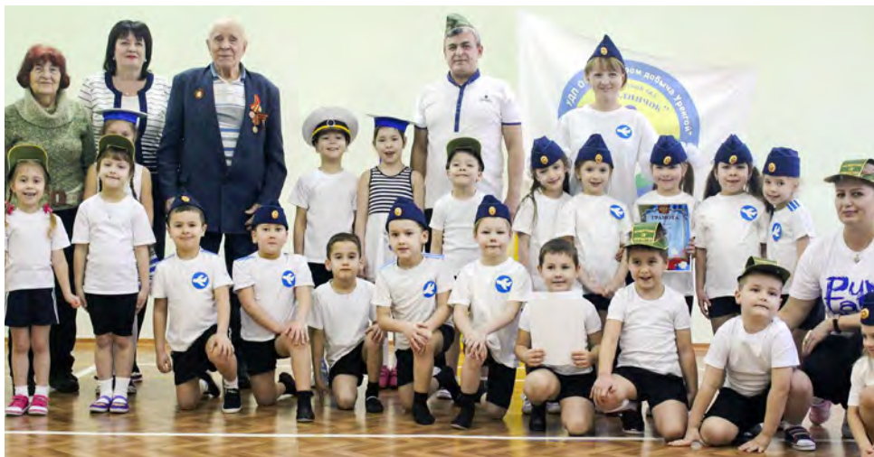
В Управлении дошкольных подразделений Общества знают: воспитание патриотов начинается с детского сада

Пока строгое жюри подводило итоги, малышки удивили всех великолепным исполнением матросского танца «Яблочко». Далее — торжественная минута награждения. Лучшим был признан отряд «летчиков» старшей группы. Отряды «моряков» и «бравых солдат» разделили между собой второе и третье