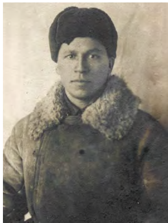
1941 год. Оборона Москвы. На это время пришли страшные морозы

большого дружного семейства была особая традиция — ходить в гости к жившему по соседству генерал-лейтенанту Богдану Колчигину, выдающемуся российскому и советскому военачальнику,