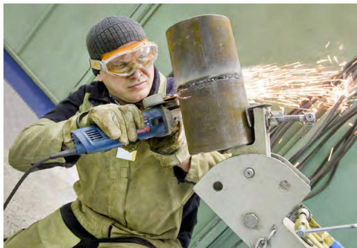
Работать качественно, безопасно, быстро!

Начались испытания со сборки и сварки контрольного сварного соединения трубы диаметром 159x6 мм. При этом необходимо было уложиться в строго отведенное время, используя ограниченное количество электродов и определенный угол сварки — 45 градусов. Независимые контролеры оценивали последовательность, качество и безопасность при выполнении задания. Затем участники в тестовой форме от-