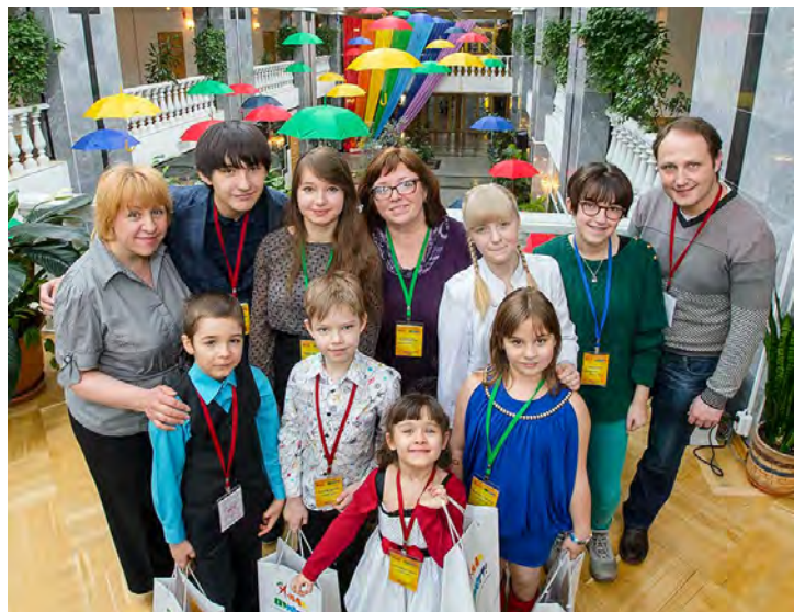
2013 год. Дружное детское жюри на фестивале «Я-мал, привет!»

Пожалуй, именно мероприятия, где изучались культурные