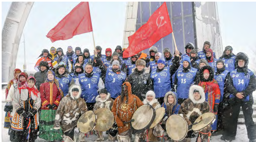
Стартовая точка маршрута — стела на Полярном круге в Салехарде