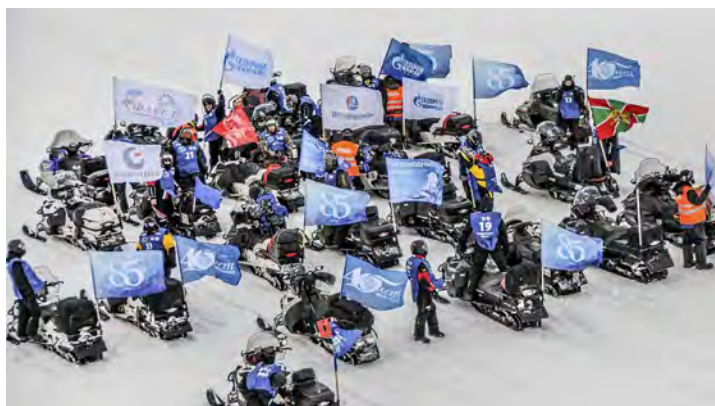
Небольшой перерыв на реке Обь. Вид с вертолета