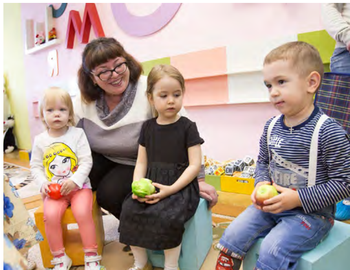
2015 год. В ЦЭР всегда особое отношение к малышам