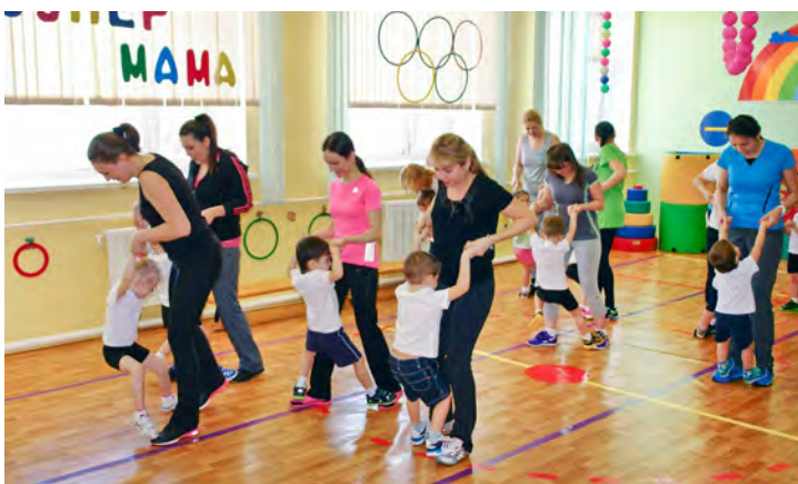
К финишу — с мамой!

Жизнь детского сада «Белоснежка» наполнена веселыми играми, чудесными событиями, сказочными превращениями. Как считает педагогический коллектив сада, по-другому организовывать работу с малышами нельзя, ведь детство — это очень короткий промежуток времени, но при этом — самый важный для формирования личности человека. Чем больше радости испытает ребенок в детстве, тем интереснее он будет выстраивать свою уже взрослую жизнь.