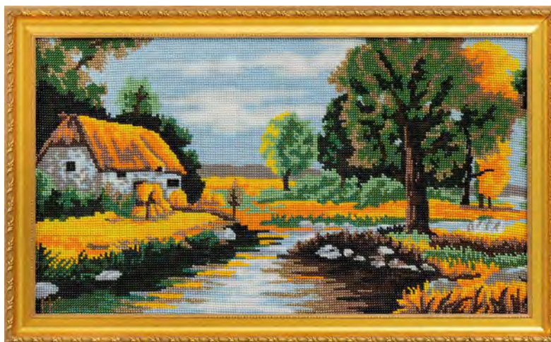
«Хуторок» (бисер и картинка подобраны автором без набора для вышивки)