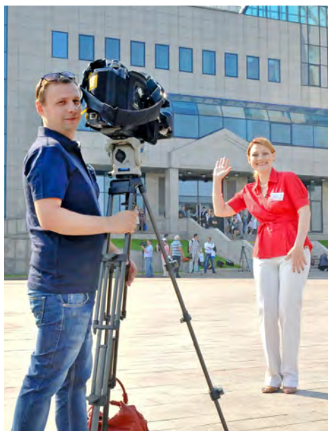
На годовом Общем собрании акционеров ОАО «Газпром». О серьезном мероприятии — с хорошим настроением!

С хорошим настроением, обстоятельно мы рассказываем о том, что может быть интересно вам, и о тех, кто заинтересовал нас. Мы наблюдаем за событиями сегодняшнего дня и используем свои архивы. Мы осваиваем современные медиатехнологии и ищем новые формы визуализации. Сегодня мы хотим вместе с вами прожить самые интересные, самые трудные, самые яркие и самые трогательные моменты. Потому что завтра они уже станут историей.