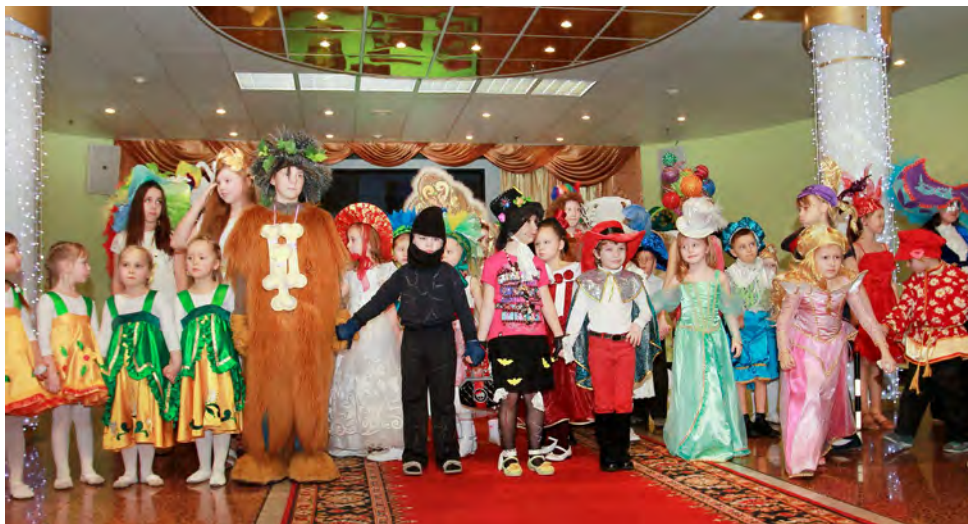
Праздник удался, ведь все дело в шляпе!

Первыми моделями, продемонстрировавшими головные уборы из далекого прошлого, стали воспитанники ЦЭР, изучающие иностранные языки. Ребята в образе первобытных людей умело показали зрителям как жили наши далекие предки. С большим интересом гости встречали очаровательных представительниц Древнего Египта и Древней Греции. В следующем зале Королевства шляп было очень весело и оживленно: здесь можно было увидеть головные уборы, которые носили на Руси. Все присутствующие узнали о «горлатной шапке», картузе, а девочки показали красоту и разнообразие