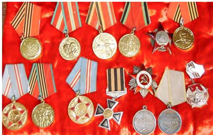
Ордена и медали за проявленные в боях доблесть и отвагу

Подготовил к публикации Сергей ЗЯБРИН