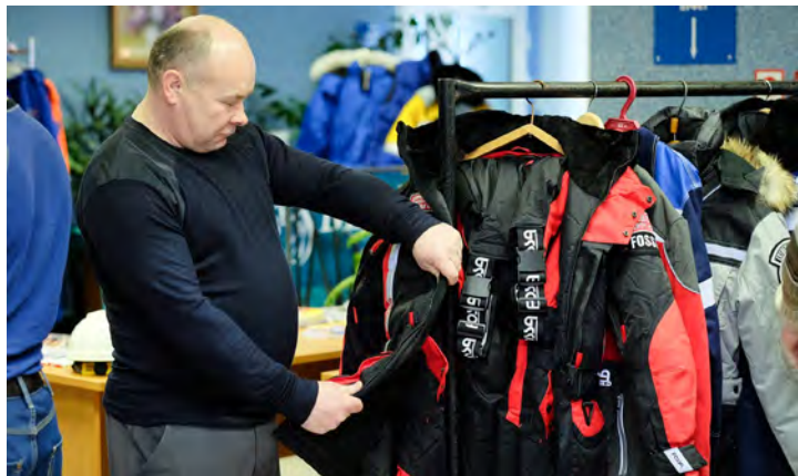
«Мой размерчик! Надо примерить...»