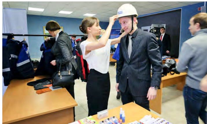
Умную голову надо беречь!