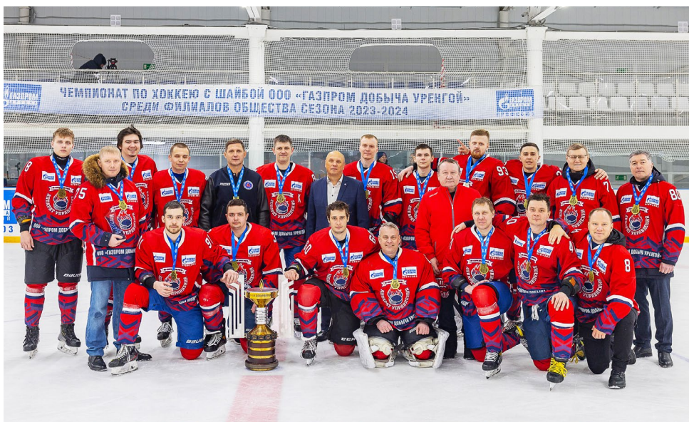
Команда Аппарата управления – победитель турнира