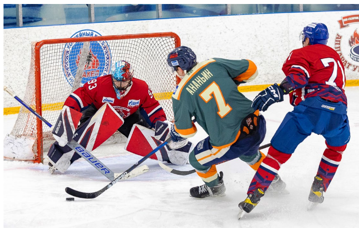
В атаке – самый результативный защитник чемпионата, капитан нефтяников Вячеслав Ананьин