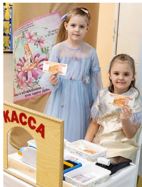
Играем и узнаем новое

Начинать учить детей планировать бюджет стоит как можно раньше. Ведь в юном возрасте им проще принять эти знания, постепенно развивая навыки правильного