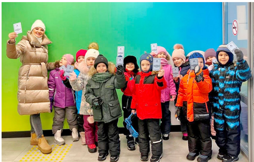
Экскурсия полезна и интересна