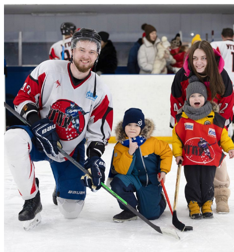
Хоккей – отличное семейное времяпрепровождение!