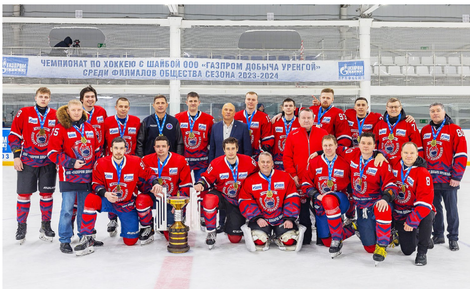
Команда Аппарата управления – победитель турнира