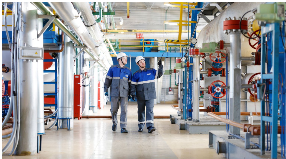
Общество «Газпром добыча Уренгой» эксплуатирует 107 опасных производственных объектов, в том числе четыре – первого класса опасности. Все они зарегистрированы в соответствующем государственном реестре

Отдельно скажу про пожарно-спасательный спорт: на последних соревнованиях, которые проходили в Оренбурге, сборная Общества заняла третье место, состязаясь с 22 командами дочерних обществ и организаций ПАО «Газпром».