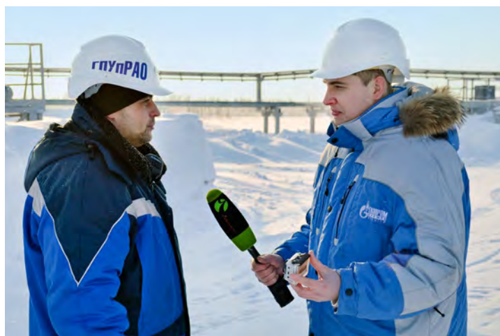
Газодобытчики ГКП-22 рассказали приезжим журналистам об особенностях своей работы

— Всегда интересно побывать на объектах градообразующего предприятия. Для себя мы выяснили, что Общество «Газпром добыча Уренгой» дает людям не только рабочие места, зарплату и материальные блага, но и удовлетворение от того, что ты трудишься на предприя-