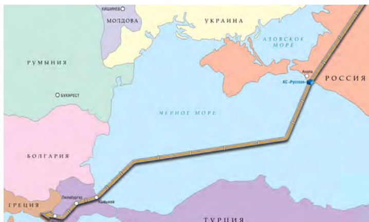
Схема планируемой трассы газопровода из России в направлении Турции

Управление информации ОАО «Газпром» Фото с сайта ОАО «Газпром»