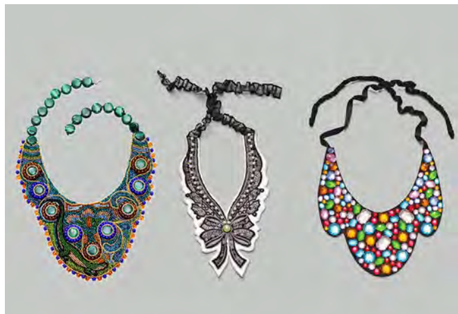
В каждой работе Лилии есть своя изюминка