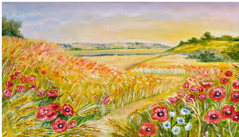
«Поле с маками». Холст. Масло