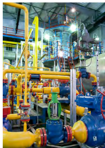
Производственный цех ГКП-22

Сергей ЗЯБРИН