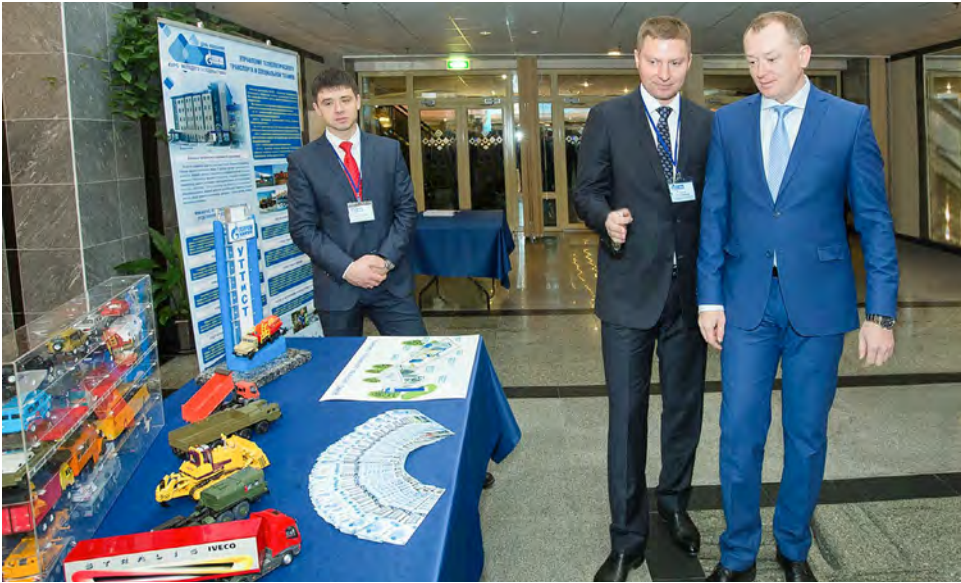
Возле стенда Управления технологического транспорта и специальной техники на ежегодном мероприятии «День компании ООО «Газпром добыча Уренгой» — Курс молодого газодобытчика»

технические виды спорта. Например, снегоходы. Конечно, травмоопасный, но очень мужской спорт, который приносит в мою жизнь определенный гормон счастья. Еще нравится пулевая стрельба. По возможности хожу в тренажерный зал, люблю плавание. В ближайшее время хочу встать на коньки, попробовать себя в этом.