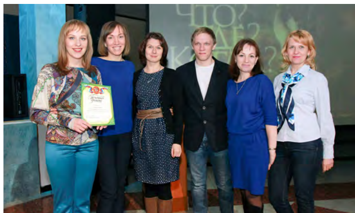
«PРessa» — эрудиты и интеллектуалы

В выходные в культурно-спортивном центре «Газодобытчик» при поддержке Совета молодых ученых и специалистов ООО «Газпром добыча Уренгой» и Первичной профсоюзной организации предприятия состоялся первый Открытый чемпионат администрации и служб Общества по игре «Что? Где? Когда?».