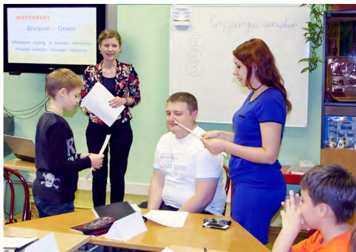
Во время открытого занятия.