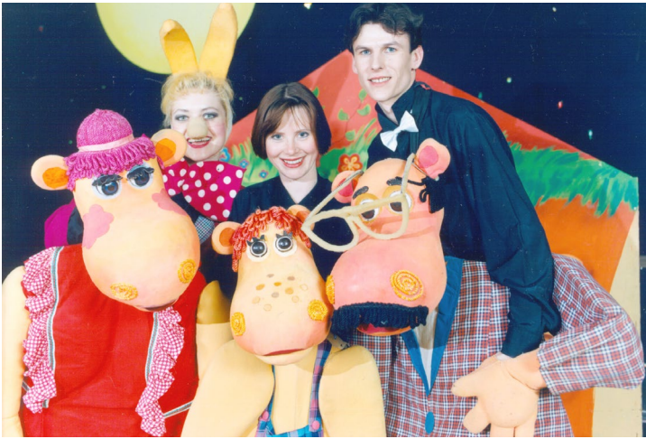
Спектакль «В долине Муми-троллей» вспомнят те, кто смотрел постановки «Кулиски» еще в клубе «Факел»

– Наблюдение за окружающей жизнью для актера – это не только источник информации, но и необходимое условие творчества, часть профессии. У меня все происходит уже на уровне рефлекса. Бывает, во время работы над ролью ты делаешь некий жест и вдруг осознаешь, что повторил его за человеком, который когда-то привлек твоё внимание на вокзале.