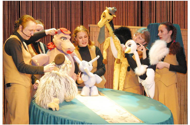
Магия кукловождения создает необыкновенную атмосферу, как это было в свое время на спектакле «Любопытный слоненок»

Театр – это жизнь, только в более концентрированном виде. Такого количества ярких впечатляющих событий за обычный час обычной