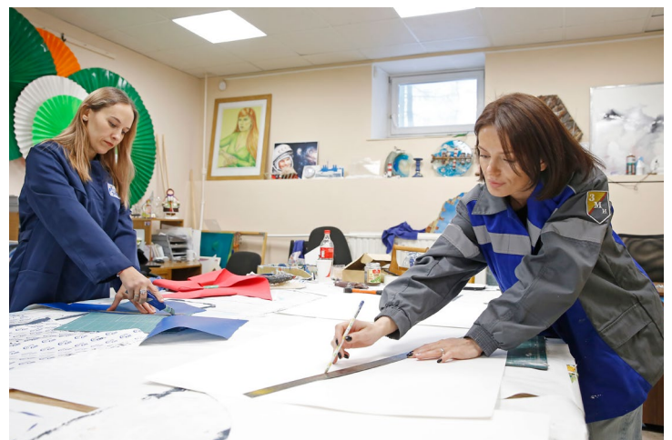
В художественно-производственной мастерской идет работа над эскизами театральных декораций