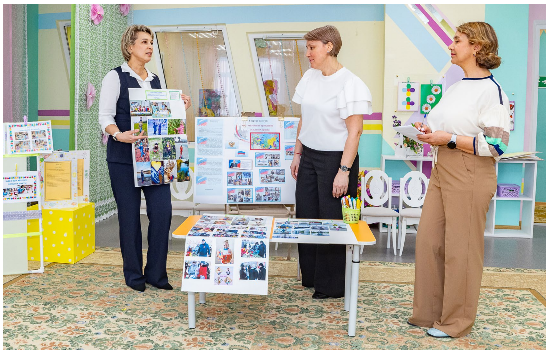
Интересными идеями нужно делиться

Одним из самых ярких проектов, по мнению участников встречи, стал стартап «С чего начинается Родина?», реализованный в подготовительной к школе группе. Он позволил дошколятам побы-