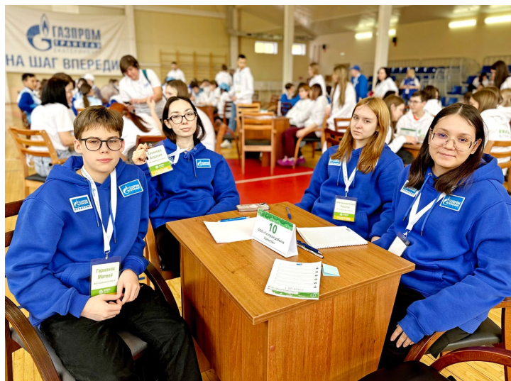
Команда юных экологов Общества

Торжественная церемония открытия нового сезона экофорума состоялась в начале этой недели. На ней была представлена 21 команда-участница из компаний Группы «Газпром». Делегация нашего предприятия – это пятеро юных исследователей, специалист отдела охраны окружающей среды и представитель Совета молодых ученых и специалистов Общества. Путем жеребьевки определились темы для экологических проектов. Юные экоактивисты «Газпром добыча Уренгой» работают над проблемой,