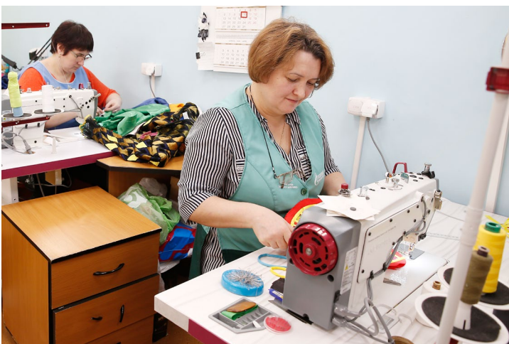
Вошебные умения пригодятся и во время изготовления костюмов для новой постановки «Северной сцены»

Подготовила Ирина РЕМЕС