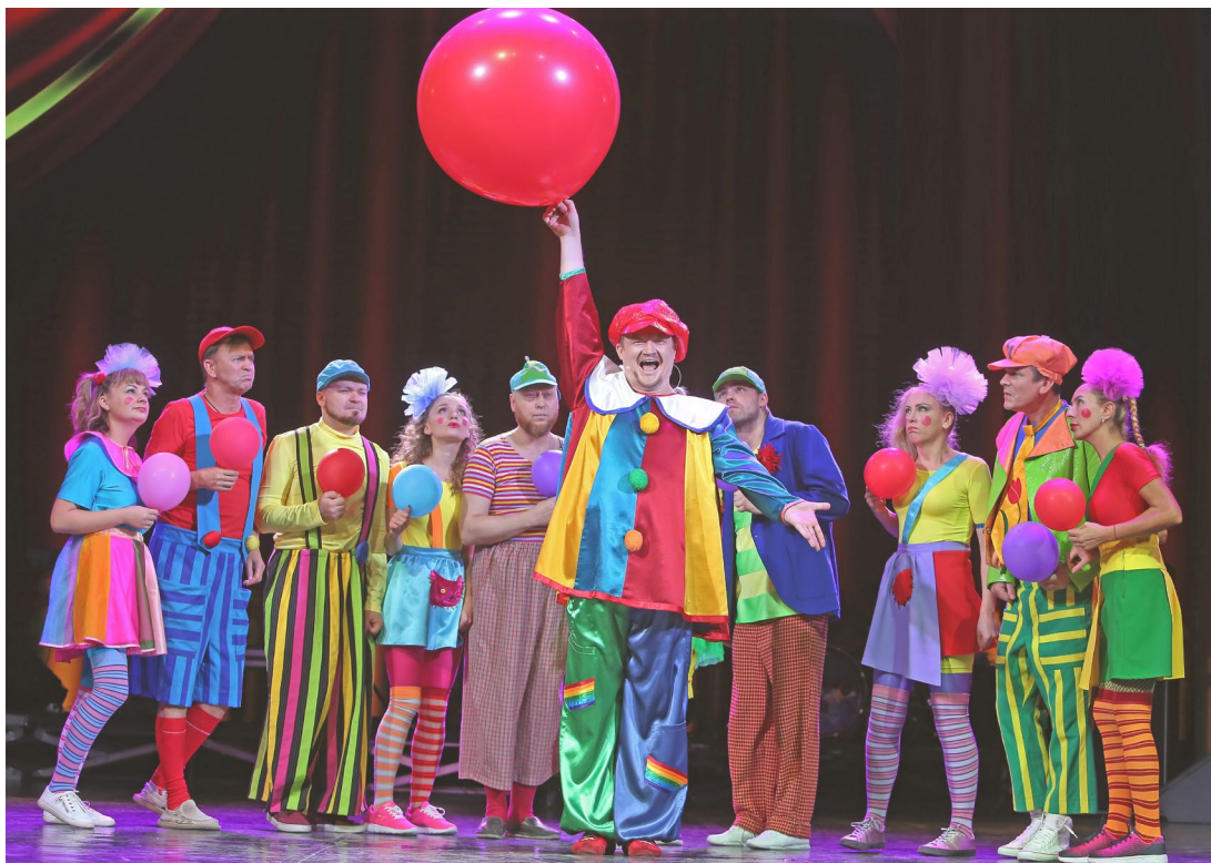
Вот уже 30 лет коллектив «Северной сцены» дарит зрителям волибство, эмоции и праздник

Желаю яркому и исключительно талантливому коллективу не останавливаться на достигнутом, быть всегда в творческом потоке перемен и чувствовать искреннюю любовь зрителей.