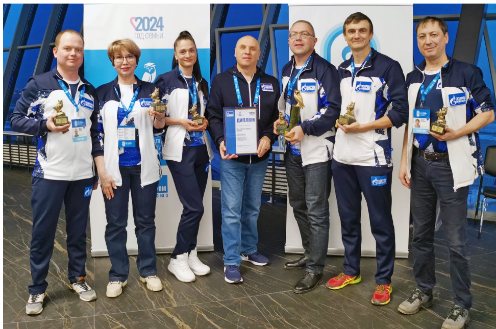
Команда «Газпром добыча Уренгой» – самая интеллектуальная на Спартакиаде!

Александр БЕЛОУСОВ