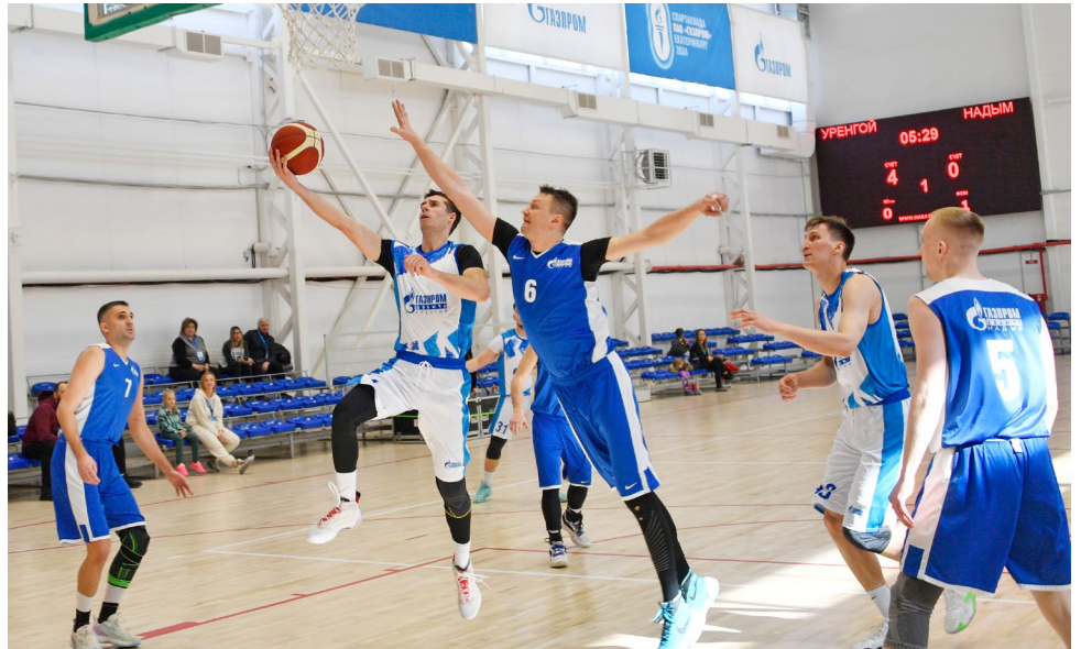
В баскетбольном противостоянии Нового Уренгоя и Надыма дебют за нами – 4:0