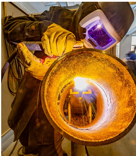
Когда работается с огоньком

– Удивительно, но это был мой первый конкурс за всю жизнь и весь трудовой стаж.