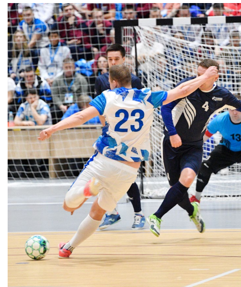
За секунду до удара