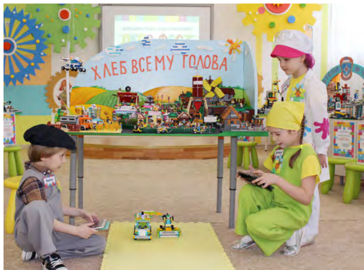
Ребята из «Колобка» подошли к заданию ответственно

Наталья ЕРОШКИНА, ведущий специалист аппарата при руководстве УДП