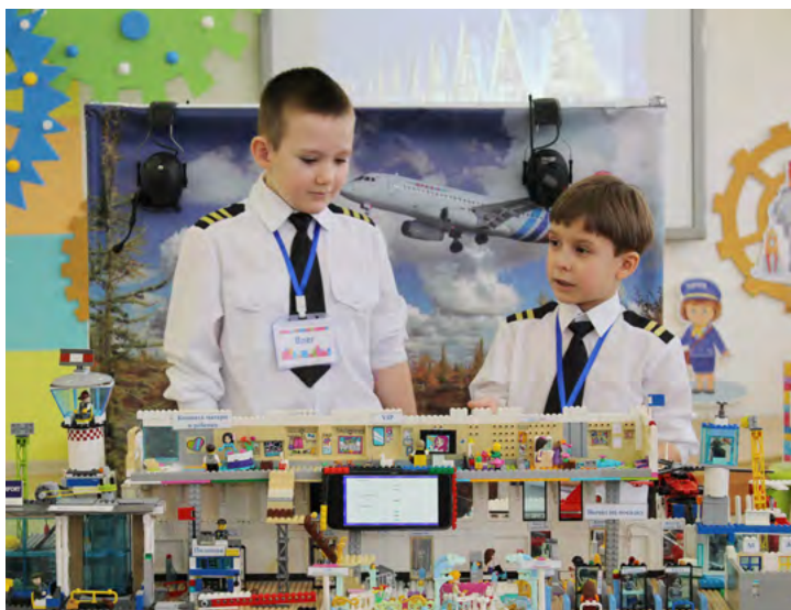
Проект «Аэропорт сити», представленный дошколятами из «Белоснежки», признан победителем фестиваля

Воспитанники «Княженики» раскрыли тему «Спасатели МЧС». Макет состоял из служб скорой помощи, пожарной части, полиции и даже авиации – для экс-