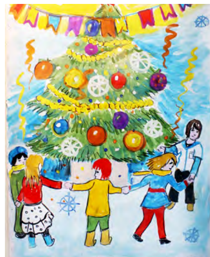
Елка специальная, хороводная. Выставка в музее КСЦ «Газодобытчик»