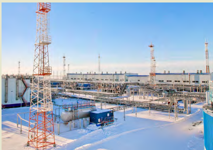
ГКП-22, где ведется разработка ачимовских горизонтов УНГКМ

Во время каникул подростки принимали участие в благоустройстве территорий, прилегающих к производственным площадкам предприятия. Это был настоящий рабочий процесс, по окончании которого ребята получили заработную плату. А в адрес предприятия поступило много положительных отзывов, в том числе и на высоком уровне. Общество «Газпром добыча Уренгой» получило грант Международного конкурса среди организаций на лучшую систему работы с