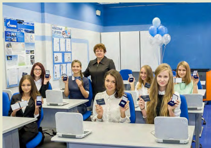
Будущее начинается с «Газпром-классов»!