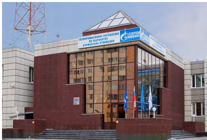
Важные решения по «ачимовке» принимаются здесь

креативные люди, принимающие активное участие в спортивной жизни филиала и Общества. Конечно, в течение пяти лет существования управления происходило постоянное обновление кадров, приходят новые работники, молодые специалисты, но основу коллектива составляют настоящие профессионалы своего дела, трудящиеся со дня образования ГПУнРАО. Ежедневный добросовестный труд каждого работника вносит существенный вклад в решение основных производственных вопросов и обеспечение запланированных объемов добычи газа и газового конденсата.