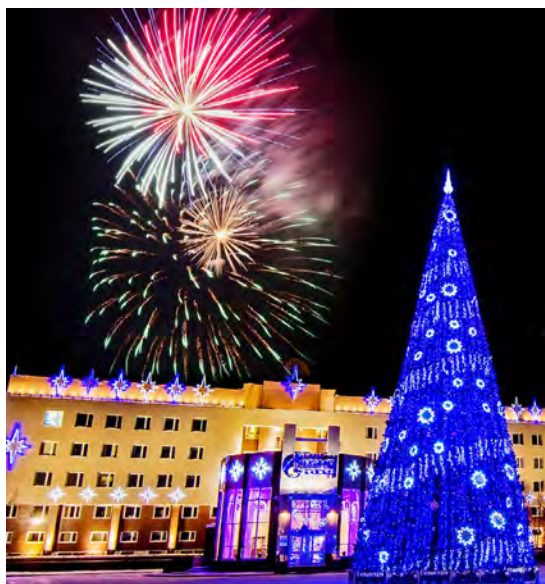
Елка главная — корпоративная