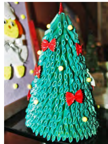
Елка оригинальная, макаронная. Выставка творческих работ (АУП)