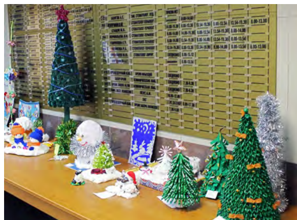
Елки рукодельные. МСЧ