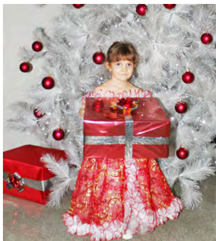
Елка сказочная. КСЦ «Газодобытчик»