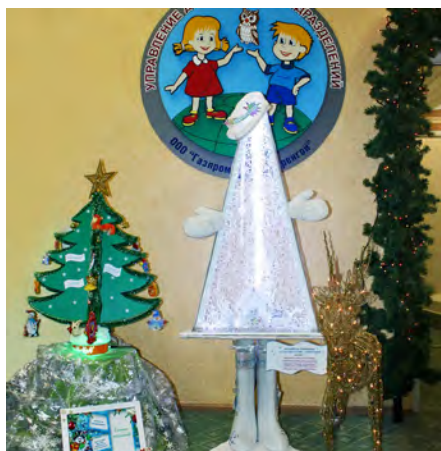
«Елка — топотушка». УДП