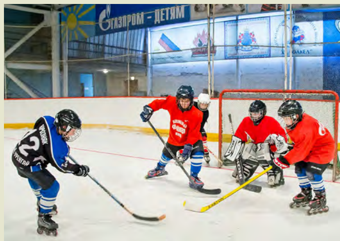
В спорте тоже важны победы!