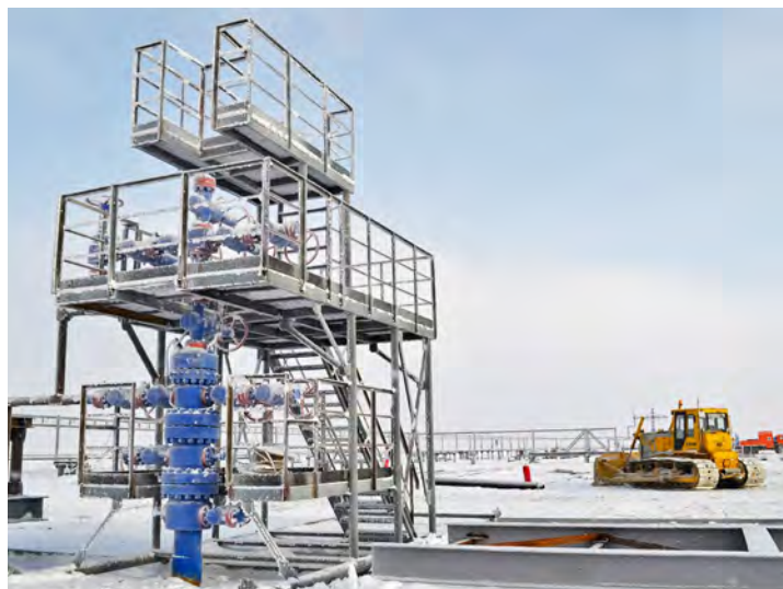
Реализация проекта «Подключение кустов газоконденсатных скважин к УКПГ-22» идет полным ходом...

— Помню, что когда мне поступило предложение перейти на новое место работы, я не раздумывая и без лишних вопросов ответил положительно. На тот момент я занимал должность заместителя начальника цеха ГКП-11, а трудовой стаж на этом промысле составлял восемь лет, и мне казалось, что пора что-то менять в своей профессиональной жизни. Как потом выяснилось, мне предложили возглавить производственно-технический отдел только создающемуся управлению Общества — ГПУнРАО. Тогда, пять лет назад, весь наш коллектив буквально все начинал с нуля. Заново разрабатывалась необходимая документация, налаживалось командное взаимодействие, строилась вся работа по дальнейшему развитию нашего филиала и производственных объектов. В конце этого года нами, уже устоявшимся, сплоченным и сильным коллективом, запущены восемь газоконденсатных скважин. Их ввод в эксплуатацию был предусмотрен самым первым техническим заданием нашего управления и позволил увеличить добычу газа и газового конденсата на 40 процентов. Так что сегодня мы видим первые плоды реализации этого проекта, результат нашего совместного труда. Впереди же нас ждут еще более масштабные задачи, новые производственные победы и достижения.