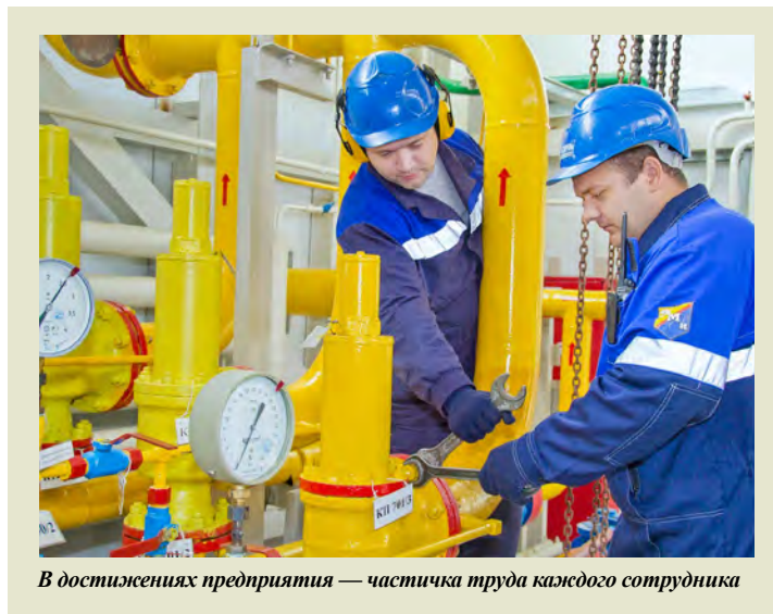
В достижениях предприятия — частичка труда каждого сотрудника

Беседовала Ирина СОРОКИНА