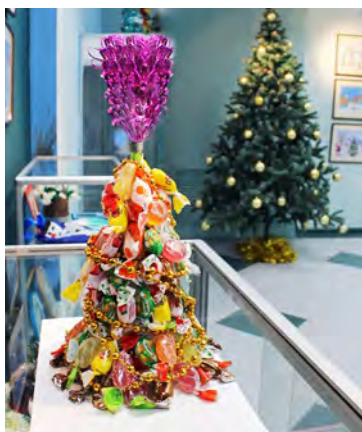
Елочка-конфетка. Выставка в КСЦ