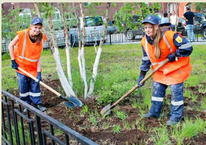
Экологические отряды — за чистоту и порядок в городе