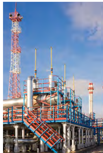
ГКП-22 — основной производственный объект ГПУнРАО

Управление стало пионером в разработке ачимовских отложений в Обществе «Газпром добыча Уренгой». А газоконденсатный промысел № 22, пуск которого стал первым успешным самостоятельным опытом ОАО «Газпром» в деле покорения «ачимовки», выступил в роли экспериментальной площадки для отработки современных научно-технических разработок