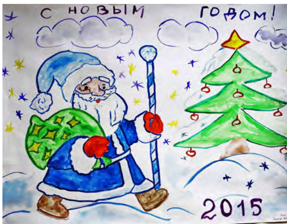
Елка, Деда Мороза ожидающая. УТНиИ