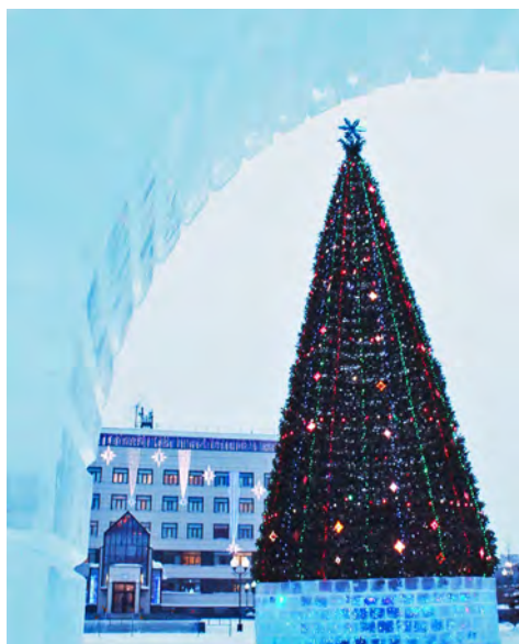
Елка, площадь украшающая. УГПУ