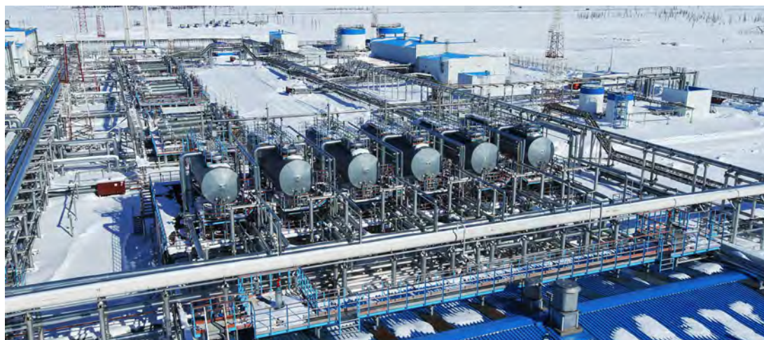
ГКП-22 — это уникальный высокотехнологичный комплекс последнего поколения