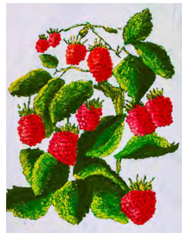
Каждая работа уникальна и несет в себе энергетику добра и созидания