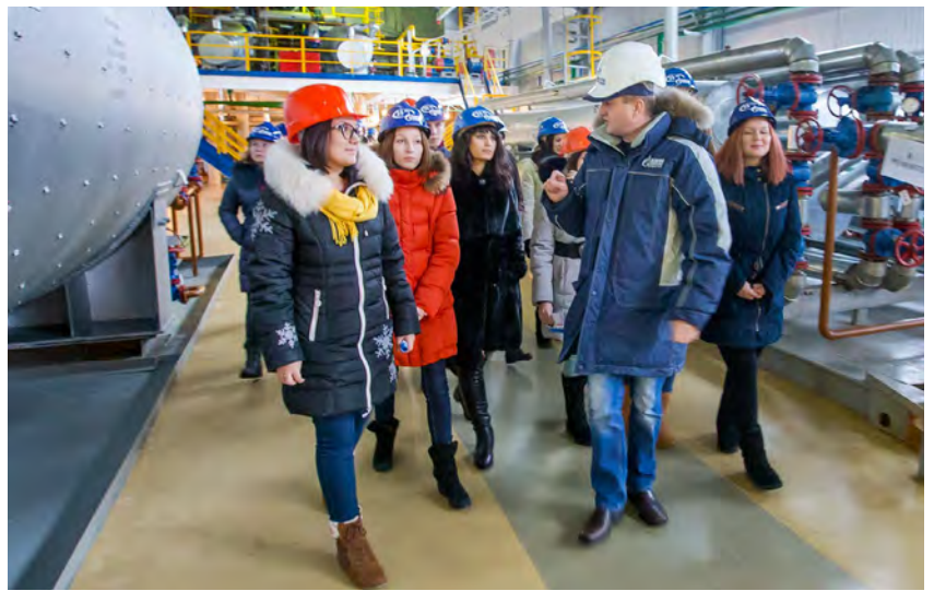
ПП-1 Уренгойского газопромыслового управления. Студенты прибыли