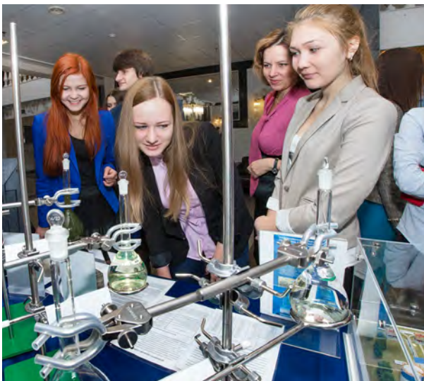
Почти настоящая лаборатория!