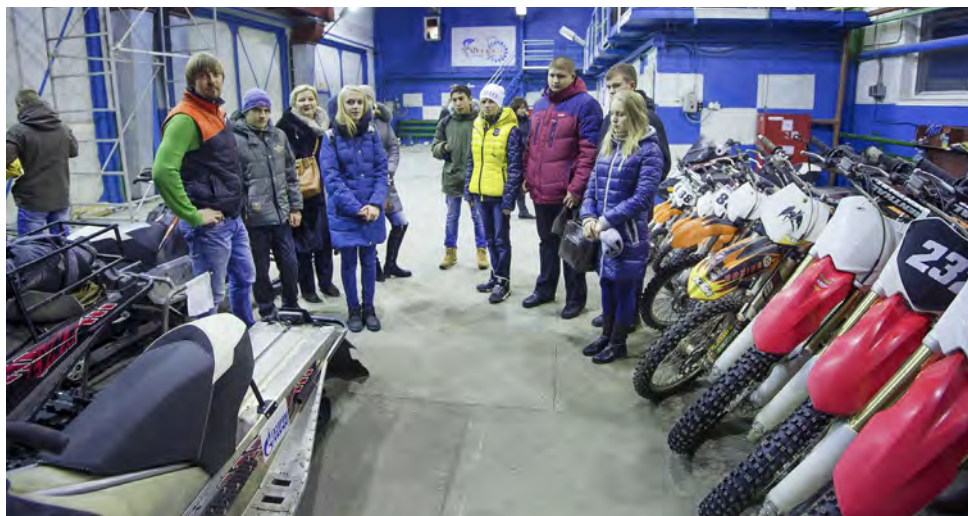
Спортивно-технический клуб «Факел» привлек особый интерес экскурсантов

Поддержали проект образовательные учреждения Нового Уренгоя: многопрофильный колледж, техникум газовой промышленности, а также учебно-производственный центр ООО «Газпром добыча Уренгой» — именно на базе этих трех заведений ребята смогут пройти обучение по специальностям.