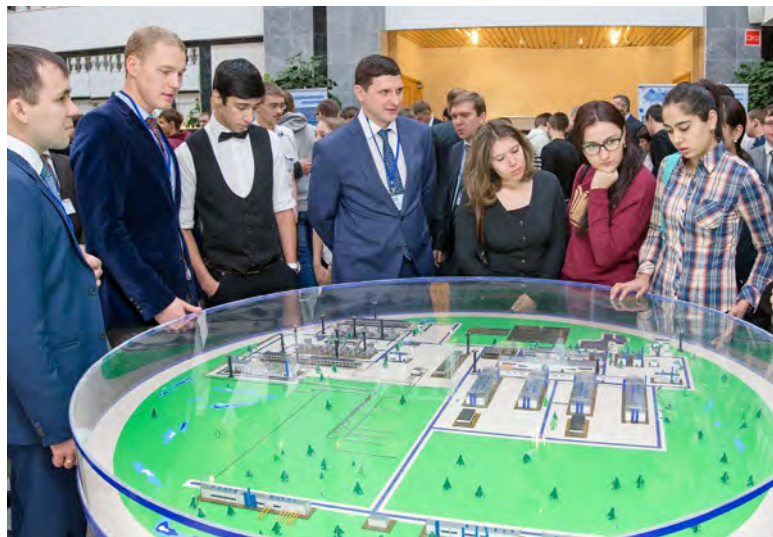
Деятельность подразделений ООО «Газпром добыча Уренгой» представлена на форуме очень наглядно