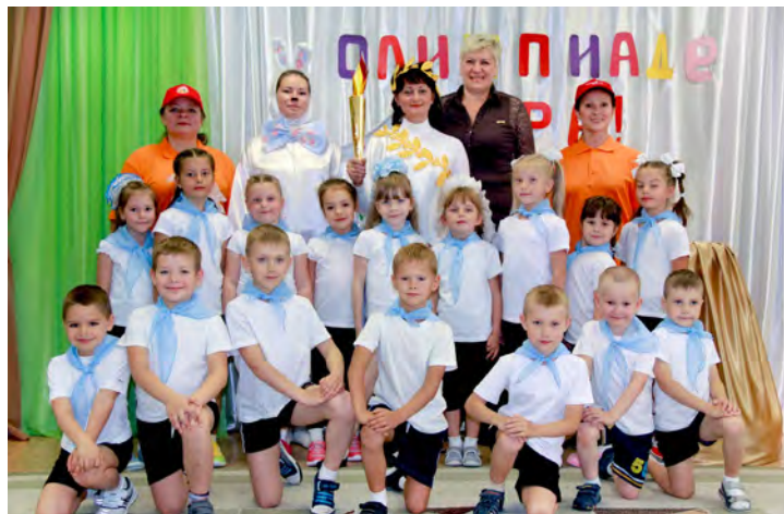
И пусть победит сильнейший

Маленькие летние олимпийские игры в детском саду «Росинка», которому в будущем году исполнится 25 лет со дня открытия, стали уже доброй традицией. Здесь постоянно проводятся мероприятия, направленные на нравственно-патриотическое воспитание детей, пропаганду