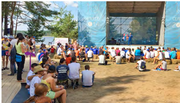
На всех площадках форума кипела жизнь

В рамках «Гражданского форума» — такое название имел этот заезд — профсоюзные активисты Общества прошли обучение по программам «Работающая молодежь» и приняли участие во многих других мероприятиях, предложенных на форуме. Финал образовательной программы — презентация собственных проектов. В течение недели представители молодежи имели возможность общения с известными российскими политиками, бизнесменами, журналистами, педагогами, представителями духовенства, писателями. Своими впечатлениями делится участник форума, молодой руководитель, начальник технического отдела Уренгойского газопромышленного