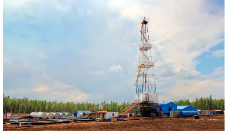
На Ковыктинском месторождении

На Чайядинском месторождении, которое должно обеспечить базу для поставок газа в Китай на первом этапе, завер-