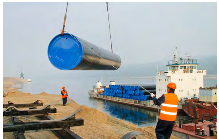
Трубы для ГТС «Сила Сибири»

Управление информации ОАО «Газпром» Фото на странице с сайта ОАО «Газпром»