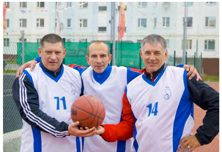
«Бронзовый» опыт. Команда ветеранов финишировала третьей в турнире по стритболу