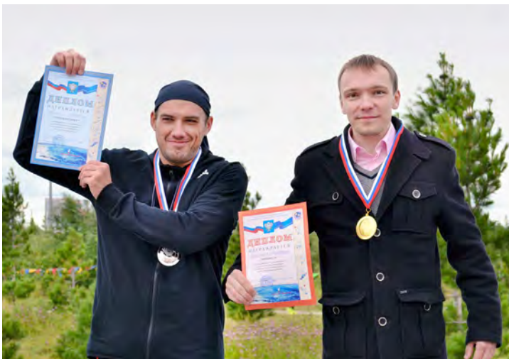
Сотрудники Общества поднялись на две высшие ступени пьедестала почета в соревнованиях по шахматам

Сергей ЗЯБРИН