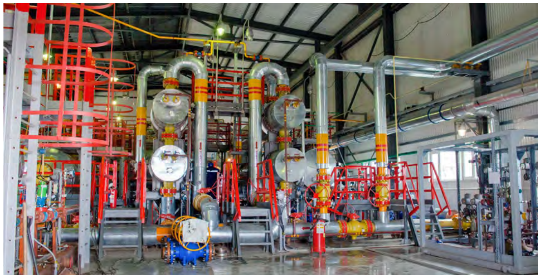
Цех подготовки газа первого нефтяного промысла НГДУ