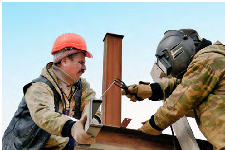
Подрядчики из ООО «ГазЭнергоСервис-Ухта» на стройке ДКС-1АВ