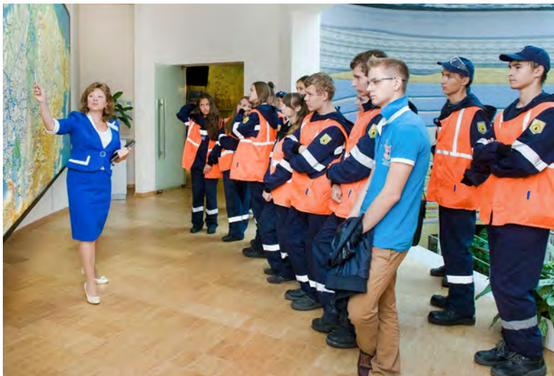
Представители экологического отряда на экскурсии в Музее истории Общества

Год экологической культуры начался для ООО «Газпром добыча Уренгой» с проведения совместных акций вместе с Неправительственным экологическим фондом имени Владимира Ивановича Вернадского. Так, при непосредственном участии Общества и Детской экологической станции Нового Уренгоя был организован III Ямало-Ненецкий окружной тур Всероссийских юношеских Чтений имени выдающегося естествоиспытателя. На самой северной из проведенных по всей стране конференций отметились более сотни преподавателей и одаренных учеников со всего Ямала. Пятеро победителей окружного тура более чем достойно представили ЯНАО на XXI Всероссийских юношеских чтениях имени Вернадского, вернувшись в апреле из Москвы с дипломами лауреатов I и II степени, памятными знаками, а также грамотами в номинациях «Лучший стенд», «Лучшее представление работы», «Лучшее полевое исследование» и «Самая активная работа на секции».