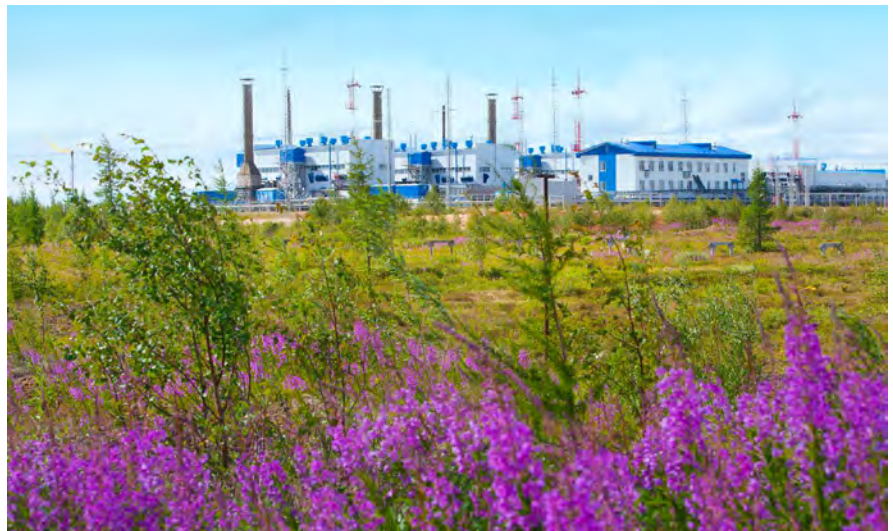
Уникальные флора и фауна ямальской тундры в безопасности

Сергей ЗЯБРИН