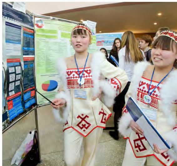
Презентация проекта одаренными ямальцами

Одним из важных пунктов Экологической политики ООО «Газпром добыча Уренгой» является доступность информации о хозяйственной деятельности предприятия, прозрачность его природоохранной деятельности и принимаемых в этой области решений. Специалисты регулярно устраивают экскурсии на производственные объекты, в Музей истории Общества и Детскую экологическую станцию, проводят тематические лекции, демонстрируют презентации и организуют субботники. При этом аудиторией таких мероприятий — люди из самых разных возрастных и социальных групп. К примеру, воспитанники детских садов с воодушевлением отнеслись к походу в мини-зоопарк Детской экологической станции, в котором проживают находящиеся под опекой Общества тропические обезьянки-игрунки. Школьникам и студентам были интересны посещения газовых промыслов Уренгойского месторождения. Остальные жители города смогли ознакомиться с экологической экспозицией в рамках международной акции «Ночь в музее». Только за первую половину 2014 года непосредственными участниками познавательных акций стали более 700 человек. Помимо этого, с результатами природоохранной деятельности ООО «Газпром добыча Уренгой» аудитория знакомится через городские и окружные газеты и телепередачи, информационные буклеты и баннеры.