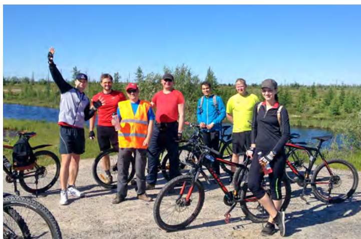
На велосипедах, да по северным дорогам

Работники управления автоматизации и метрологического обеспечения организовали в минувшие выходные любительский велопробег, принять участие в котором мог любой желающий.