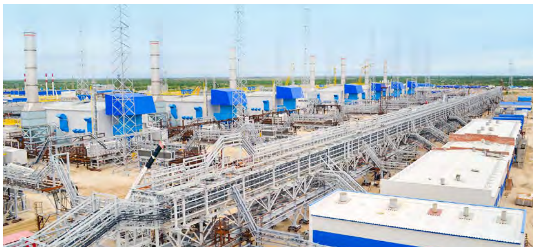
Строительная площадка дожимной компрессорной станции

Можно с уверенностью сказать, что история Уренгойского нефтегазоконденсатного месторождения и газовой столицы России — это история постоянного развития и созидания. В разные годы данные процессы шли то в ускоренном, то в замедленном темпе, но никогда не останавливались. Так, если на стартовом этапе обустройства строители, несмотря на невероятно тяжелые условия, показывали поистине небывалые темпы работы, то в непростые перестроечные и постперестроечные времена сфера строительства во всей стране переживала большой спад, связанный не только с трудностями в части материального снабжения, но и кадровым дефицитом.