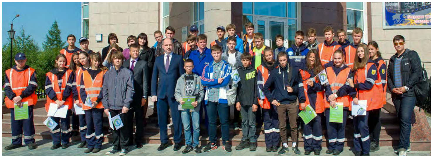
Открытие третьей смены экоотряда состоялось!

Служба по связям с общественностью и СМИ