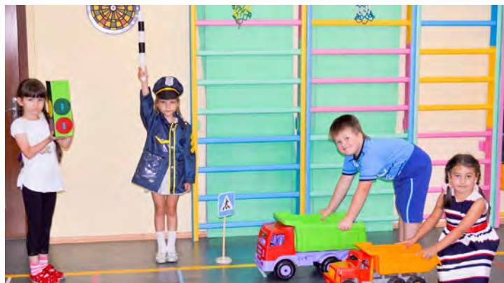
Учимся быть грамотными пешеходами и вежливыми водителями!

Эту серьезную задачу призваны решать как сами родители, так и грамотные специалисты — педагоги детских садов управления дошкольных подразделений Общества «Газпром добыча Уренгой». «Безопасное лето» — так называлась тематическая неделя, организованная для воспитанников детского сада «Снежинка». В игровой форме воспитатели проводили беседы с дошколятами, обсуждали возможные опасные ситуации на дороге и способы их предупреждения. Были организованы любимые малышами конкурсы рисунка на асфальте и экскурсии по городу. По завершению тематической недели воспитанники «Снежинки» приняли участие в игровой программе «Азбука