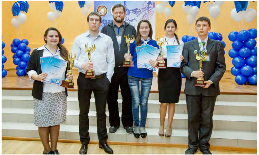
Победители III окружного тура Чтений имени Вернадского

Не забывают сотрудники Общества и об экологическом образовании внутри коллектива. В этом году, в частности, предприятию было активно представлено на IV Всероссийской научно-практической конференции молодых ученых и специалистов «Обеспечение эффективного функционирования газовой отрасли», в форуме молодых ученых «U-NOVUS», в выставке «Газ. Нефть. Новые технологии — Крайнему Северу» и в мероприятии по обмену опытом в сфере охраны окружающей среды с коллегами из ООО «Газпром добыча Ноябрьск».