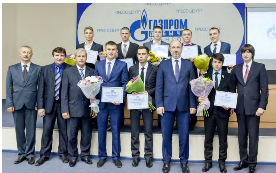
Руководители Общества «Газпром добыча Уренгой» поздравили будущих газодобытчиков с заслуженной победой в Открытом конкурсе

На прошлой неделе в здании службы по связям с общественностью и СМИ общества «Газпром добыча Уренгой» в торжественной обстановке были подведены итоги Открытого конкурса молодых специалистов на право трудоустройства в дочерние предприятия ОАО «Газпром», участие в котором приняли 236 человек из 34 регионов страны. По результатам серьезных испытаний победителями были объявлены десять выпускников российских учебных заведений. Восемь из них уже получили именные сертификаты, гарантирующие рабочие места в Обществе.