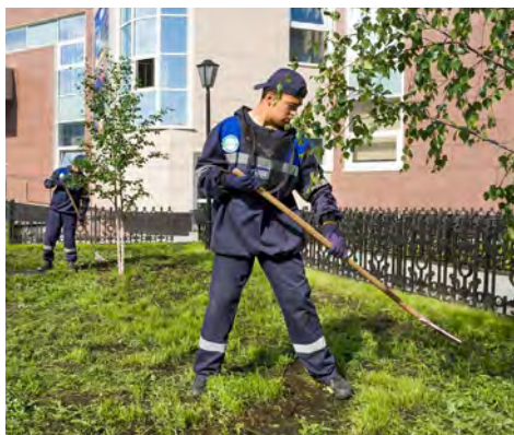
И станет трава зеленее...