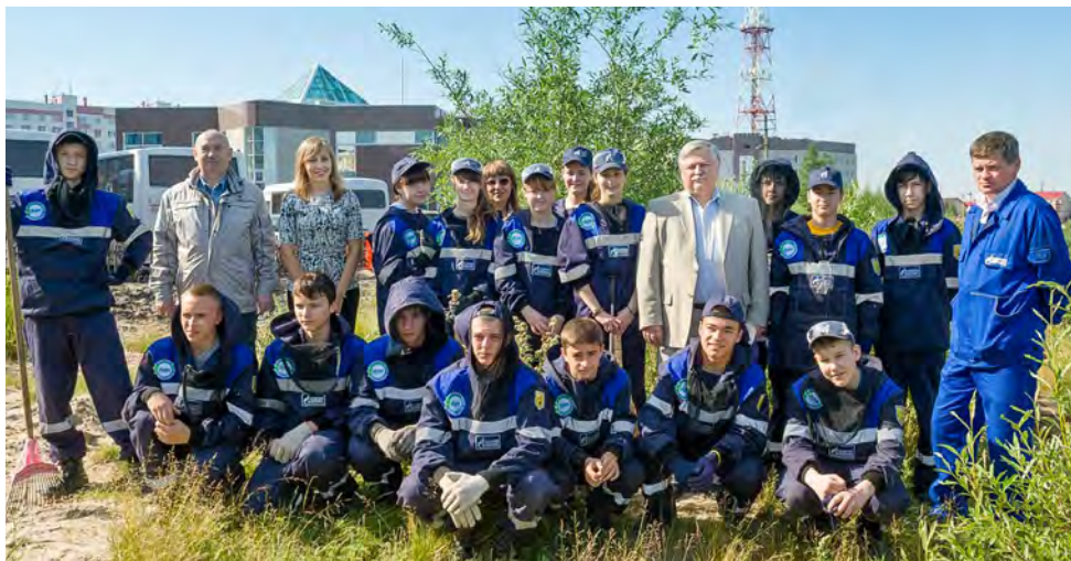
Знакомство главы администрации города (на снимке — в центре) с экологическим десантом Общества состоялось

Со всеми заданиями ребята справляются, сложностей практически не возникает. Трудятся в отряде как юноши, так и представительницы прекрасного пола, распределение ролей вполне логичное: молодые люди перемещают наполненные мусором пакеты, а девушки делают все для того, чтобы эти пакеты были заполнены доверху. За правильным чередованием труда и отдыха, а также за каче-