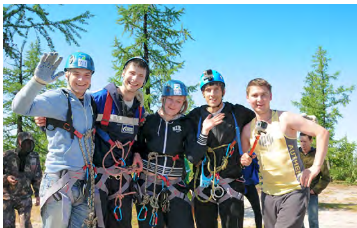
Привет от нашей команды туристов-газодобытчиков!

Команда выражает большую благодарность организаторам мероприятия — коллективу ЗПКТ (филиал ООО «Газпром переработка») — за столь интересную и насыщенную программу. Туристический фестиваль превратился в настоящий праздник жизни, молодости и спорта. Все участники получили огромное удовольствие: свежий воздух, отличная погода, дружная компания — что может быть лучше для прекрасного отдыха!