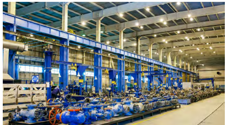
Цех по ремонту и наладке технологического оборудования

лотая рыбка», проведение ультразвуковой толщинометрии стенок трубопроводов теплоснабжения, горячего и холодного водоснабжения на всех обслуживаемых объектах. И это далеко не полный список того, чем сегодня заняты «золотые руки» Общества.