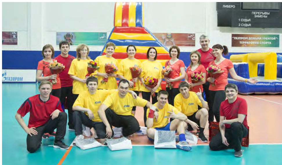
«Территория спорта» — это всегда хорошее настроение и масса положительных эмоций

В длинном списке имен участников спортивно-развлекательной игры «Территория спорта», за несколько лет своего существования успевшей зарекомендовать себя среди приверженцев здорового и активного образа жизни, пополнение. В конце апреля проверить скорость, ловкость и волю к победе смогли дебютанты соревнований — сотрудники редакции корпоративной газеты «Газ Уренгоя» ООО «Газпром добыча Уренгой» и специалисты службы по связям с общественностью и средствами массовой информации ООО «Газпром добыча Ямбург».