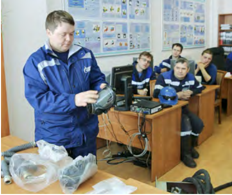
Практическое применение средств индивидуальной защиты...

Ежегодно, начиная с 2001 года, по инициативе Международной организации труда 28 апреля отмечают Всемирный день охраны труда. Данная инициатива была вызвана желанием привлечь внимание мирового сообщества к вопросам снижения ежегодной смертности и травм на рабочих местах. Проведение подобной акции служит прекрасным поводом для предоставления и продвижения нового в сфере охраны труда, различных информационных и профилактических мероприятий.