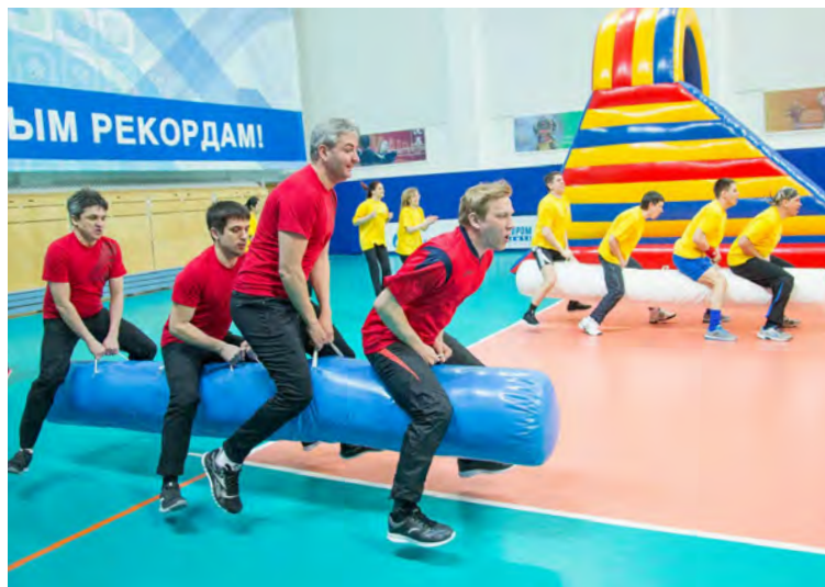
Здесь можно вспомнить детство...