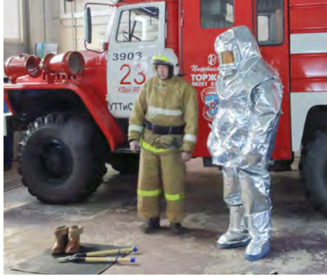
... и теплоотражательного костюма.

Очередной раз работникам управления были предоставлены материалы и практическое руководство по использованию средств индивидуальной защиты, в частности изолирующего шлангового противогаса, предназначенного для защиты органов дыхания, глаз и кожи лица, необходимого при работе во вредных условиях труда. Затем газодо-