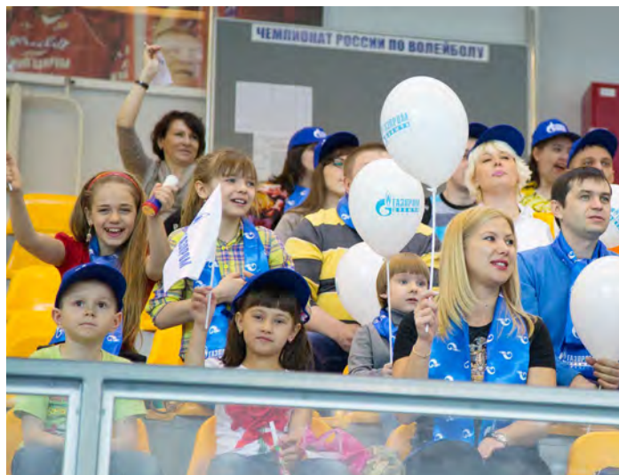
... и болеть за своих