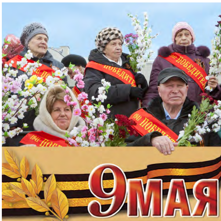
На параде, посвященном празднованию годовщины Великой Победы.