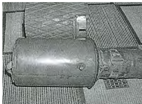
Это ручная граната РГД-33. Ее принесли наши прадеды, чтобы дети всегда помнили о войне