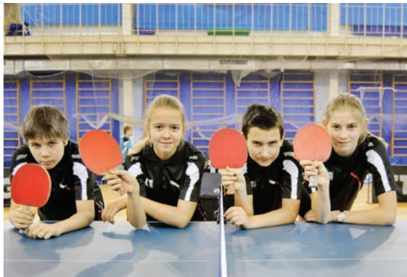
Детская сборная ООО «Газпром добыча Уренгой» по теннису

Взрослые спортсмены боролись за медали Спартакиады в лыжных гонках, полиатлоне, мини-футболе, настольном теннисе, пулевой стрельбе. Газодобытчики, инженеры, слесари, бухгалтеры, водители, операторы котельной, контролеры и токари на время оставили свой трудовой пост, чтобы отстоять спортивную