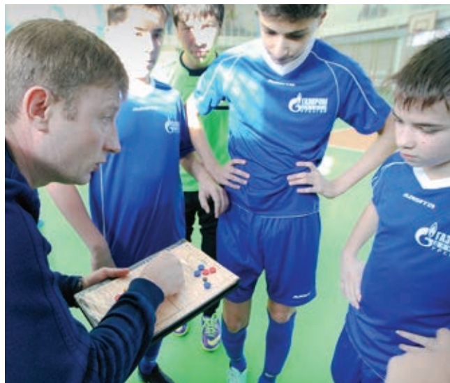
Советы тренера — на вес золота