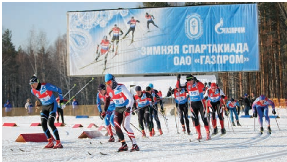
Лыжная эстафета. На пути к финишу

В итоговой турнирной таблице наши лыжники и лыжницы закрепились в середине второй десятки. Таких же результатов достигли и новоуренгойские полиатлонисты-мужчины. «Трехслойные» соревнования состояли из выяснения отношений с оружием в руках (пулевой стрельбы из винтовки), силовой гимнастики, где мужчины подтягивались, а жен-