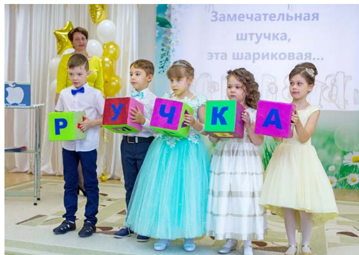
«День особенный сегодня» – трогательное прощание «Росинки» с выпускниками