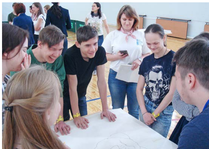
Квест объединяет и сплачивает

– Совершенно не сожалею, что сегодня нахожусь здесь.