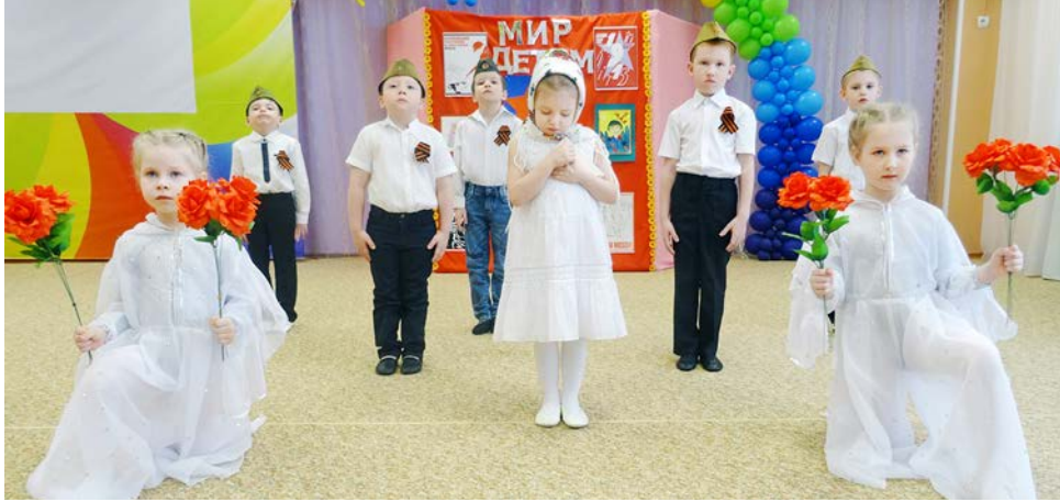
Утренник «Согреем память сердца» получился искренним и трогательным

Патриотизм не заложен в генах, это качество – социальное, и потому не наследуется, а развивается. Одной из важнейших задач современности является формирование таких понятий, как Родина, Отечество, Отчизна. По мере развития каждый из нас постепенно осознает свою принадлежность к семье, коллективу, народу, стране.