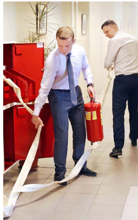
Разворачивание рукавной линии для «тушения» очага возгорания

Учения состоялись также в Управлении технологического транспорта и специальной техники. В них были задействованы порядка 90 человек. Подобные тренировки проходят раз в полгода в соответствии с планом основных мероприятий.