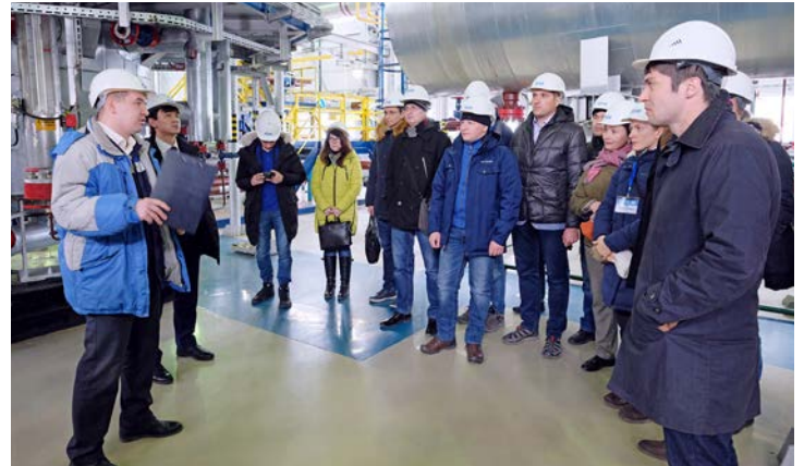
Экскурсия на производственные объекты Общества – важная часть программы научно-практической конференции