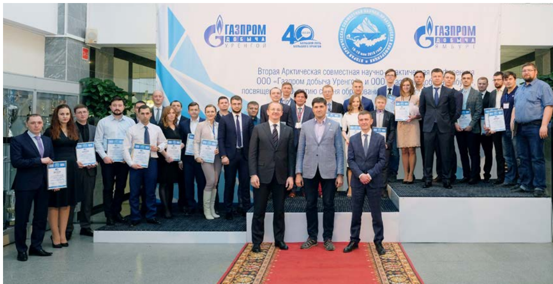
Лучшие молодые ученые российских компаний нефтегазового сектора – победители второй Арктической научно-практической конференции получили награды из рук руководителей газодобывающих предприятий