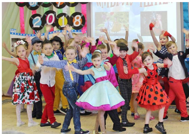
В «Родничке» праздник прошел под девизом «Мы – лучшие!»