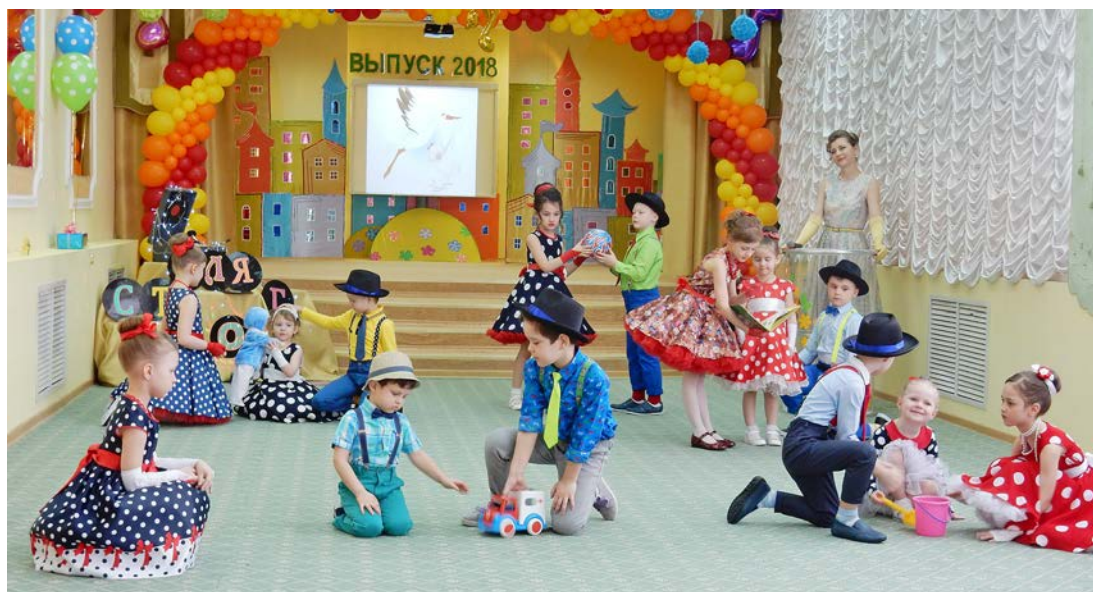
Выпускной в детском саду «Колобок» – «Стиляги-шоу»

– Педагоги детского сада приложили немало сил, чтобы помочь родителям воспитать ребят умными, талантливыми,