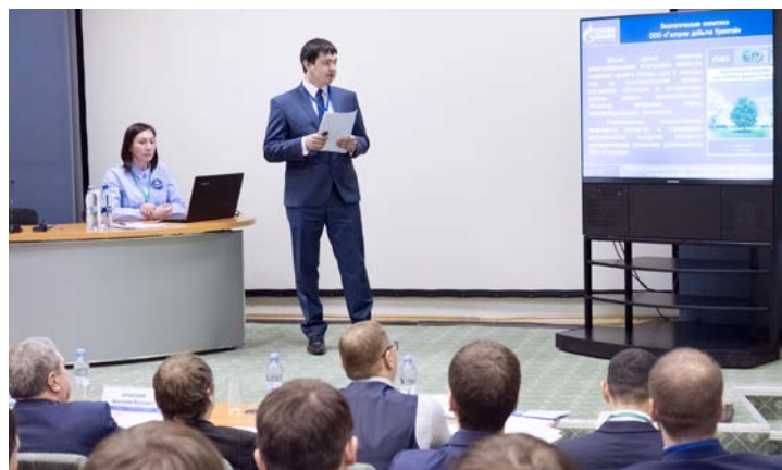
На форуме было представлено почти 100 докладов в восьми секциях. Главными слушателями стали эксперты – заслуженные специалисты в деле нефтегазодобычи

Ими молодые специалисты обменивались в течение целого дня работы форума. Около ста представителей 33 компаний топливно-энергетического комплекса представили свои доклады на семи секциях конференции, каждая из которых была посвящена основным направлениям деятельности предприятий ТЭК. Еще в одной секции выступили ученики «Газпром-классов» и «Ачимгаз-класса», для которых форум – это не только первые шаги в науку, но также важное профориентационное мероприятие и возможность поближе познакомиться с профессионалами нефтегазодобычи. Самые компетентные и опытные среди таких профессионалов предстали в роли экспертов, решающих судьбы призовых мест, указывающих на сильные и слабые стороны научных изысканий молодежи.