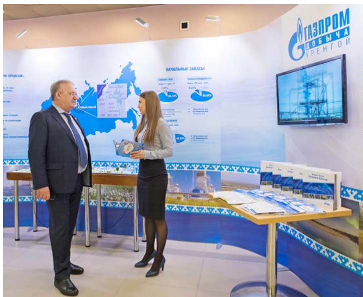
Стенд Общества стал частью масштабной выставки