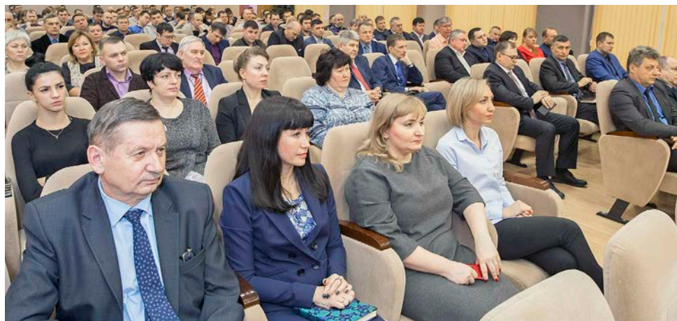
Газодобытчики готовы выразить свою гражданскую позицию