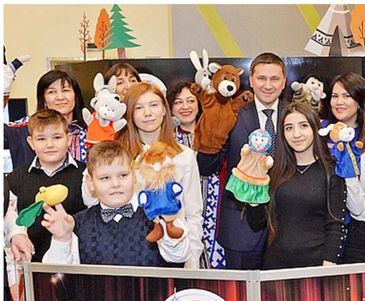
«Сказка на ладошке» – победитель конкурса социальных проектов Общества