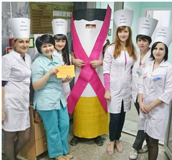
Выступает против дыма медицинская дружина

– У нас на промысле не так уж и много курильщиков, примерно пять процентов коллектива, и мы хотим им помочь