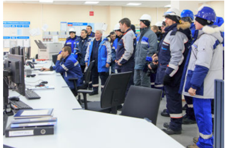
Молодежь Общества знакомится с опытом коллег

– На меня особое впечатление произвела высокопроизводительная установка синтеза метанола, обеспечивающая не-