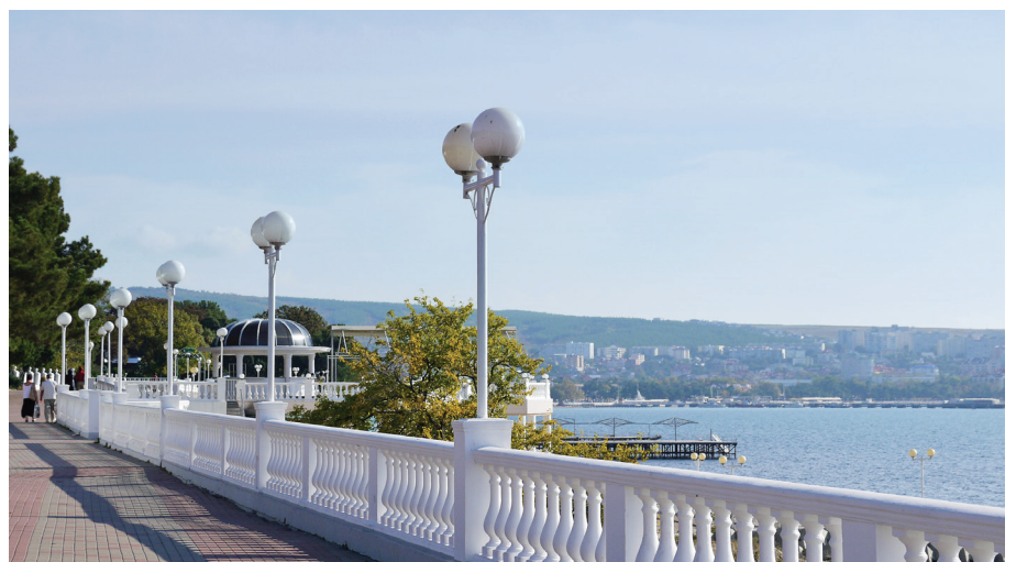
Набережная Геленджика.