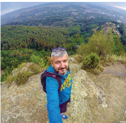
В окрестностях Кисловодска.