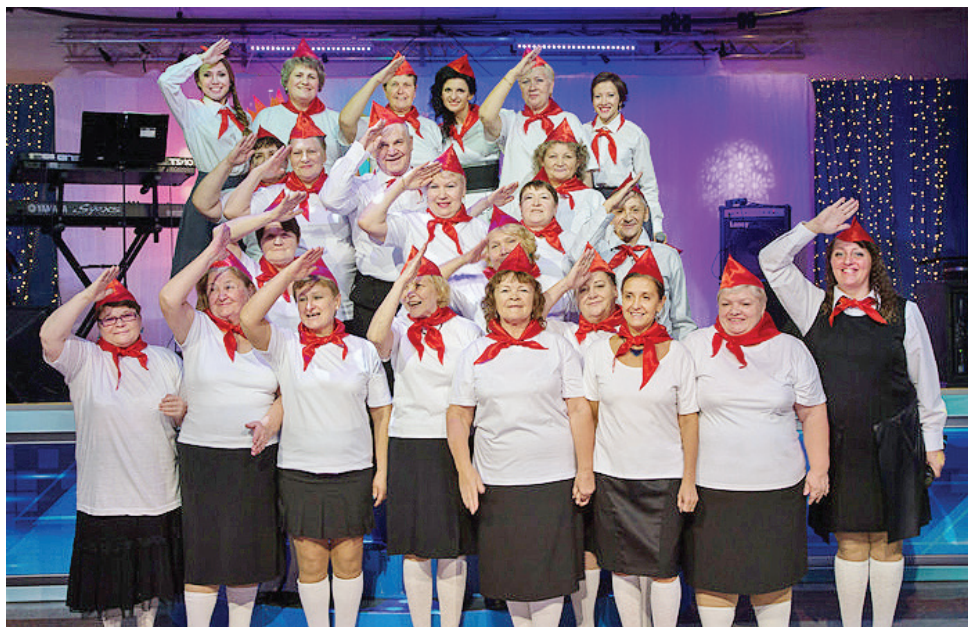
Всегда готовы быть активными и позитивными!

В КСЦ «Газодобытчик» в минувшую субботу традиционно чествовали пенсионеров Общества «Газпром добыча Уренгой». И каждое приветственное слово было неизменно уважительным, а каждое пожелание – искренним и теплым.