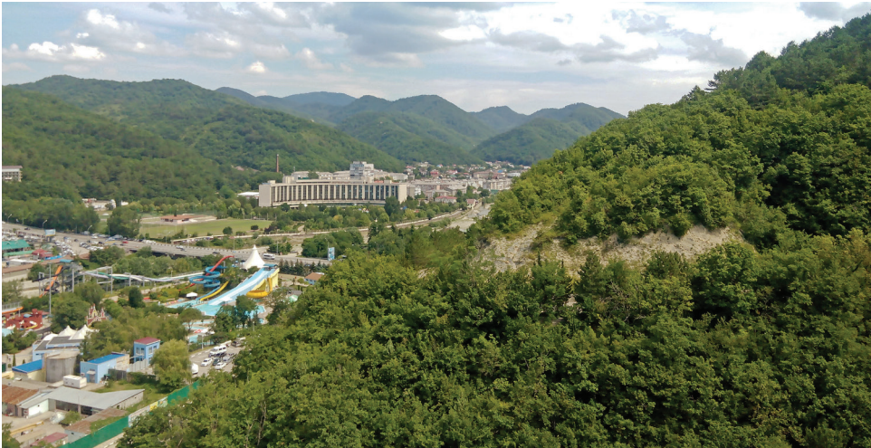
Отель «Молния», расположенный в поселке Небуг Туапсинского района, утопает в зелени и живописных горных массивах.

Полноценный отдых с возможностью не только отвлечься от трудовых будней, увидеть новые места, но и по мере надобности поправить здоровье, восстановить силы – это то, что «доктор прописал» каждому северянину. Оздоровительная кампания нынешнего года стала для Общества «Газпром добыча Уренгой» в целом успешной, о чем свидетельствуют и количество людей, отдохнувших по предлагаемым путевкам, и многочисленные положительные отзывы самих отпускников, их детей и пенсионеров предприятия.