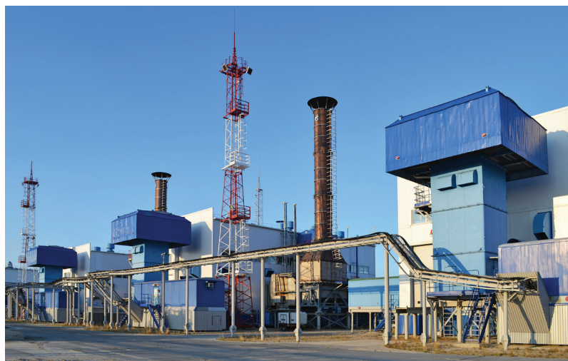
С нефтяного промысла № 1 началась история добычи уренгойской нефти

– В 2014 году, закончив Самарский государственный технический университет, я приехал на конкурс молодых специалистов, но показать лучший результат